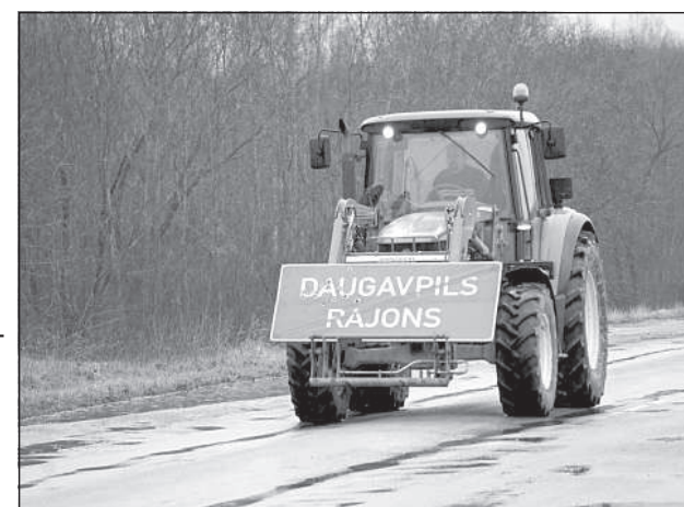
«Пуце, ты брешь латвийского народа».