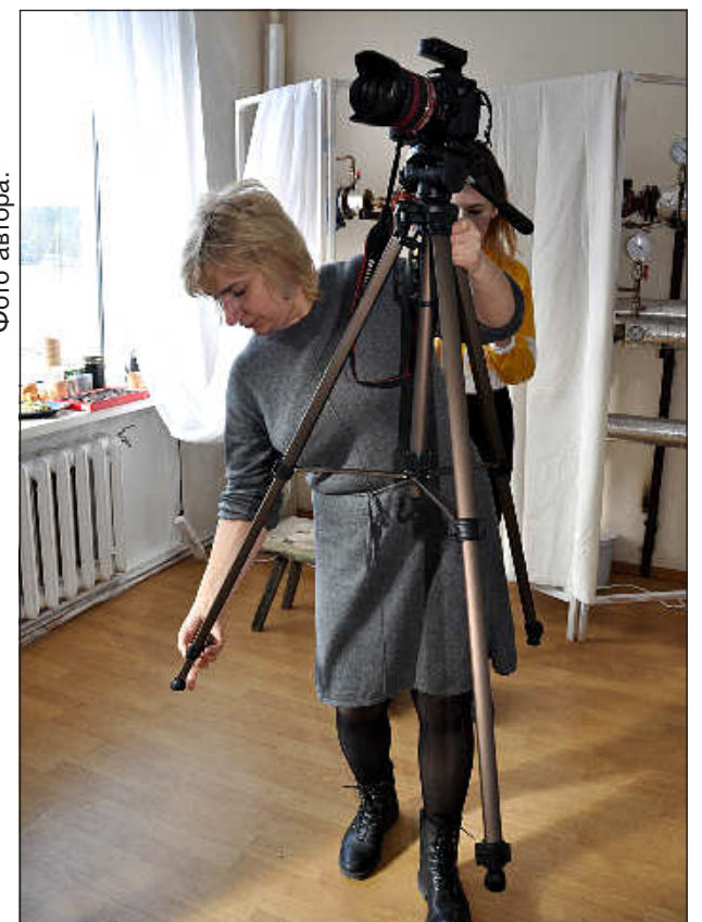
Подготовка к первой фотосессии.

В будни она руководит Науенским центром культуры, изучает дизайн одежды в Даугавпилсской «Саулес» школе, ткет в созданной ею вместе с друзьями студии «Raxti sēta» и наслаждается вре-