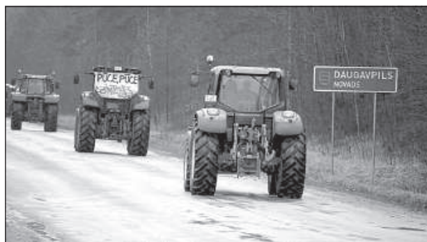
«Пуце, ты брешь латвийского народа».