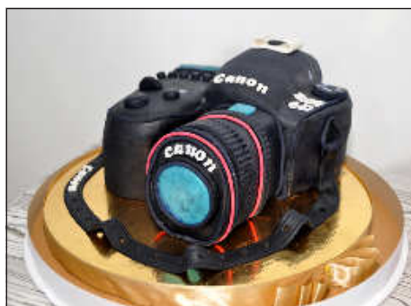
Праздничный торт в виде фотоаппарата.

Стоит отметить, что в этом году по Даугавпилскому краю путешествует ее фотовыставка «Признание», которая стала посвящением Науенской волости в год столетия Латвии, и уже побывала в Науенской волости и Ливанском крае.