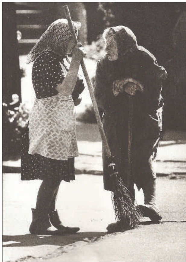
Фотография Виктор «Утренние новости» получила награду журнала «Фотомагазин».

Он, в основном, запечатлевает на своих фотографиях людей, которые пришли на какое-либо мероприятие или на праздник. Есть у него и пейзажи, ему нравится фотографировать природу, однако только не такую