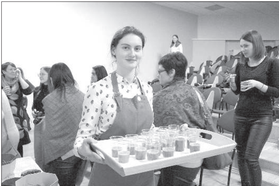
Участники семинара могли продегустировать приготовленное на мастер-классе по здоровому питанию.

Самоуправление Даугавпилса при поддержке европейских фондов и организации «OnPlate» продолжает организовывать в городе проектные мероприятия по укреплению здоровья и профилактике заболеваний. У жителей города есть право на несколько бесплатных занятий определенного вида спорта, также периодически проводятся лекции и семинары, на которых можно пообщаться с медиками и другими специалистами.