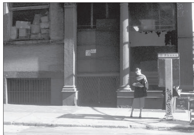
Выставка открыта до 30 марта.