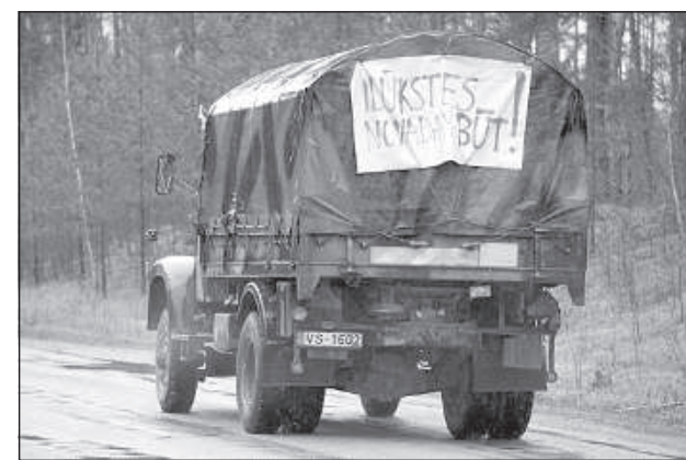
«Илукстскому краю быть!»

В тот же самый день в Сейме во втором чтении начали рассматривать Закон об административных территориях и населенных местах, для которого всего прислано 316 предложений. Акцию протеста поддержали 40 самоуправлений, ранее планировалось, что в ней будет участвовать более 400 единиц техники. ■