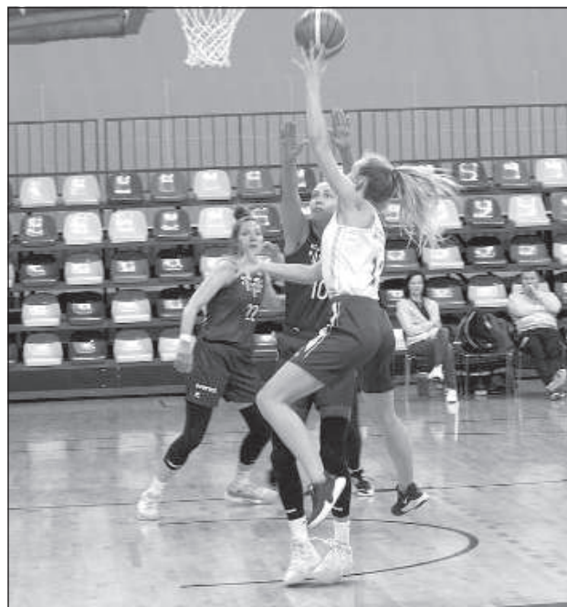
DU против ТТТ.

В связи с действующими в Латвии ограничениями, из-за которых пришлось прервать сезон профессиональных баскетбольных лиг и приостановить молодежную и любительскую лиги, на минувшей неделе Латвийский баскетбольный союз (ЛБС) решал, какие команды станут победителями сезона.