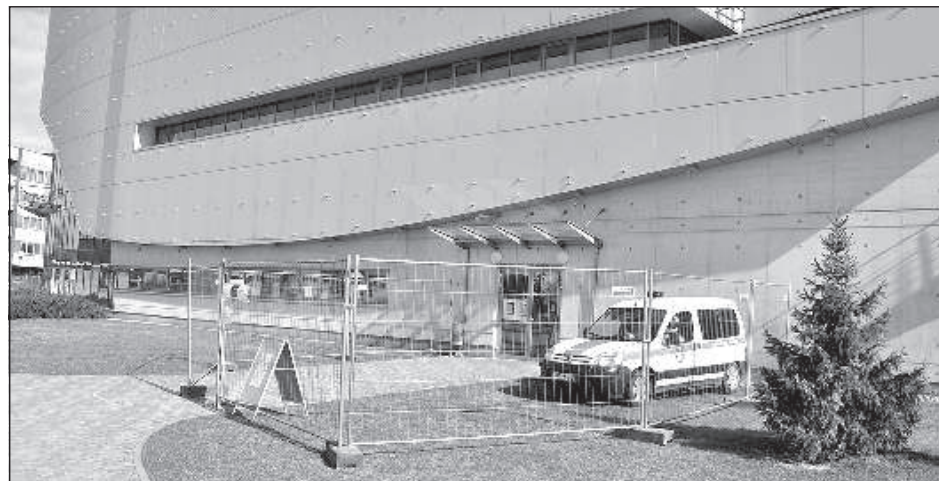
Пост полиции самоуправления возле входа в Центр спортивной медицины.

Важно, что в эти пункты приема анализов можно приехать только на своей машине, предварительно позвонив и записавшись по тел. 8303. Пешком, на общественном транспорте или такси приезжать запрещено! К тем, у кого нет машины, лаборатория приедет на дом. Самим, без