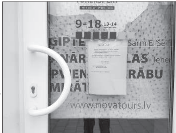
Работу приостановили туристические агентства.