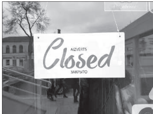
Закрытые предприятия общепита.