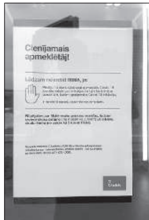
Банки работают в особом режиме.