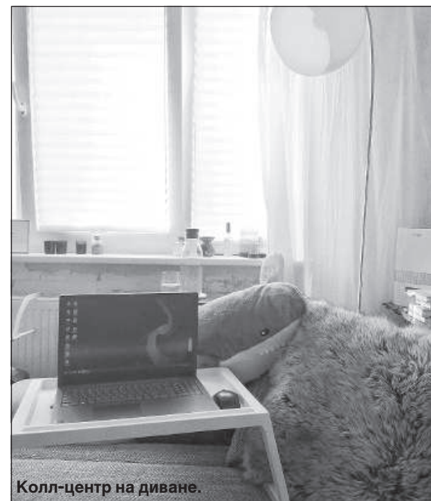
Колл-центр на диване.

В удаленке есть определенные плюсы, можно работать прямо в пижаме и не нужно тратить время на дорогу.