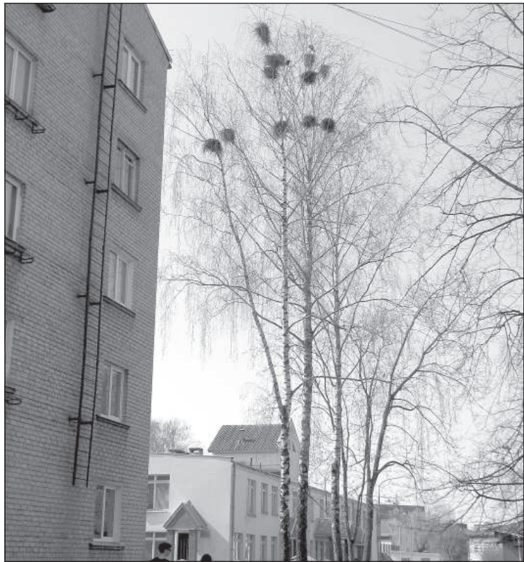
На Эспланаде от ворон нет спасения.

Анатолий Крылов С наступлением весны оживляется жизнь пернатых, среди которых вороны занимают особое место. Некоторые из них селятся в городе и причиняют жителям много бытовых неудобств. Их иногда сравнивают с волками – такие же разбойницы.