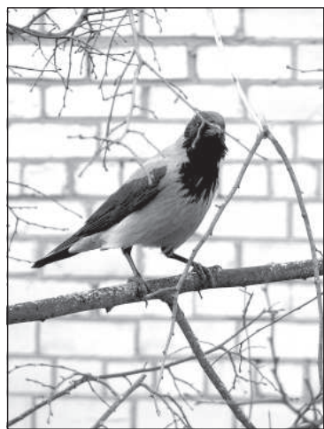
Ворона очень умная птица.

Известно, что вороны обладают аналитическим умом и блестящей памятью. Они очень сообразительны. Чтобы расколоть орех, птица не будет долбить скорлупу клювом, а бросит под колеса автомобиля. Эти птицы любят забавляться, катаясь зимой с горок и крыш домов. Черствый хлеб ворона предварительно размочит в воде. Птицы дружны между собой, если с одной из них случится беда, то собратья не бросят. Вороны злопамятны. Если их кто-то обидел, то они могут отомстить через много лет после инцидента. При миграции птицы облетают те места, где ранее погибло много сородичей.