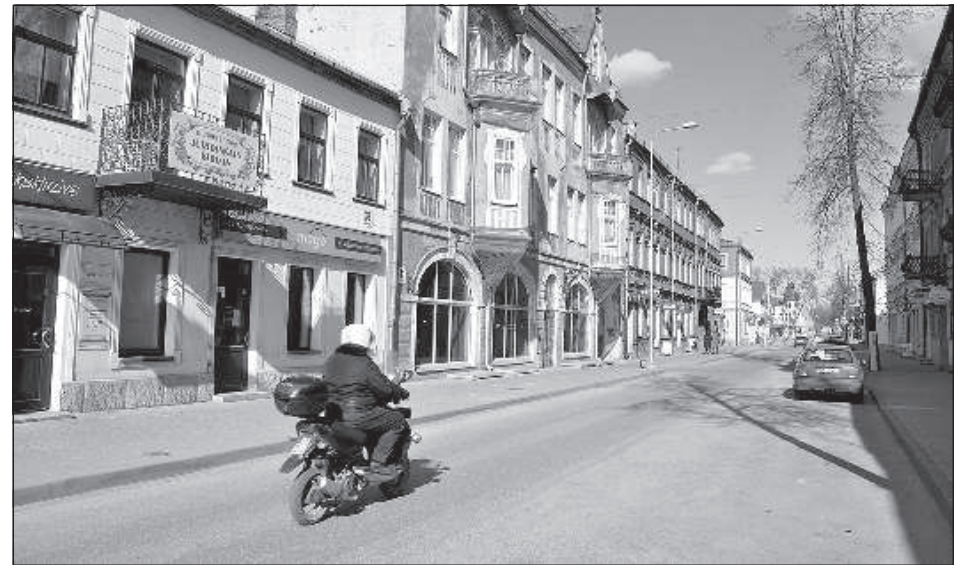
Пустые улицы Даугавпилса.

Он сказал, что самые большие подводные камни связаны с требованиями уплаты налогов, которые предприятиям общепита