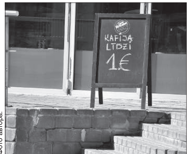
Кофе на вынос.

Одна часть жителей собиралась путешествовать авиа рейсами и были случаи, когда люди уже не могли улететь в свой пункт назначения, поскольку границы закрывались, но рейс не отменялся, потому что на нем доставляли домой репатриантов. В этих случаях деньги потеряны, поскольку