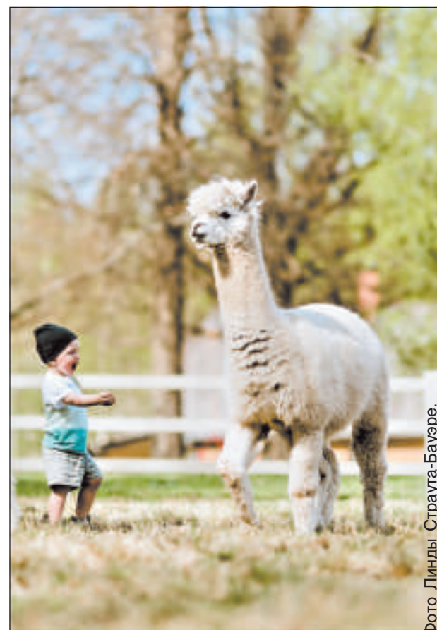
Альпака с малышом.