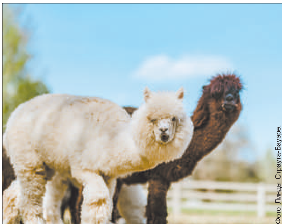
Фото Линды Страуга-Бауэре.

Началось время переоценки ценностей в мыслях, отношениях, ежедневных привычках, в продуктах, которые употребляем в пищу, для укрепления здоровья и в одежде. Действительно ли нужно столько синтетических, дешевых вещей, которые планете придется утилизировать или копить для будущих поколений? Тенденции в моде одежды начали меняться, возвращаясь к натуральным волокнам, которые тоже могут обладать свойствами, присущими современной спортивной синтетике. Все было «придумано» природой тысячи лет назад. Это так называемая шерсть альпака, которую мир признал высшим «достижением» произведенного животными волокна.