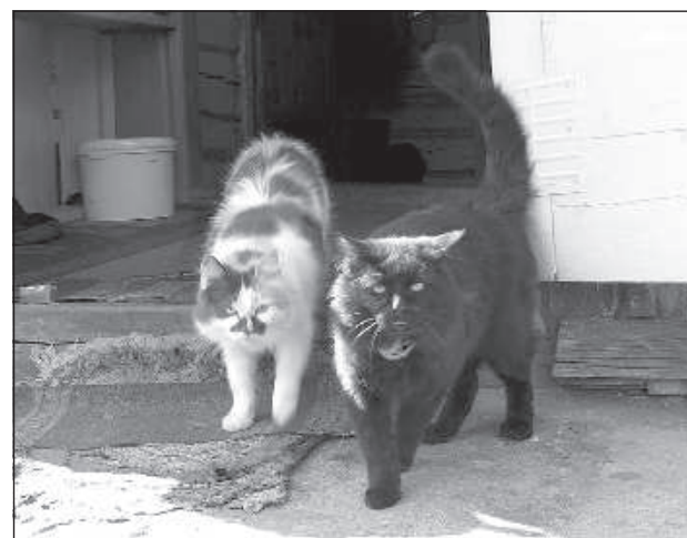
Коты исправно ловят мышей.

Хозяин заядлый рыбак, едва ли не на уровне здорового фанатизма. Свет-