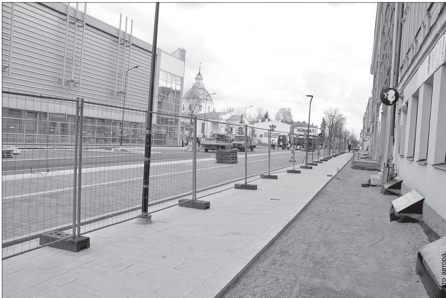
Улица Ригас сейчас.