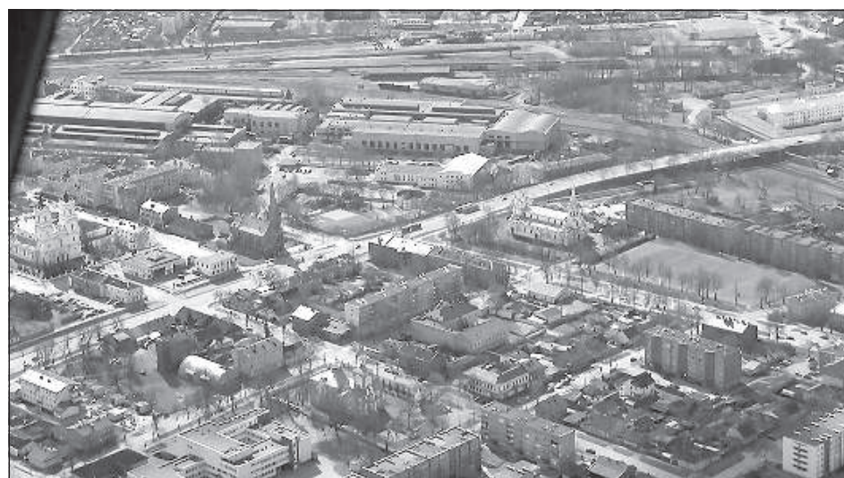
Кадры из фильма.