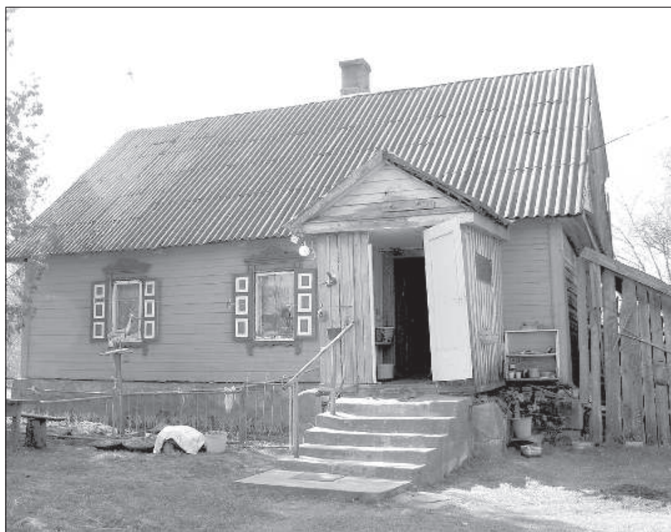
Дом сохранил свою оригинальность.

ва к приему хозяев усадьбы: «Что может быть приятнее, чем помыться и попариться березовыми веничками в своей родной баньке. Такое удовольствие ничто не может заменить. После процедур будто заново на свет Божий являешься».