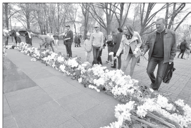
У мемориала в парке Дубровина возложены цветы.