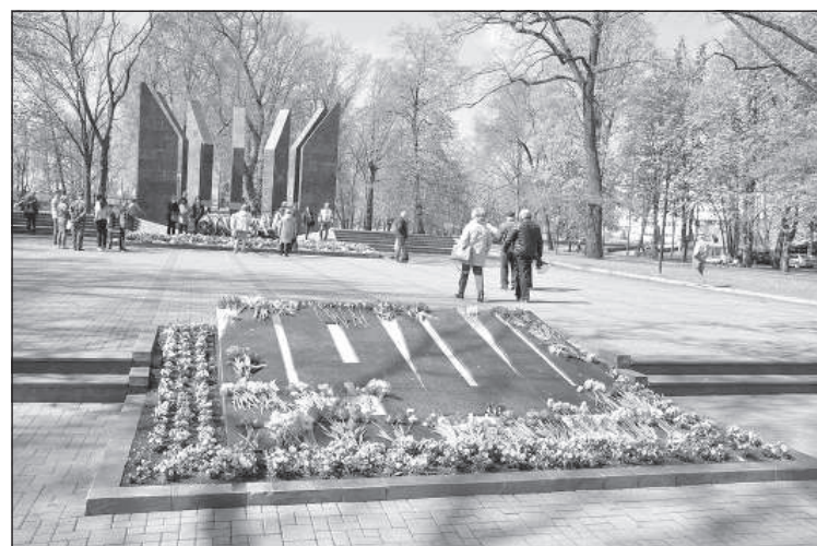
Люди возлагают цветы, соблюдая дистанцию.