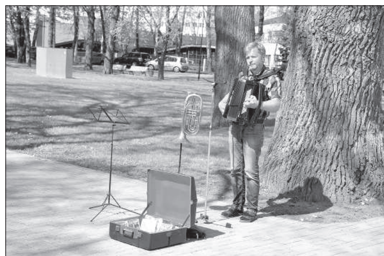
Уличный музыкант исполняет песни времен войны.