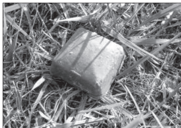
Так выглядит кубик с вакциной.