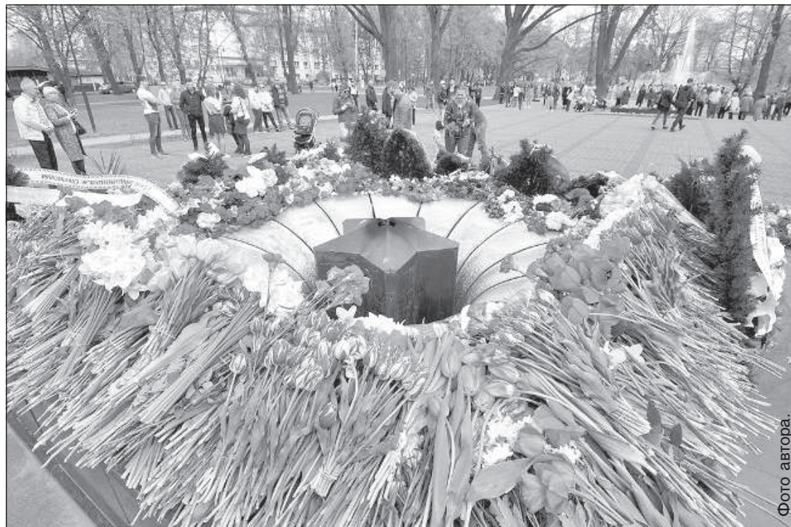
Цветы у вечного огня.