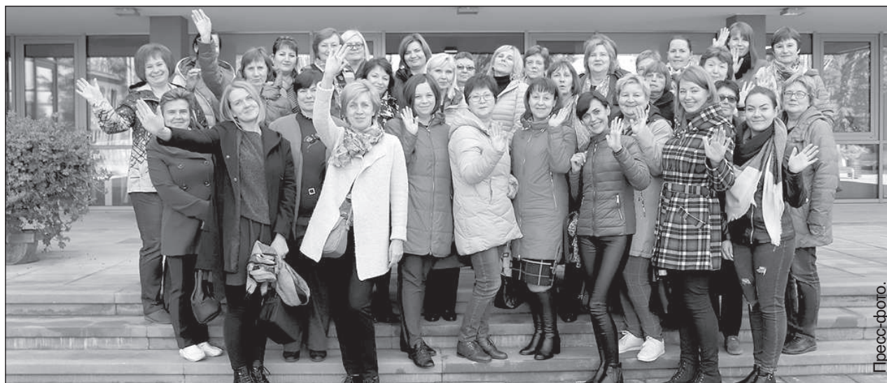
Коллектив Латгальской Центральной библиотеки.

Латгальская Центральная библиотека стала обладателем награды «Библиотека года», которую присуждает Латвийское общество библиотекарей за особые достижения в библиотечной отрасли.