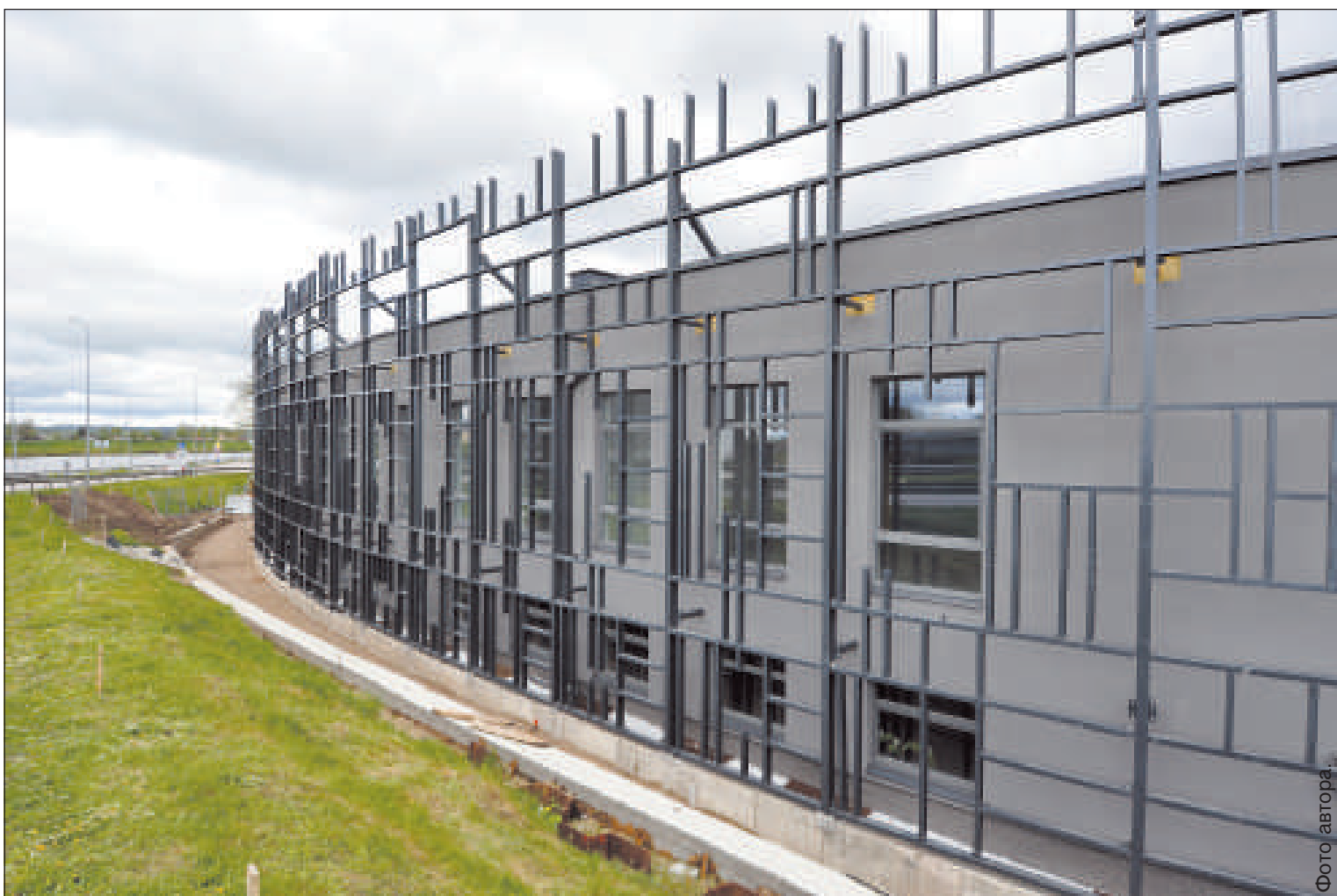
Новый корпус Саулес школы.