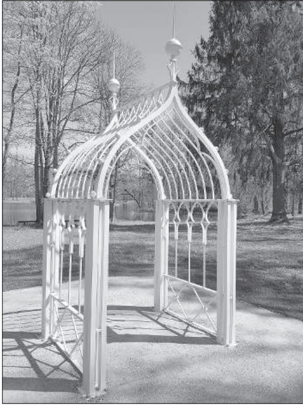
Арка — один из символов Прейльского парка.

В начале 2019 года депутаты Прейльской краевой думы утвердили концепцию развития комплекса Прейльского поместья и парка, в рамках которой провели исследование исторических материалов и природного разнообразия, обобщили нынешнюю ситуацию и составили планы на будущее. Также провели анализ структуры паркового пейзажа, подготовили решения и руководство к хозяйствованию.