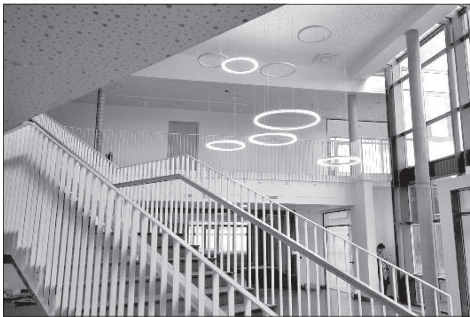
Фойе Саулес школы.

проекта будет модернизирована Даугавпилсская средняя школа дизайна и искусств «Saules skola», обеспечив соответствие учебной среды развитию