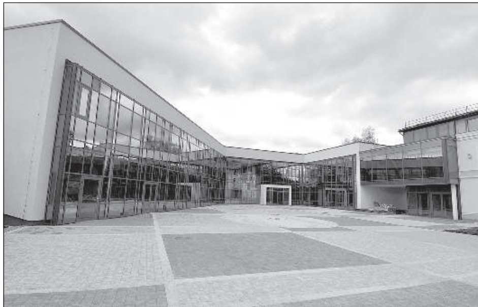
Двор Саулес школы.