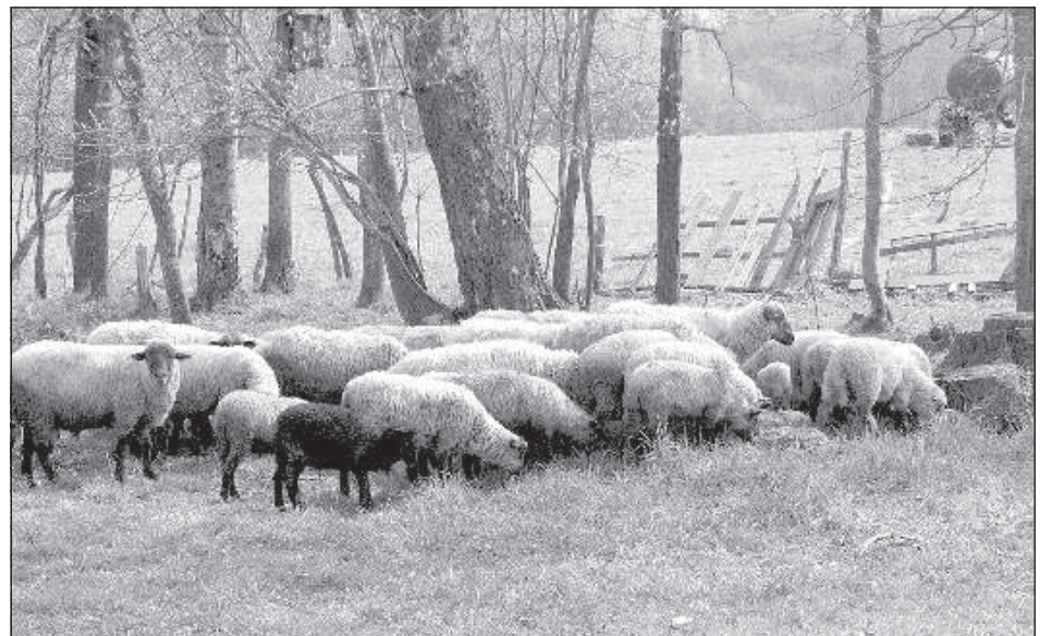
Овцы пасутся сами по себе.