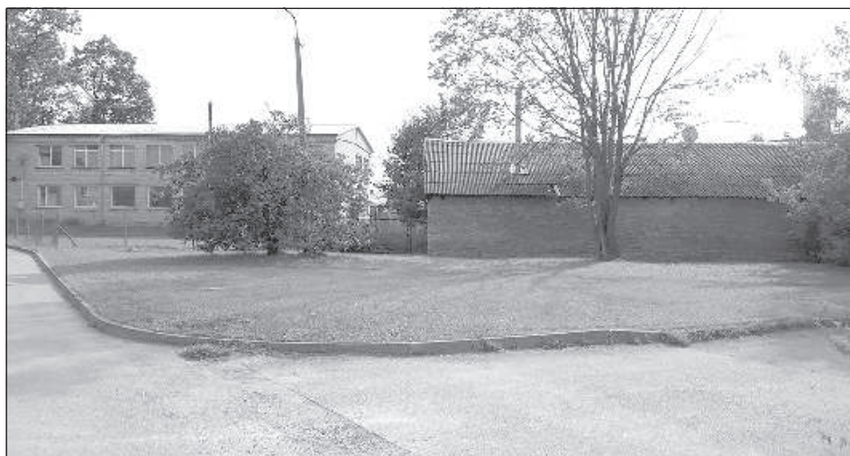
Место для зеленого рынка.