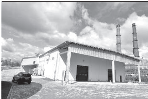
Производственное здание на ул. Менделеева, 5.

Это первый проект подобного рода в Даугавпилсе, когда самоуправление строит объект, а затем на аукционе передает его в пользование частному инвестору. Согласно условиям аукциона, предприниматель, получивший права аренды, должен создать несколько