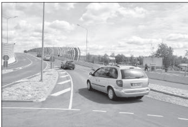
Путепровод соединяет район молочного комбината с Новым Строением.

Сейчас самоуправление готово двигаться дальше в решении данного вопроса, однако, чтобы развитие транспортного узла могло продолжаться, нужно, чтобы находящиеся у власти партии выполняли свои обещания и выделили на это финансирование. В случае благоприятного стечения обстоятельств 2-й этап проекта – строительство соединения с улицей Стацияс – может быть реализован не раньше, чем в течение 3-х лет,