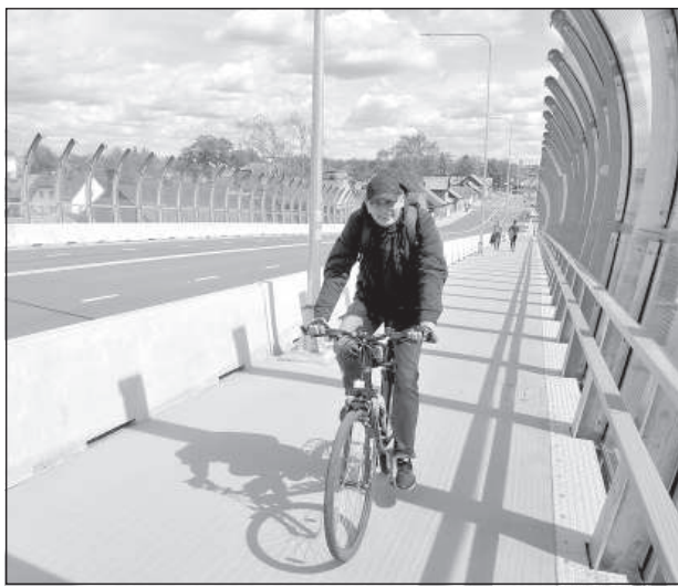
Путепровод удобен для велосипедистов.