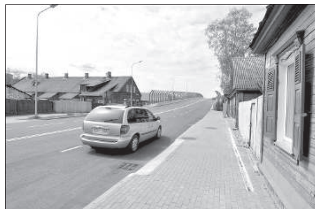
Новый путепровод построен вблизи жилых домов.