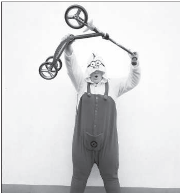
В гости приехал Миньон!

– Так же, как и многих других жителей Латвии, в соответствии со статусом самозанятого лица я получила пособие по простому. ■