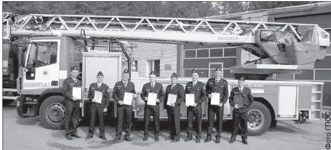
Награжденные сотрудники Даугавпилсской 1-й части.