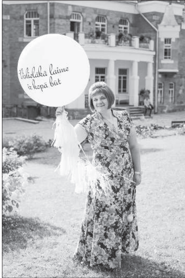
Быть вместе – это счастье!

Во время праздника приходится иногда менять сценарий, например, заказчик скажет про своих гостей, что они активные, танцуют, поют, а на празд-