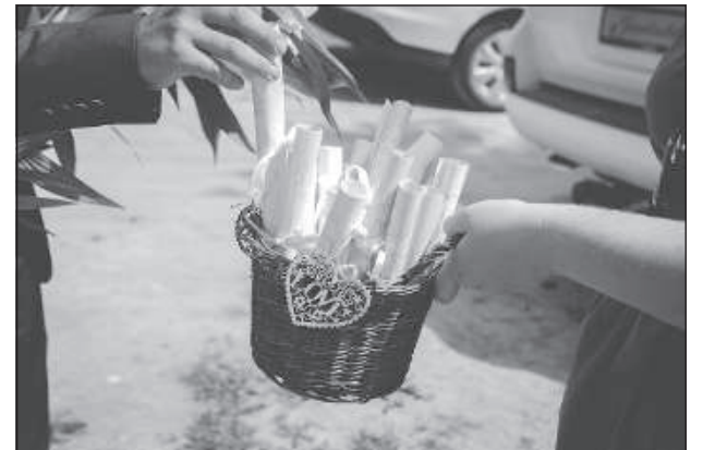
Гадаем на любовь с любовью.

– Приглашать на свадьбу тех людей, с кем общаются – семью и тех людей, друзей, с кем видятся ежедневно. Бывает так, что приглашают обязательно двоюродных, тетей и дя-