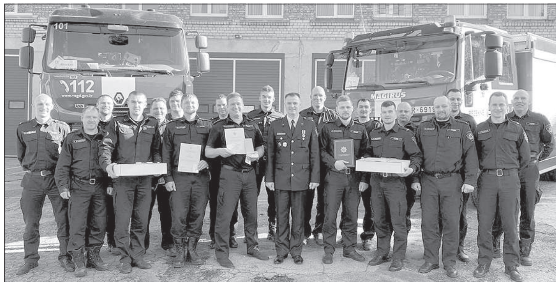
Награжденные сотрудники Резекненской части.