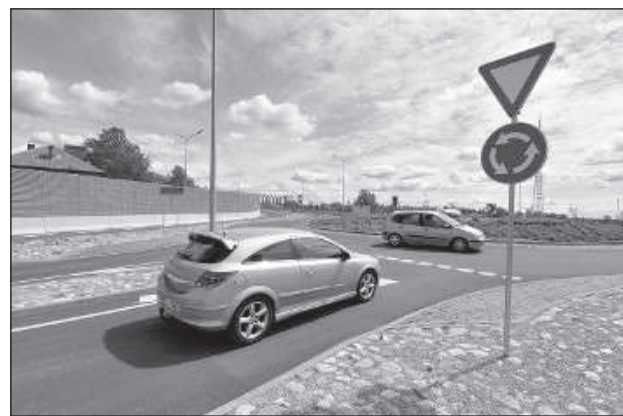
Круг перед путепроводом.

Общая стоимость строительства путепровода 13 млн евро, включая финансирование ЕС – 7,65 млн евро, дотацию из госбюджета и публичное финансирование – чуть больше 2 млн евро и долевое участие самоуправления – 3,3 млн евро. ■