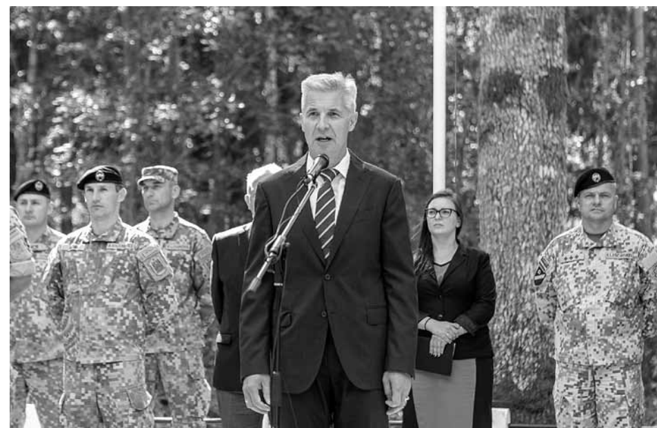
2019. gada augusts. Zemessardzes 28. gadadiena Oskara Kalpaka muzejā un piemiņas vietā Airītes.

Vīrs jau gadiem runāja, ka grib atgriezties. Es biju tā, kura darba dēļ uz to raudzījās piesardzīgi, bet radās iespēja strādāt tur, kur šobrīd esam abi. Kad bijām Rīgā, meitiņa savus vecvecākus redzēja reizi mēnesī, jo aizņemības dēļ biežāk