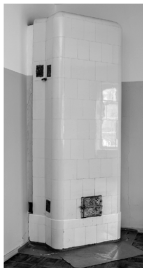
Ēkā saglabātas oriģinālās durvis, podiņu krāsnis.