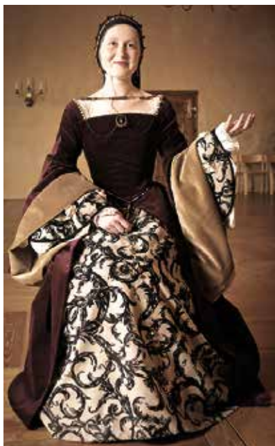
16. gadsimta tērps, kuru pasūtīja Bauskas pils muzejs.

Viešņa nekautrējās, ka nav kvalificēta šuvēja, iztiek ar patīkšanu "smalki ķimerēties" un koledža mācīto. Būtiska loma ir neparastai darbavietai 2000. gadu sākumā – dzīvesstila veikaliņā "Maize" viņa strādāja par šuvēju. Tur tirgoja topošo dizaineru apģērbu, taču reizēm klienti lūdza īstenot viņu dullības. Piemēram, uzšūt "baikas" jaku ar eņģeļa spārnītiem, vai džinsa biksēm piešūt treniņbikšu staras. "Tagad vairs nesaprotu, kā gan varēju uzšūt apģērbu klientam, kuru nekad nebiju redzējusi (pārdevējas uzklusēja iecerī un noņēma mērus). Tur īstenoju trakas idejas un iemācījos aizmirst par šūšanas likumiem. Atvērās visi vārti, jo man šūšanā nebija pareizi vai nepareizi." ■