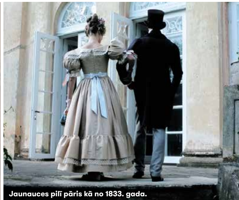
Jaunaucē pili pāris kā no 1833. gada.