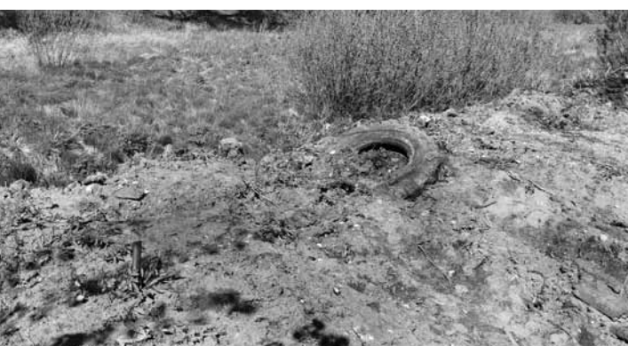
Kuldīgas vecā dzelzceļa mala pie Aizputes ielas: pirms Kurzemnieka apmeklējuma (apakšējais foto) un pēc (augšējais foto). Tomēr, vai zemes nobērtne te ir likumīga, vēl tiks izmeklēts.

Taču arī ielu malās savāktajam atkritumu klasifikatorā piešķirts kods 200303 – ielu tīrīšanas atkritumi. Kā skaidro Valsts vides dienests, veids, kādā tos izmantot, atkarīgs no tā, cik tajos piejaukumu: lapu, arī plastmasas vai stikla. Atkarībā no daudzuma tie vai nu jānodod poligonā, vai, ja smiltis ir pietiekami tīra, tie var tikt izmantoti inženiertehniskām vajadzībām: izraktu tilpņu aizbēršanai, ainavas veidošanai u.tml. Tomēr, ja ielu tīrīšanas atkritumus vēlas šādiem mērķiem izmantot, jānosaka to kvalitāte (vajadzīgas analīzes). Tāpat vajadzīga atkritumu reģenerācija, piemēram, sijāšana vai cita mehāniska apstrāde, lai noņemtu piemaisījumus. Nav pieļaujama neapstrādātu ielas atkritumu izmantošana lauksaimniecībā.