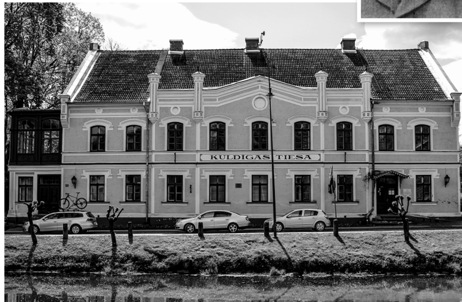
Kuldīgas tiesas nams 1880. gadā uzcelts kā advokāta ģimenes māja.

Citā reizē tiesāti nežēlīgi slepkavas. Viņi drošības dēļ apsargāti ar suni. „Suns jau iepriekš gan apcietinājumā, gan pratināšanās noziedzniekiem savā valodā bija pateicis to, ko par varmākām domā, un iedzinis bijību,” stāsta tiesnese A.Simsone. „Brīdī, kad tiesnesis pabeidza lasīt spriedumu un aplūka, suns skaļi ierējās, it kā