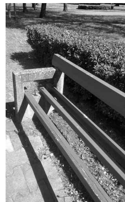
Kuldīgas komunālajiem pakalpojumiem bijis vajadzīgs pailgs laiks, lai 1905. gada parkā salabotu salauzto solu.

Kuldīgas novada domes speciālisti saka kuldīdzniecei paldies par vērību. Soliņš jau esot salabots. To, ka tas ir salauzts, Kuldīgas komunālie pakalpojumi , kas parku kopj, jau bija pamanījuši, bet pagājis laiks, kamēr trūkstošais dēlis piegādāts, sagatavots un nokrāsots. Arī laternas bojājums jau fiksēts, taču tādas laternas diemžēl vairs neražojot, tāpēc tiek meklēta cita. L.Rezevskas skulptūru KKP tīrot katru gadu. Diemžēl laikapstākļu ietekmē tā oksidējas, tāpēc izskatās apsūbējusi.