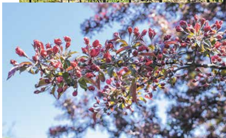
Dekoratīvā ābele ražo augļus pusotra centimetra diametrā, toties zied skaisti.

„Ar ķiršiem, plūmēm un persikiem vēl nevar zināt, kas būs. Kad ziedēja, laiks bija pavēss un mitrs, maz bija bišu, kas apputeksnē. Ogas aizmetušās ir, bet pēc tādiem laika apstākļiem tās, kas nav īsti apputeksnējušās, jūnija sākumā vēl var arī nobirt,” pārliecināts dārzkopis.