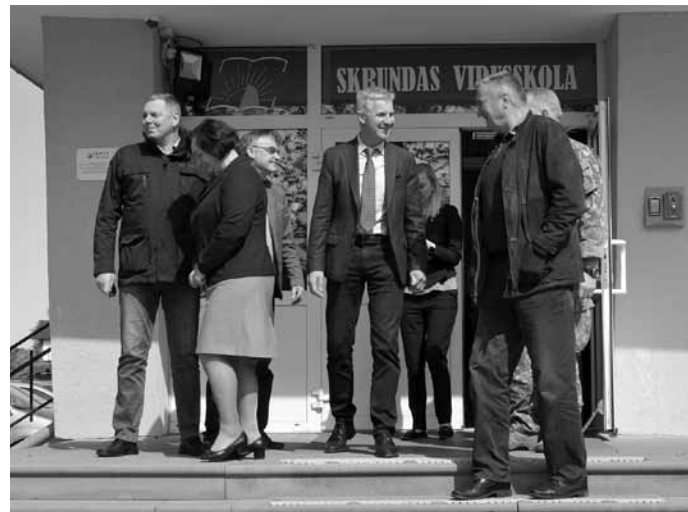
Kamēr Rudbāržu muiža tiek remontēta un pielāgota kadetu vajadzībām, Aizsardzības ministrija kopā ar pašvaldību izvēlējusies Skrundas vidusskolu kā pagaidu vietu, kur mācības var sākt ātrāk. Centrā ministrs Artis Pabriks.

22. maijā Skrundas vidusskolā viesojās aizsardzības ministrs Artis Pabriks. Vizītes mērķis bija kopā ar ministrijas un Zemessardzes pārstāvjiem apskatīt telpas, jo paredzēts, ka nākamā gada septembrī tur mācības sāks pirmie 25 kadeti.