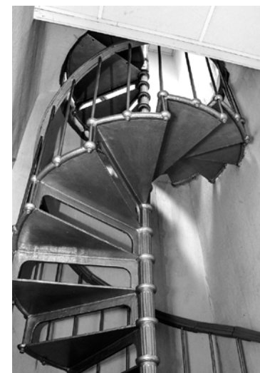
Tiesas ēka Kuldīgā ir vienīgā, kurā ir tādās vītņveida kāpnes.