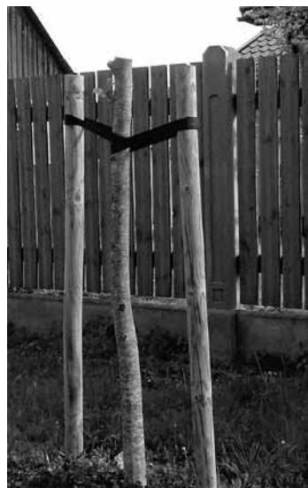
Ļaundara nozāģētās liepas vainagu ataudzēs, bet pilnvērtīgi koki tie nebūs.

Ja kāds liepiņu sabojāšanu ir redzējis, tas lūgts ziņot pašvaldības policijai pa tālr. 28881288 .