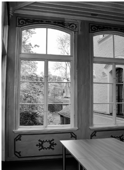
Darbinieku lielākais lepnums ir skaistā koka veranda otrajā stāvā.