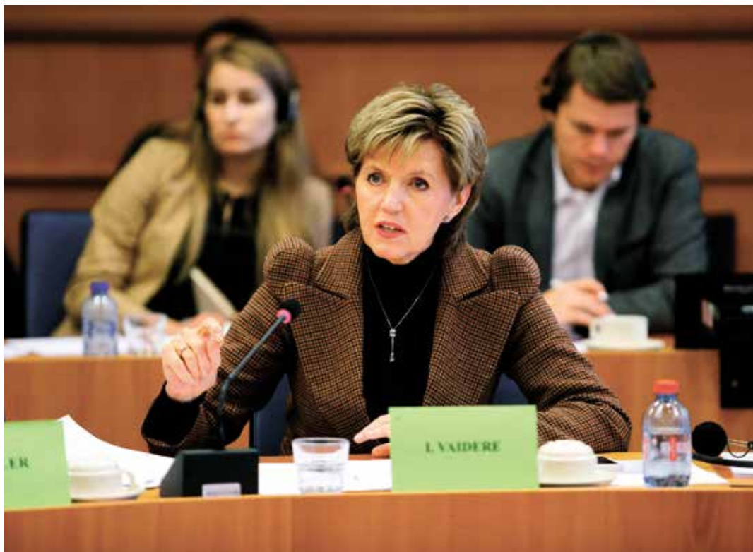
Prof. Dr. oec. Inese Vaidere, Eiropas Parlamentārās asociācijas un ĀKK – ES delegācijas viceprezidente