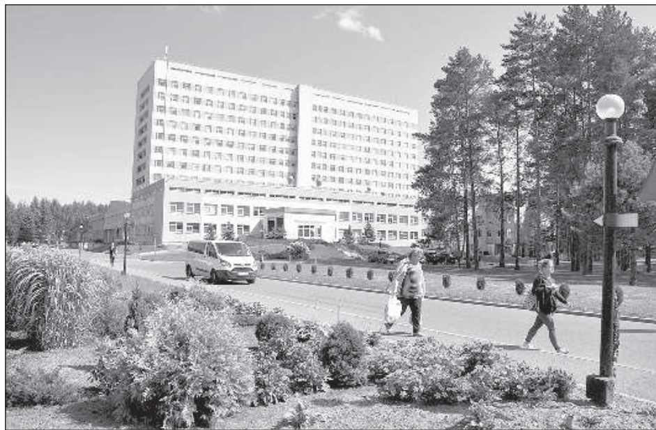
Даугавпилсская региональная больница.