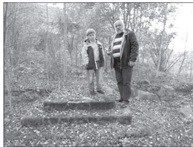
На ступеньках школы, в которой учился в детстве, 2013.

Уходит время шелестом травы. Воды журчаньем в чистом роднике. Знакомым скрипом множества дверей В том замке, что построен на песке.