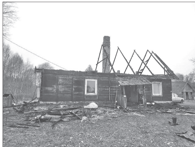
Visticamāk, ka ugunsgrēks izcēlies no skursteņa, jo elektrības vada bēniņos nebija. Šajā gadījumā nelīdzējās arī dūmu detektoros.

Sākotnēji Evijas ģimene patvērumu radusi māsas ģimenē. Visiem divtābu dzīvoklī vietas maz, tādēļ ģimene