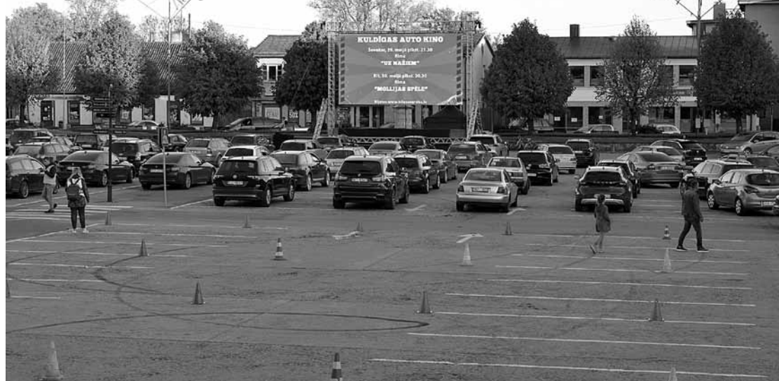
Kuldīgas Pilsētas laukumā, kas ikdienā tāpat pilns ar braucamajiem, pirmajā auto kino seansā detektivfilmu Uz nažiem iedzīvotāji noskatījies no 90 automašīnām.

Kuldīdzniekiem piedāvāti arī divi auto kino seansi. D.Reinkopa gan atzina, ka citu tuvākajā laikā vairs nebūšot, jo Pilsētas laukuma un ielu slēgšana ir gana sarežģīta, process ir arī dārgs, jo