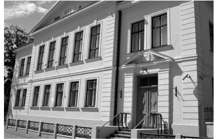
Neoklasicisma namu Dzirnavu ielā rotā gadskaitlis 1934. Kuldīgas novada muzeja speciālisti tomēr izpētījuši, ka agrākā banka uzcelta 1931. gadā.