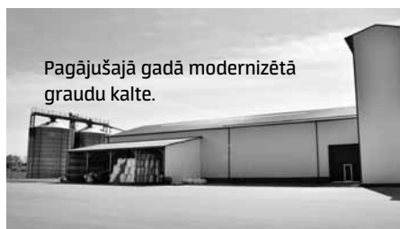
Pagājušajā gadā modernizētā graudu kalte.