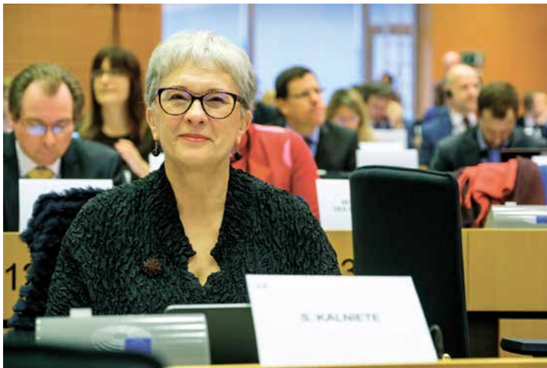
Sandra Kalniete, Eiropas Tautas partijas grupas viceprezidente

Tajā darbojas 187 no 705 EP deputātiem. ETP grupā strādā Latvijas deputātes – Sandra Kalniete un Inese Vaidere. Eiropas Komisijā vadībā – priekšsēdētāja Uzruļa fon der Leiena, priekšsēdētājas izpildvietnieks Valdis Dombrovskis. Vairāk – www.eppgroup.eu