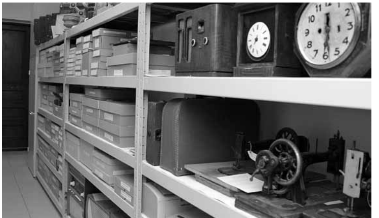
Krātuves slēgtajā daļā priekšmeti izlikti pēc specifiskiem glabāšanas apstākļiem. Visi ir izvērtēti un sagrupēti, meklējot labāko veidu, kā saglabāt ēku un izvietot krājumu.