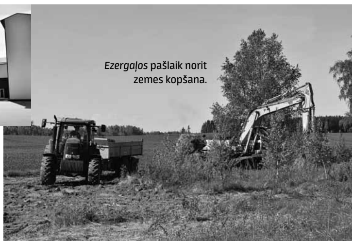
Ezergaļos pašlaik norit zemes kopšana.

„Darbinieki ir pazīstami, uz visiem var paļauties, un visi ir no Vārmes.”