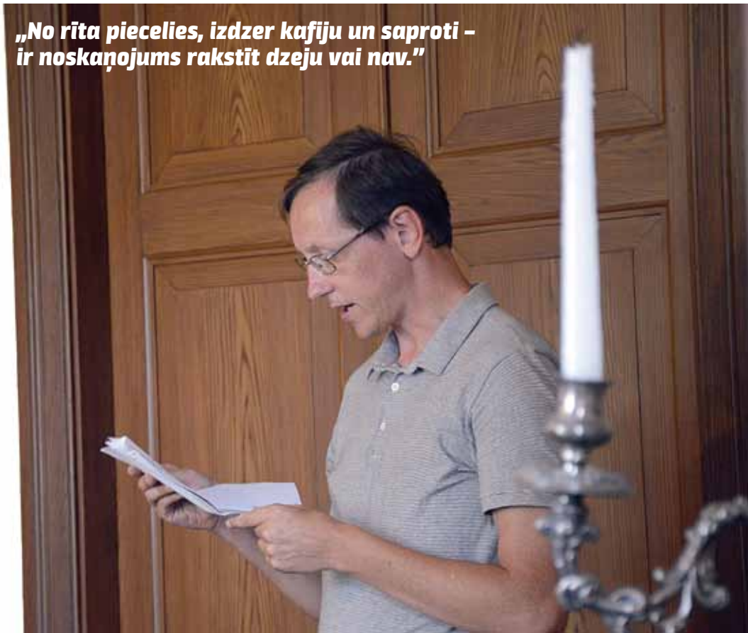
Dzejas pasākumā Kuldīgas novada muzejā 2018. gada vasarā.

„No rīta piecelies, izdzer kafiju un saproti – ir noskaņojums rakstīt dzeju vai nav.”