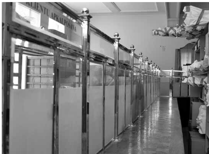
Otrajā stāvā varēs aplūkot atvērtais muzeja krātuves un bankas ekspozīciju, jo SEB banka nodevusi daļu no oriģinālajiem priekšmetiem. Atvērtajā krātuvē priekšmeti tiks mainīti.