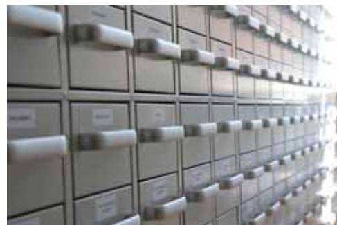
Priekšmetu glabāšanai metāls un stikls esot vispiemērotākie. Arī kartotēka, kurā katra lieta aprakstīta, stāv metāla skapjos, bet tie – telpā, kur bijis bankas pirmā direktora dzīvoklis.

Interjers bijis gana grezns. Tas tiks saglabāts ēkas atvērtajā daļā, piemēram, pakaramie. Noņemot vecās signalizācijas kastes, atklājies senāks sienu krāsojums. Pagaidām to neatjaunos, jo vajadzīga izpēte un restaurācija. Pašlaik sienas pārkrāsotas, bet ne vēsturiskajos toņos.