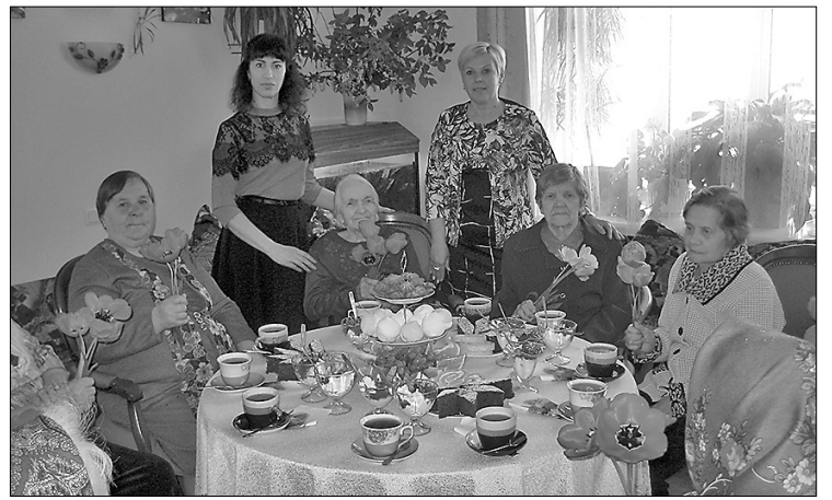
Несмотря на многие ограничения, мамам и бабушкам ЦСО «Рушона» на День матери был подарен праздник.

12 мая в центре социального обслуживания «Рушона», соблюдая все меры предосторожности, чтобы ограничить распространение вируса Covid-19, состоялось мероприятие, посвящённое Дню матери. В этот красивый весенний день природа была непривычно зимней: с утра выпал снег, но под его белым покрывалом цвела черёмуха, тюльпаны и нарциссы.