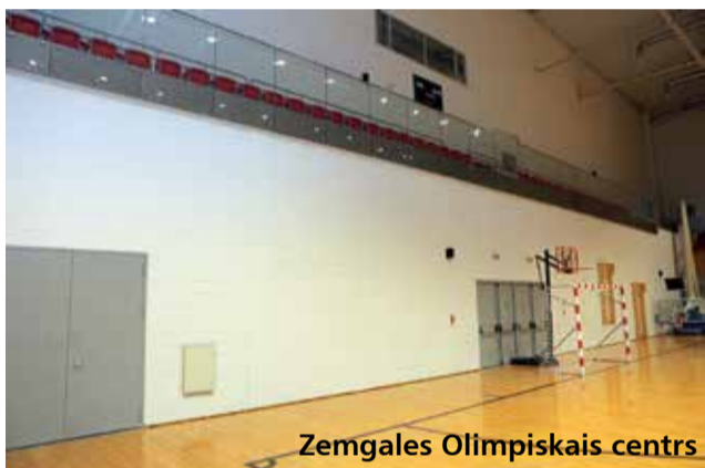
Zemgales Olimpiskais centrs