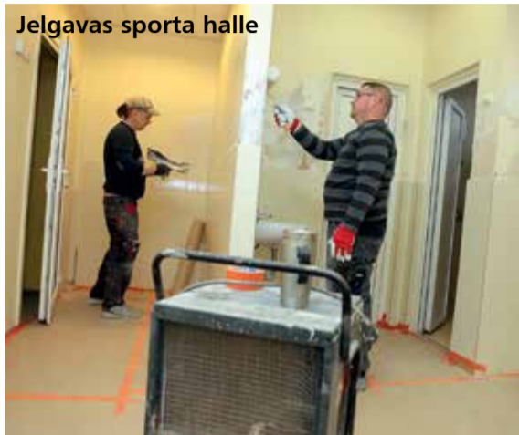
Jelgavas sporta halle