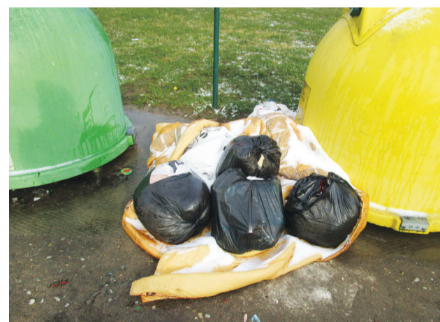
Šķirošanas konteineru laukumi nav paredzēti cietiem sadzīves priekšmetiem, mēbelēm, elektroprečēm, būvmateriāliem.

Vieglā iepakojuma paredzētajos šķirotu konteineros drīkst izmest plastmasas iepakojumu (piem., tukšas PET pudeles, cietās plastmasas pudeles un maisiņus, siltumnīcu plēvi), metāla iepakojumu (piem., skārda bundžas un metāla konservus), kā arī visa veida papīra un kartona iepakojumu (t.sk. kartona kastes, avīzes, žurnālus, brošūras, katalogus un citus reklāmas materiālus, kas nav laminēti).