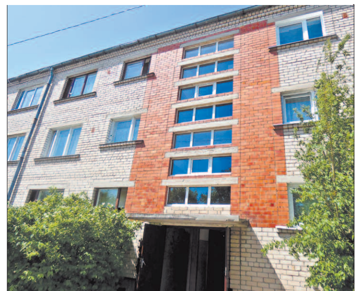
Jaunie PVC logi Viļānu ielā 2

Dzīvokļu īpašniekus aicinām izturēties saudzīgi pret kopīpašumu, saudzīgi atvērt un aizvērt durvis, nebojāt apgaismes ķermeņus un slēdzus, rūpēties par tīrību kāpnu telpās. Tikai darbojoties savstarpējā cieņā un sapratnē iespējama veiksmīga daudzdzīvokļu dzīvojamā māju apsaimniekošana!