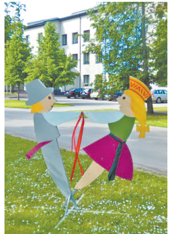
Noformējumus uzstādīja SIA «PREIĻU SAIMNIEKS»

Preiļu novada domes noformēšanas māksliniece