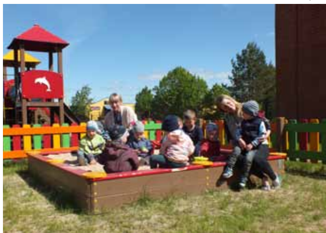
Bērnudārza grupa Brodos strādājusi visu pavasari un turpina strādāt. Pārtraukums būs vien no 6. līdz 31. jūlijam.

COVID-19 pandēmijas un sarkarā ar to noteikto ierobežojumu sākumā bērnudārznieku vecāki bija satraukti: ja reiz nedrīkst bērnus vest uz bērnudārzu, bet nav neviena, kurš viņus pieskata, jo pašiem jāiet uz darbu, tad... Ābeļu pamatskolas pirmsskolas izglītības iestāde Brodos visu pandēmijas laiku strādājusi, un visu "stingro ierobežojumu" laiku katru dienu to apmeklēja 2-4 bērni. Vai vecāki