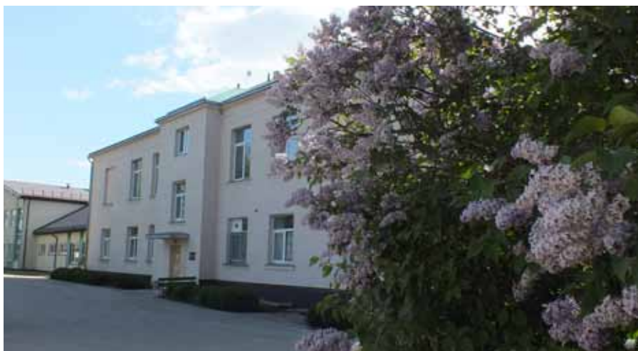
Mācību gads noslēdzies. Vasarai vārti vaļā.

Šis bijis skolēniem psiholoģiski sarežģīts laiks, kad mācībām grūti koncentrēties. Dažs labs brīvības garšu sajūtis audzēknis bija attālināti jāsagana un jāpārlicina uzdoto izpildīt, reizumis šajā procesā iesaistot arī vecākus. Tomēr, šo mācību gadu noslēdzot, Ābeļu pamatskolā nav neviena nesekmīgā, un te nu jāuzteic skolotāju un palīgpersonāla neatlaidīgais un pašizlīdzīgais darbs, organizējot tiešsaistes nodarbības un individuālās attālinātās konsultācijas, pedagogu darbadienai bieži vien ietilgstot pat līdz pusnaktij. Saskaņā ar Jēkabpils novada nolikumu “Par stipendijām 7.–12. klašu skolēniem Jēkabpils novada skolās” pieciem Ābeļu pamatskolas audzēkņiem piešķirts “materiāls stimul” arī turpmāk mācīties atbildīgi un