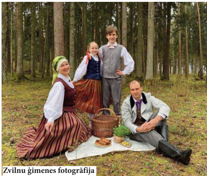
Zvilnu ģimenes fotogrāfija