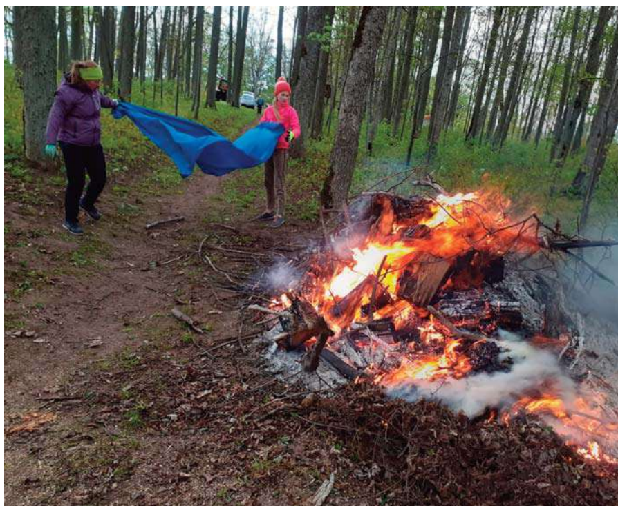
Mazzalvieši šogad talku organizēja Ērberģes muižas parkā