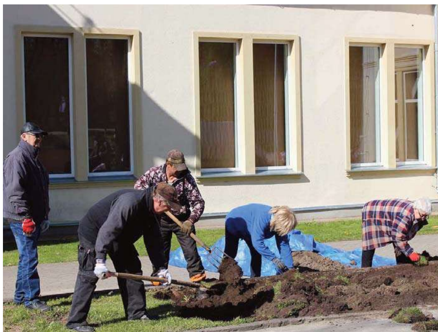
Neretas novada pašvaldības darbinieki un mākslinieciskās pašdarbības kolektīvu darbinieki labiekārtojas Neretas kultūras nama teritoriju

15. un 16. maijā Lielzāles muižas jeb bijušās Zalves pamatskolas parkā pavasara talku rīkoja Sēļu klubs. Skolas darbības laikā tika iekārtotas un koptas puķu dobes un apstādījumi pie skolas ēkas. Skolu slēdza 2009. gadā, un kopš tā laika puķes un košumkrūmi auga savā vaļā. Tā kā Sēļu klubs uzņēmies saistības apsaimniekot bijušās skolas ēku, tās apkārtni kluba biedri cenšas sakārtot un uzturēt sakoptu un tīru. Ēka ir liela un arī apstādījumu bijis pietiekami daudz, lai priecētu skolēnus, skolotājus, vecākus un visus zalviešus. Stādījumi un arī vecais parks prasa pastāvīgu kopšanu un uzraudzību. Neiztiek arī Zalvē bez nesaprotīgiem un vienaldzīgiem staigātājiem pa parka celiņiem garām skolas ēkai, kam nerūp apkārtnes kārtība un tīrība. Mēs