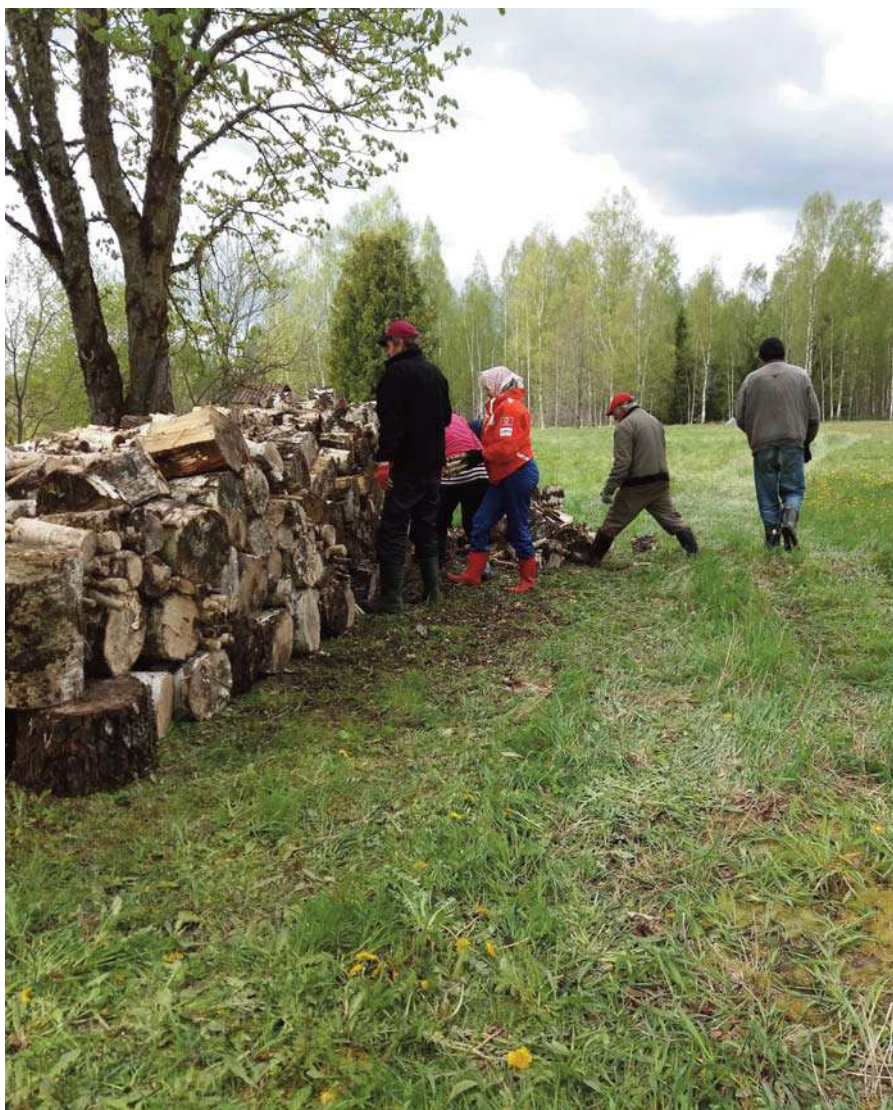
Biedrība “Upmales mantinieki” un pilskalnieši rosījās Gricgales kroga teritorijā, gādājot par malkas atvešanu no birztaļiņas un sakraujot grēdās