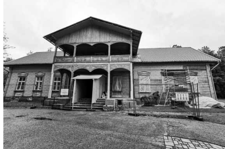
Virkas muižas fasādes un ieejas atjaunošana.