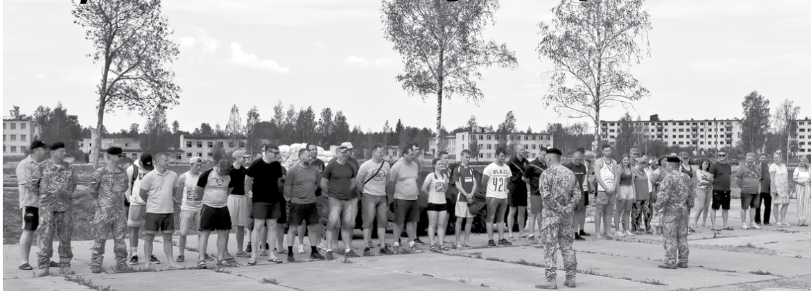
Šogad par Zemessardzes Jāņu kausa pludmales volejbolā cīnījās astoņas komandas, kuras pirms tam uzmundrināja Kurzemes brigādes komandieris pulkvedis Andris Rieksts.

Zemessardzes 45. kaujas nodrošinājuma bataljona Jāņu kausa izcīņā pludmales volejbolā 1. vietu un ceļojošo kausu ieguvusi Skrundas novada pašvaldības komanda.