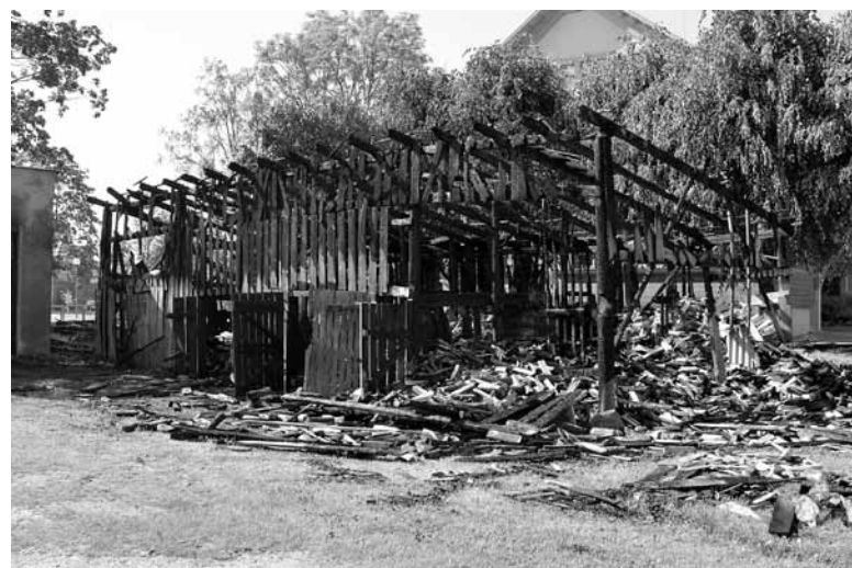
Kuldīgā, Pētera ielā, degošo šķūni VUGD darbinieki Jāņu naktī dzēsa aptuveni trīs stundas.

Valsts ugunsdzēsības un glābšanas dienests (VUGD) informē, ka no 19. līdz 25. jūnijam Kurzemes brigāde saņēmusi 34 izsaukumus: 16 uz ugunsgrēku, desmit uz glābšanas darbiem, bet astoņi bijuši maldinājumi.