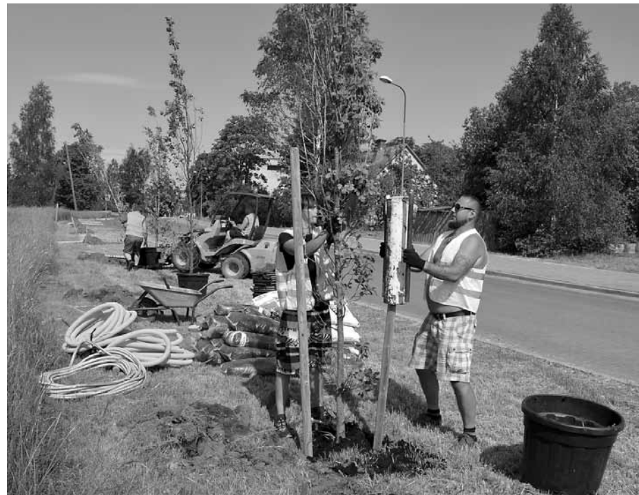
Lielāko daļu dižozolu Jelgavas ielā iestādīja brigāde no Siguldas stādaudzētavas Ķikši , no kurienes jaunie koki atvesti uz Kuldīgu.