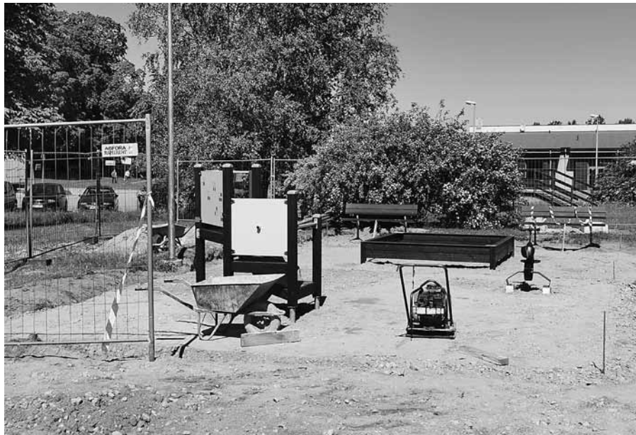
Visos trijos jaunajos bērnu laukumos Piltenes ielas mikrorajonā iekārtas jau uzliktas, segumam tiks izmantotas šķembas, ģeotekstils un gumijas flīzes.

Tā sauktajā Kurzemītes daudzdzīvokļu māju rajonā Kuldīgā sāka rotaļu laukumu atjaunošana. Tiks ierīkoti trīs: Gaismas ielā 1a , Gaismas ielā 9a un Skuju ielā 2 . Būvdarbu izmaksas – 50 523 eiro.