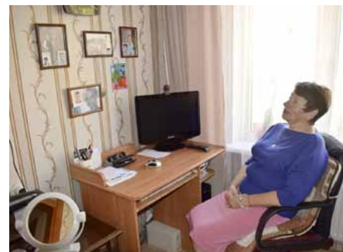
Nadeždai patīkot pasēdēt un pasapņot istabā, kurā pie sienas izlikta bērnu un mazbērnu fotogrāfijas.