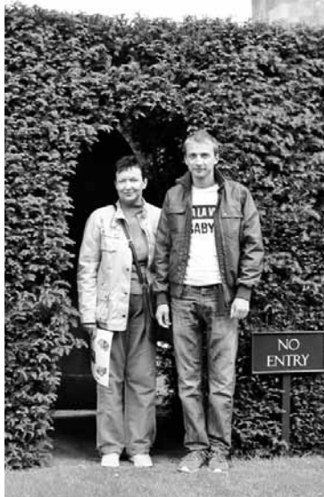
Ar dēlu Edžu 2016. gadā.

Pirmajā gadā visu laiku bija jādomā, vai mācu pareizi. Baidījies, ka neesmu nodevusi visas savas zi-