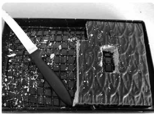
Būs saruna ar meitu. Kāda tēva atziņa no tvitera dziļumiem.

Par iepriecām un pabēdām ziņojiet Kurzemniekam pa tālr. 63350568, e-pasts: dina.porina@kurzemnieks.lv . Lasītāju vērojumi nav anonīmi.