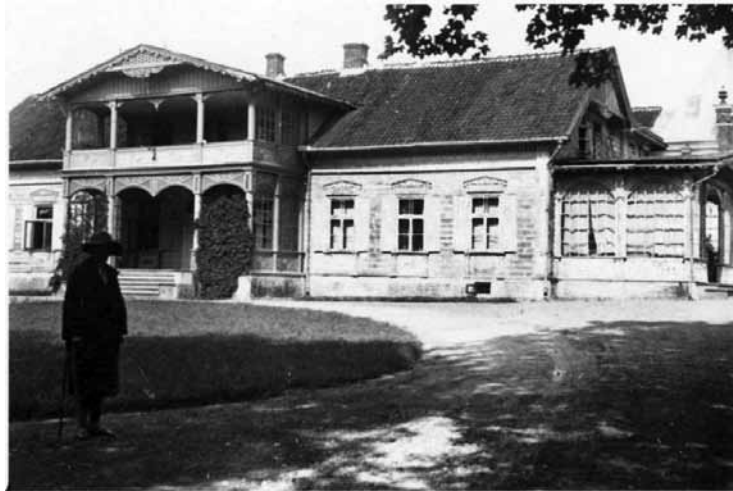
Virkas muiža 20. gadsimta sākumā.