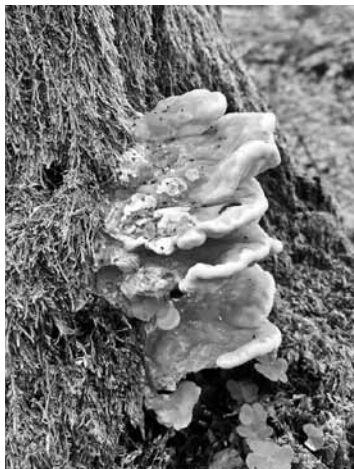
Sēra piepes atrodamas uz lapu kokiem un atpazīstamas pēc dzeltenās krāsas.

Latvijā aug vairāk nekā simts dažādu piepju, un sēņu speciālisti apgalvo, ka neviena nav indīga. Pateicoties veģetāriešiem un vegāniem, populāra kļuvusi parastā sēra piepe, jo tekstūras un garšas dēļ atgādinot vistas gaļu. Parastā sēra piepe sastopama bieži – uz lapu koku stumbriem, dažkārt arī uz celmiem, un to var atrast pat pilsētas parkā.