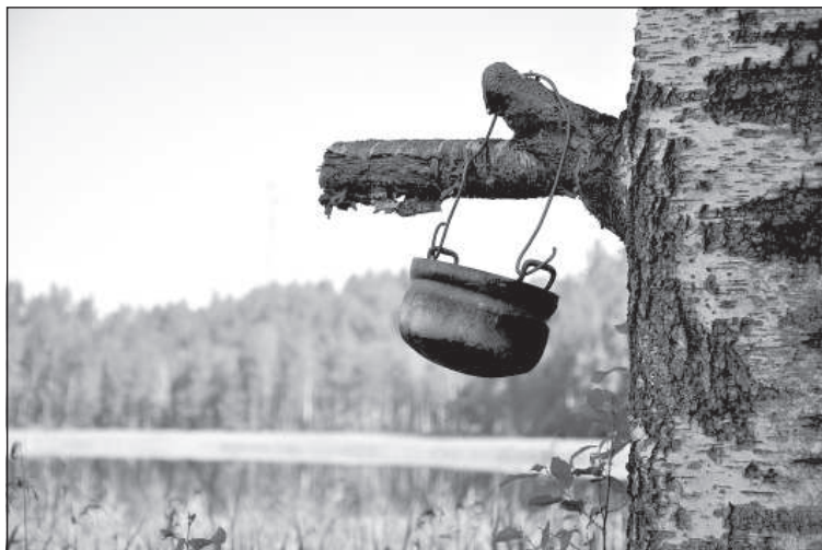
Котелок для ухи.

кам, потому что если у людей нет работы и нет денег, кто-то из них может заняться и противозаконным промыслом, в том числе, браконьерством.