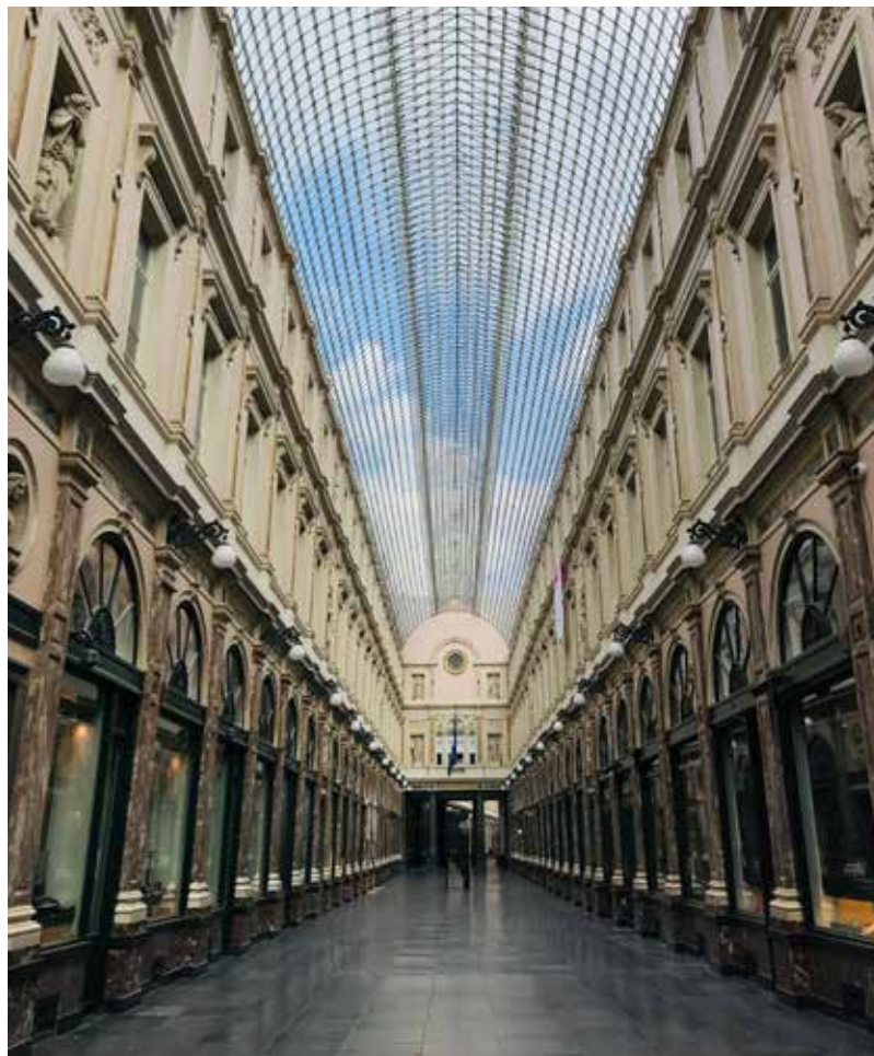
Pandēmijas laika iezīme. It neviena, tukša pat viena no pirmajām veikalu galerijām Briselē

Kad dinamiskajā Briseles dzīvē bija iestājusies liela klusuma un neziņas pauze, tas ļāva zāles asniem izspraukties cauri laikmetīgi stabilajam Vecpilsētas Lielā laukumā (Grand Place) bruģim, kas parasti būtu neiespējami dēļ nepārtrauktā tūristu un vietējo iedzīvotāju rosības šajā vietā. Šis laiks ir atstājis dažādus nospiedumus. Tas deva iespēju aizklīst pa Briseles ielām, kuŗās, šaubos, vai ikdienā būtu devies. Tā bija vienreizīga iespēja izjust pilsētu bezgalīgās klusuma noskaņās. Patlaban, kad automašīnu straume jau atgriezies pilnā sparā uz ielām un šosejām, reizēm pieķeru sevi domājam – varbūt tas bija tikai ilgstošs sapnis, ko man bija iespēja piedzīvot. Noslēgtība no pārējās pasaules, ieslēgšana konkrētās valsts robežas radija savā ziņā klaustrofobiskas izjūtas. To neviens vien man pēdējā laikā atzinis, ka bijis grūti samierināties ar šīs brīvības ierobežošanu. Vai kas ir mainījies? Eiropas valstu robežas atveras... Tāpat uz ielām – sastrēgumi. Izolētības laikā Briselē varēja pārvietoties straujos tempos ar sabiedrisko transportu. Tagad – reizēm iestrēgsti kā vēl pavisam nesenajā