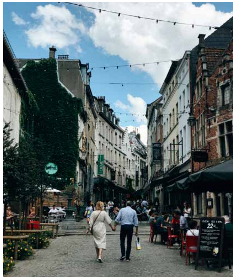
Cilvēki atgriežas ierastajā ikdienā. Ielas kļūst dzīvākas līdz ar restorānu un bāru atvēršanu