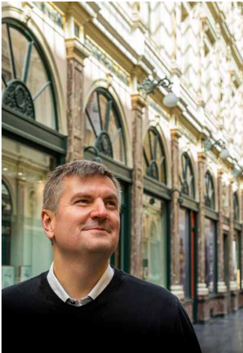
Raksta autors

tos attālumus. Vairs nav jācinās par vietu sporta nodarbības klasē, jo katram savs pleķītis un stūrītis ir iezīmēts un manā viedtālrunī jau laikus reģistrēts. Šķiet, viss jaunais normālais ir pieņemts kā sen labi zināmais... Tikai Beļģijas pasts nav īpaši mainījies. Jau esmu stāstījis par saviem piedzīvojumiem par paciņu sūtīšanu uz Latviju, kas divas reizes atceļoja atpakaļ uz manu Briseles adresi. Jāteic gan, ka vairāk nekā pēc mēneša sūtījumi tomēr sasniedza Tēvzemi. Taču nupat – piektdienas vakarā – bija zvans pie durvīm ar kaimiņienes sūdzību, ka esmu