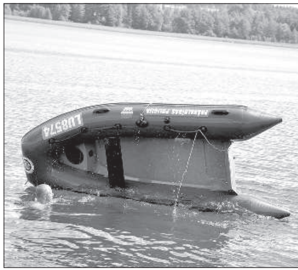
В озере перевернулась лодка.

Главные причины, почему люди попадают в неприятности, по мнению