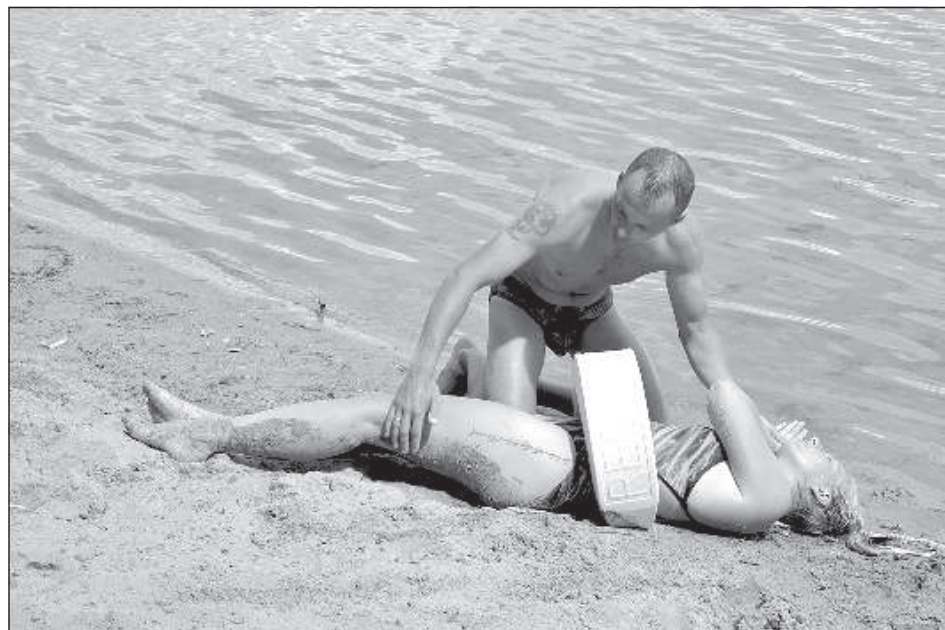
Утопавшая доставлена на берег.