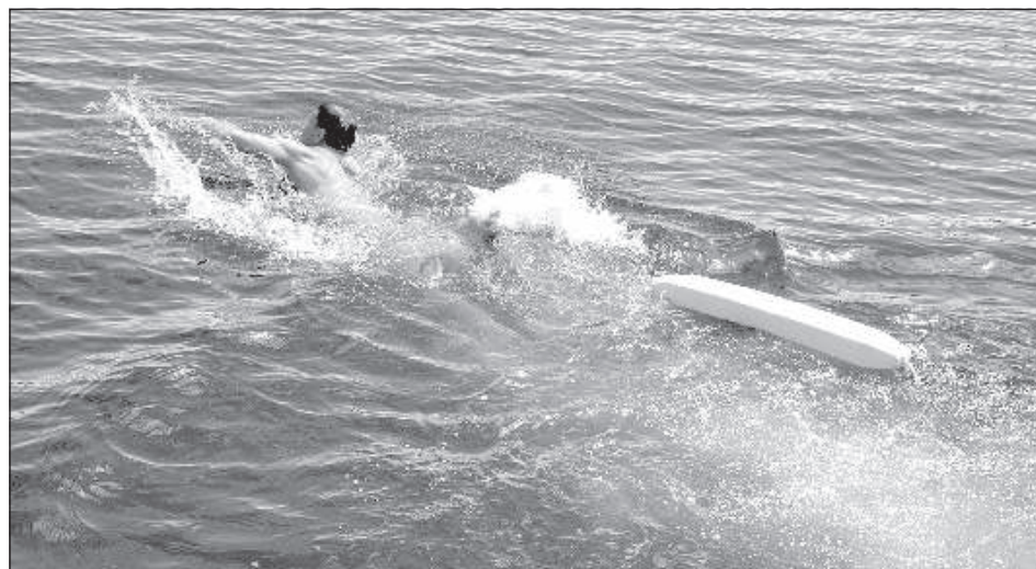
Спасатель отправляется на помощь утопающему.

мативы: плавание на скорость, плавание в одежде, ныряние, а в открытых водах – плавание на 2-километровую дистанцию.