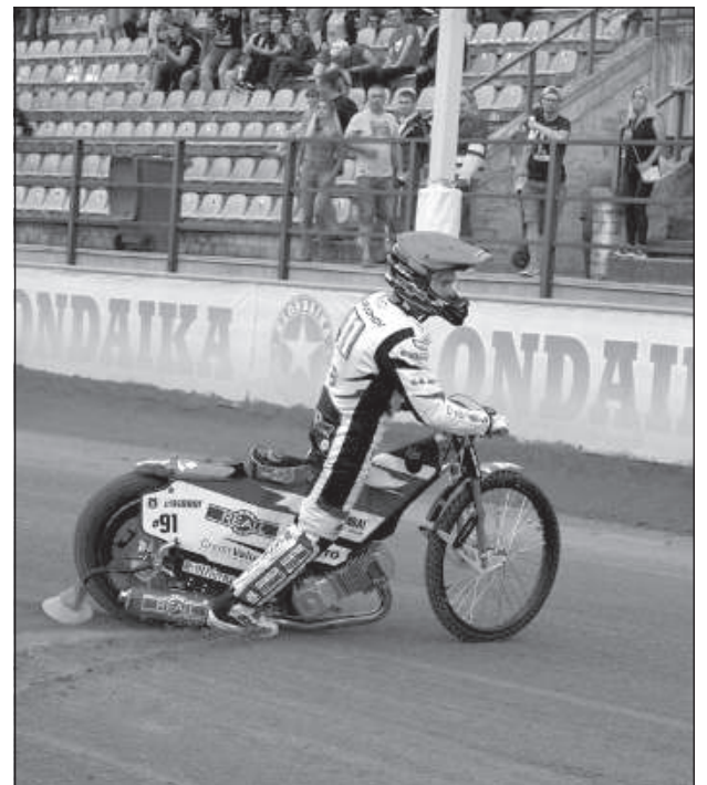
Чемпион благодарит болельщиков.