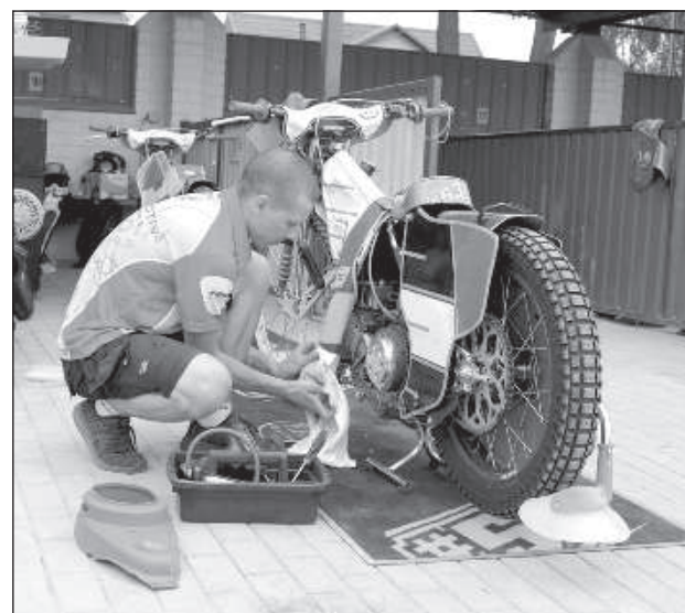
Последние моменты подготовки к старту.