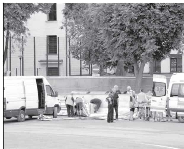
Падение, медицинская и техническая помощь.