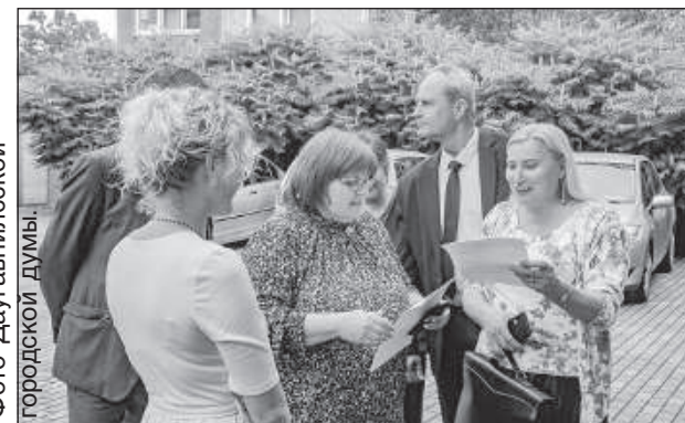
Встреча в ЦРК.

Ознакомившись с ситуацией, руководство города обязало руководство Центра русской культуры в ближайшие дни дать полный расчет по затра-