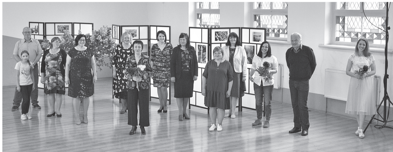
Fotokonkursa organizatori ar tā dalībniekiem pēc pateicību saņemšanas.

Apspriežoties ar konkursa dalībniekiem, tika secināts, ka šāds fotokonkurss jāorganizē atkārtoti!