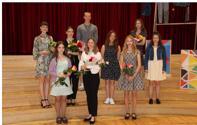
Krimuldas Mūzikas un mākslas skolas izlaidumā apliecības par profesionālās ievirzes izglītību saņēma 9 jaunieši

Paldies jauniešiem, viņu ģimenēm un pedagogiem par spēju šopavas pielāgoties attālinātajam mācību procesam un ar labiem rezultātiem nokārtot skolas beigšanas eksāmenus, izstrādāt diplomdarbus! 3 no mūsu absolventēm šogad beigušas arī pamatskolas 9. klasi, slodze ir bijusi liela arī pārējiem, bet, ja ir vēlme un degsme darboties kultūras jomā, tad izdodas! Novēlam saglabāt šo Mūzikas un mākslas skolā iegūto mīlestību un interesi par kultūras pasauli un turpināt pilnveidot savus talantus arī turpmāk!