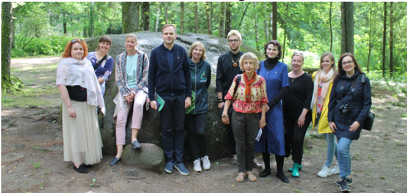
Krimuldas novada pašvaldības pārstāvji un viesi kopīgā foto pie Mudurgas akmens