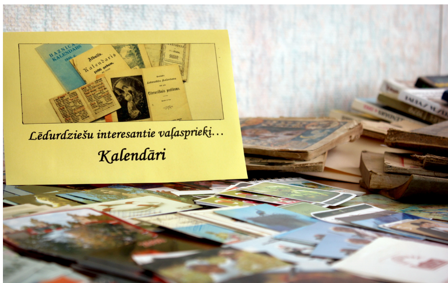
Drukāti kalendāri, ko pielikt pie sienas vai novietot uz galda, savu nozīmi nav zaudējuši arī mūsdienu digitālajā laikmetā

Padomju gados izdoto kalendāru klāsts kļuva vēl plašāks, jo tika izdoti dažādām nozarēm un iedzīvotāju grupām domāti