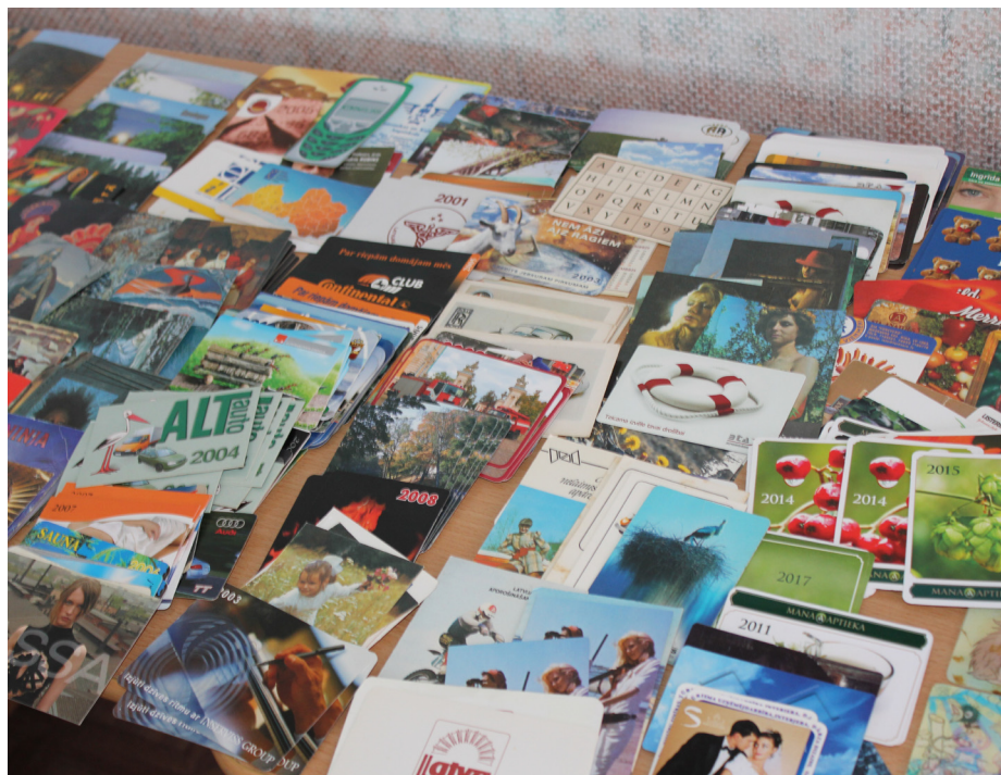
Izstādē apskatāmi dažādos gados izdoti kalendāri, sākot no 1920. g. līdz mūsdienām