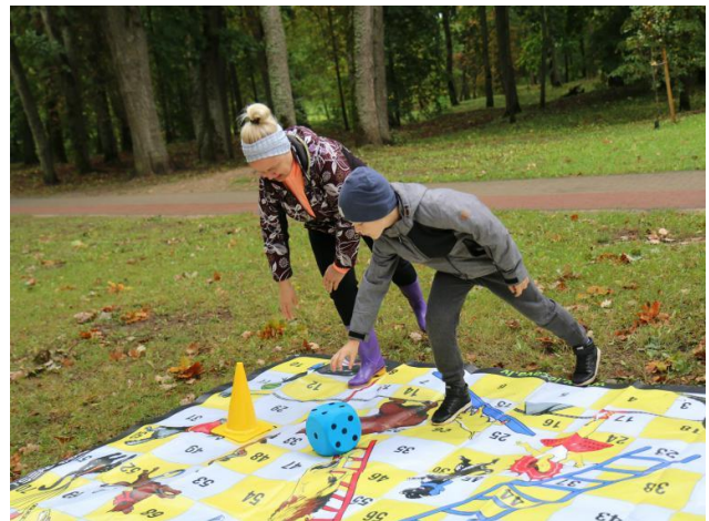
Foto: Projekta «Ģimenēm draudzīgas vides veidošana un ģimenes vērtību stiprināšana Iecavas novadā» ietvaros tika iegādāts inventārs un rīkots pasākums ģimenēm.

Turpinot attīstīt saturīgas brīvā laika pavadīšanas un veselīga un aktīva dzīvesveida veicinošu infrastruktūru bērniem un jauniešiem, 2019. gadā tika iesniegti trīs projekti ES līdzekļu saņemšanai - «Jauna rotaļu laukuma izveide brīvā laika pavadīšanas un sportisko aktivitāšu iespēju dažādošanai Iecavas novadā», «Daudzfunkcionāla sporta laukuma izveide Iecavas novadā» (abi projekti ELFLA, LEADER), «Skeitparka izbūve» (Interreg V-A Latvijas-Lietuvas programma). Visi projekti ir apstiprināti un 2020. gadā uzsāksies to realizācija.