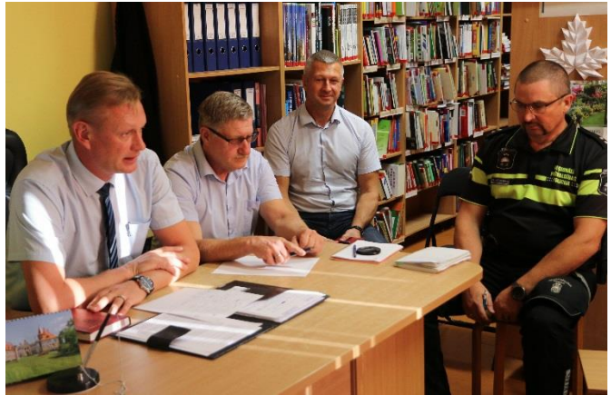
Foto: Pirmā iedzīvotāju un pašvaldības pārstāvju tikšanās notika 9. septembrī Rosmes bibliotēkā

Iecavas novada domes un komiteju sēdes ir atklātas un brīvi pieejamas jebkurai interesentam. Pēc domes sēdēm protokoli un lēmumi tika izvietoti uz ziņojumu dēļa domes kancelejā, un jebkurš apmeklētājs mēneša laikā varēja ar tiem iepazīties. Domes sēžu protokoli, lēmumi un audioieraksti pieejami pašvaldības portālā www.iecava.lv .