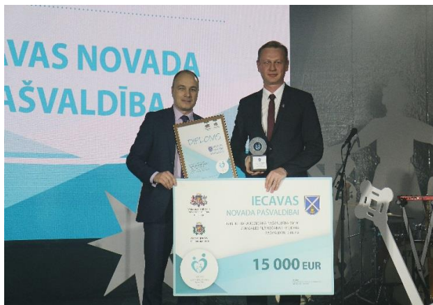
Foto: Folkloras svētku "Pulkā eimu, pulkā teku" noslēguma koncerta gājiens Iecavā 19.maijā un konkursa "Ģimenei draudzīgākā pašvaldība 2019" apbalvošanas ceremonija 16.decembrī.

2019. gada 16. decembrī svinīgā pasākumā Latvijas Mākslas akadēmijā tika paziņoti konkursa «Ģimenei draudzīgākā pašvaldība Latvijā 2019» rezultāti. Zemgales plānošanas reģiona pašvaldību grupā titulu un naudas balvu 15 000 eiro ieguva Iecavas novada pašvaldība. Konkursa vērtēšanas komisija Iecavas novada pašvaldību raksturoja šādi: «Tā ir pašvaldība, kura ielīksmo, pašvaldība, kura iedvesmo, iepriecina un ievilina, jo daudzi no Rīgas ir pārcēlušies dzīvot tieši tur. Ne velti, jo tur visiem pirmsskolas vecuma bērniem ir nodrošināta vieta pirmsskolas izglītības iestādē. Tā ir pašvaldība, kura iedzīvina labākās un vērtīgākās iniciatīvas». Konkursa noteikumi paredz, ka piešķirtā naudas balva pašvaldībai ir jāizmanto ģimenēm ar bērniem atbalsta pasākumu un pakalpojumu nodrošināšanai vai ģimenēm ar bērniem piemērotas vides veidošanai. Naudas balvu plānots izmantot rotaļu laukumu ierīkošanai novada ciemos.