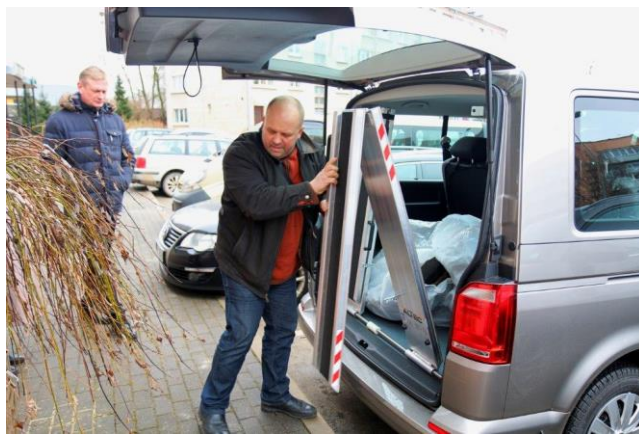
Foto: Projekta «Sociālā partnerība – sociāli neaizsargātu cilvēku integrācija kopienas dzīvē» ietvaros aprīkotā fizioterapijas zāle un iegādātais mikroautobuss.