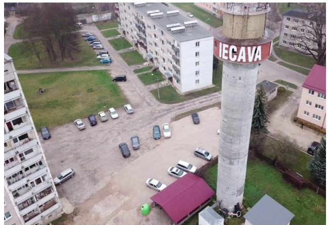
Foto: Ielu apgaismojums Upes ielā un stāvlaukums Iecavas centrā pie daudzdzīvokļu mājām.