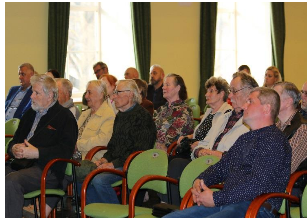
Foto: Publiskās apspriešanas sapulce «Par Iecavas novada pilsētas statusa noteikšanu Iecavas ciemam» 24.aprīlī.

Iecavas novada ilgtspējīgas attīstības stratēģijā ir paredzēta Iecavas ciema iespējamā statusa maiņa uz pilsētu. Iecava pilsētas statusam atbilst pēc visiem Administratīvo teritoriju un apdzīvoto vietu likumā noteiktajiem kritērijiem - Iecava ir novada izglītības, kultūras, tūrisma, sporta un komercdarbības centrs ar attīstītu infrastruktūru un ielu tīklu. 2019. gada 1. janvārī Iecavas novadā dzīvoja 9019 iedzīvotāji, no tiem Iecavas ciemā aptuveni 5700.