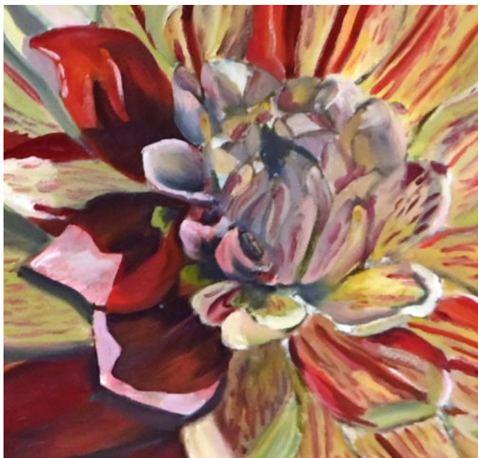
Glezniecības studijas “Umbrā” darbs arī atjaunotnes procesam dabā