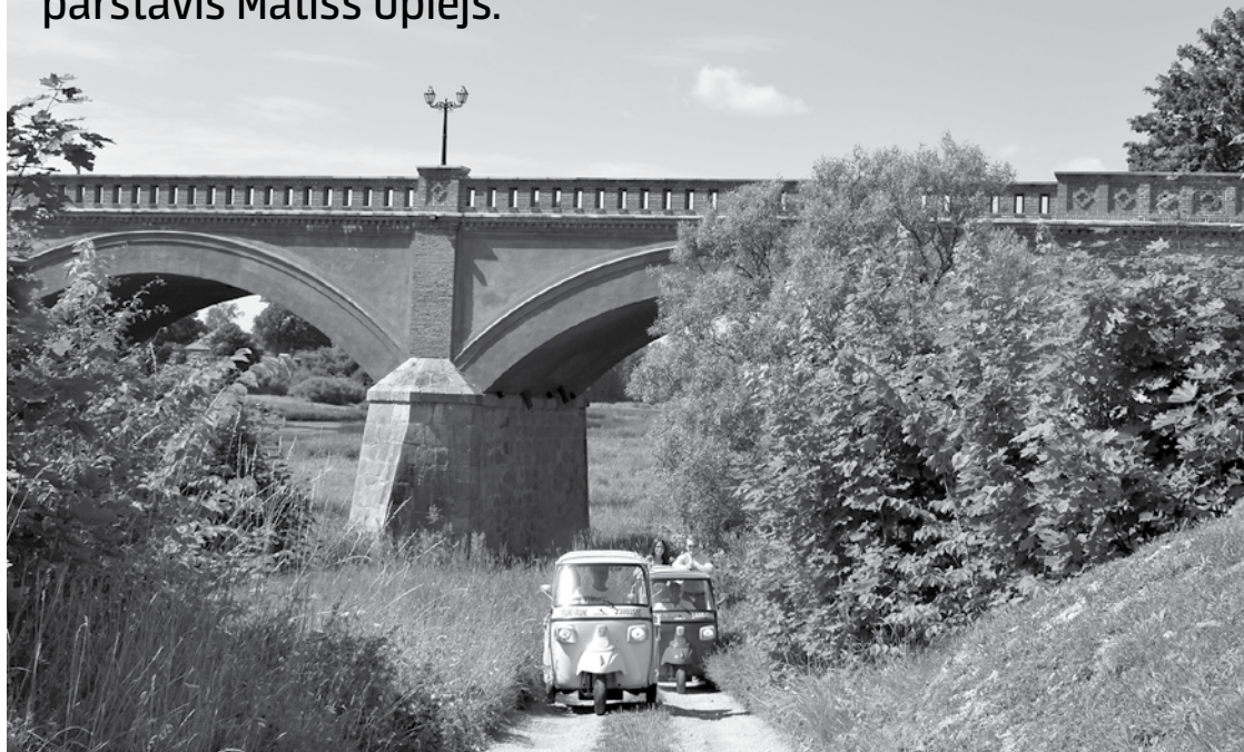
Abi Kuldīgas tuktuki devušies ceļā izvizināt pasažierus pa skaistākajām vietām.