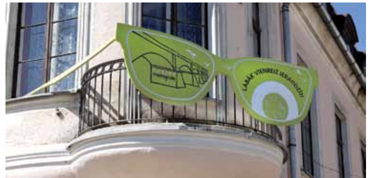
Arī optikas salons Metropole akcijā iesaistījies ar savām reklāmb Brillēm.

2. lpp. Kādas ir ražas prognozes? Kartupeļi aug vareni, kulšanas laiks nav tālu, vējš un slimības dara savu.