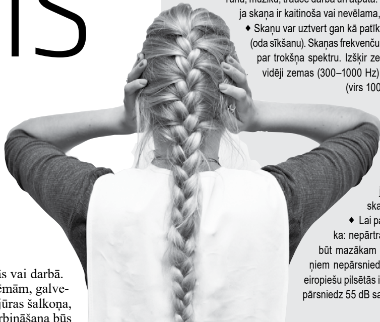
Darbā troksnis, kas lielāks par 80 decibelu, ir riska faktors. Tad jālieto individuālie aizsardzības līdzekļi: austiņas vai ausu aizbāžņi.

♦ Lai pa nakti labi izgulētos, PVO iesaka: nepārtrauktā trokšņa fonam vajadzētu būt mazākam par 30 dB, atsevišķiem trokšņiem nepārsniedzot 45 dB. Gandrīz 70 miljoni eiropiešu pilsētās ir spiesti sadzīvot ar troksni, kas pārsniedz 55 dB satiksmes dēļ vien.