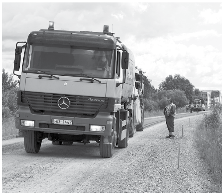
Nepilnus četrus kilometrus tiek remontēts ceļš no Priedaines uz Basiem.

Seguma atjaunošana pabeigta ceļā Tukums–Kuldīga no pagrieziena uz Pļavsargiem līdz Kuldīgai. Vienā posmā labots asfalta profils, visā objektā bijusi vienkārta virsmas apstrāde, kā arī nomainītas caurtekas, izfīrīti grāvji, piebērtas nomaļas un atjaunots ceļa horizontālais apzīmējums. Būvdarbi sākti maijā un pabeigti jūlija sākumā. Šobrīd visi