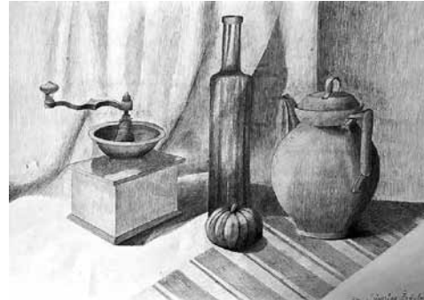
Sindijai vislabāk patīk zīmēt kluso dabu.