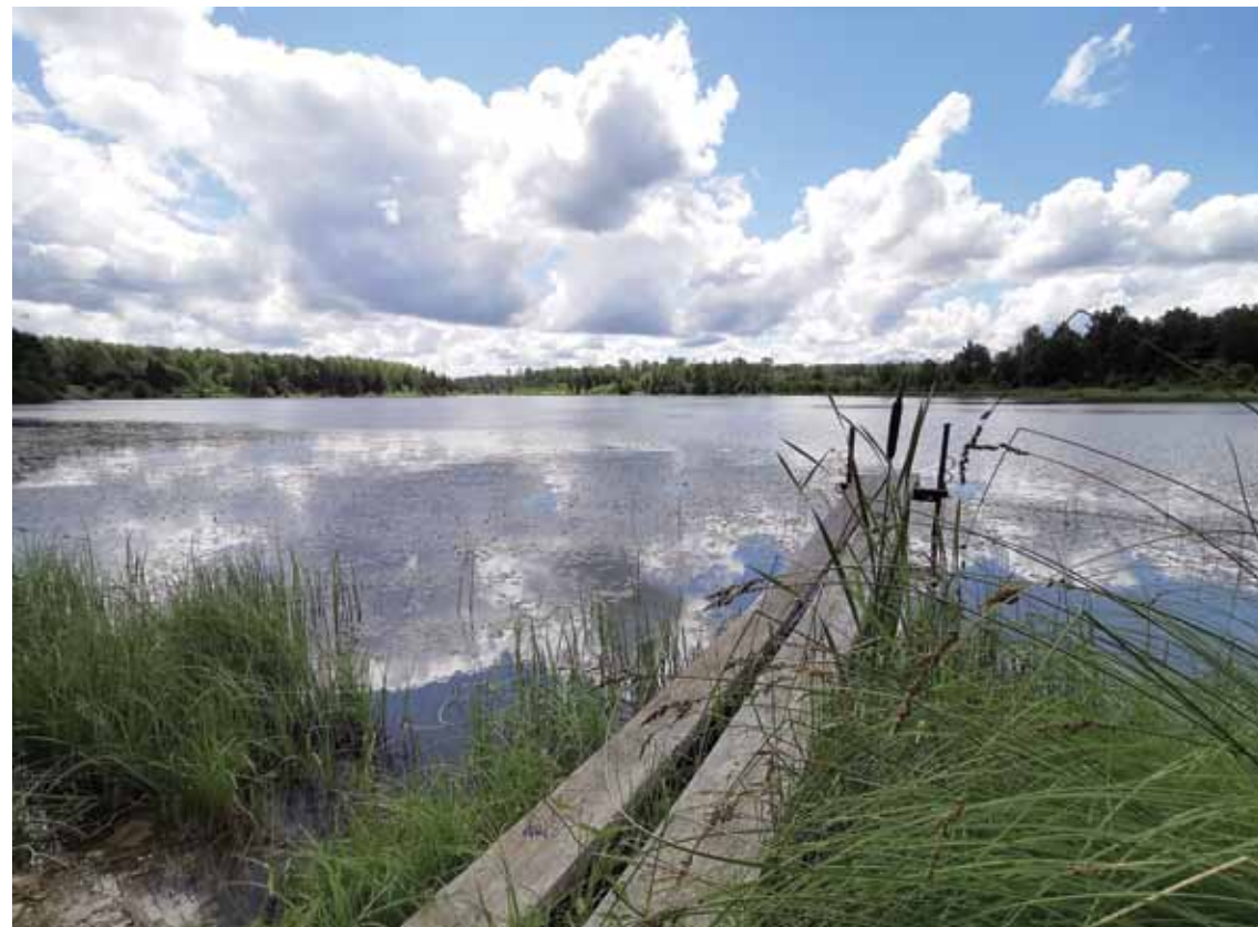
Krievkalnu dīķis Nīkracē atrodas nomaļā, skaistā vietā un ierīkots padomju laikos.

Nu jau aptuveni 45 gadus Skrundas novada Nīkrāces pagastā Krievkalnu dīķi saimnieko mednieku un makšķernieku klubs Skrunda , kas rūpējas, lai tas regulāri tiktu papildināts ar jauniem zivju resursiem un tiktu saglabāti tur esošie.