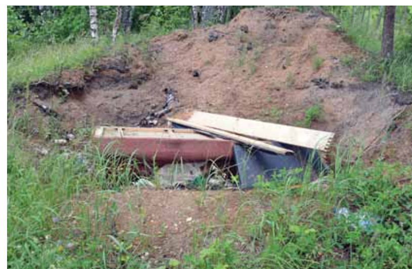
Lai arī makšķernieku un mednieku kolektīvs Skrunda katru gadu rīko talkas, pie dīķa nereti kāds izmet atkritumus. Divāns tur uzradies pāris nedēļu pēc vietas sakopšanas.