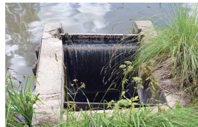
Visdārgākais ūdenstilpnes uzturēšanā ir meniķis. Tas regulāri jāapskata, lai uzturētu vajadzīgo ūdens daudzumu.