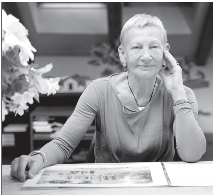
Saullēkta verandas projekts ir Zaigas Gailes arhitektu biroja dāvinājums Popes muižai.