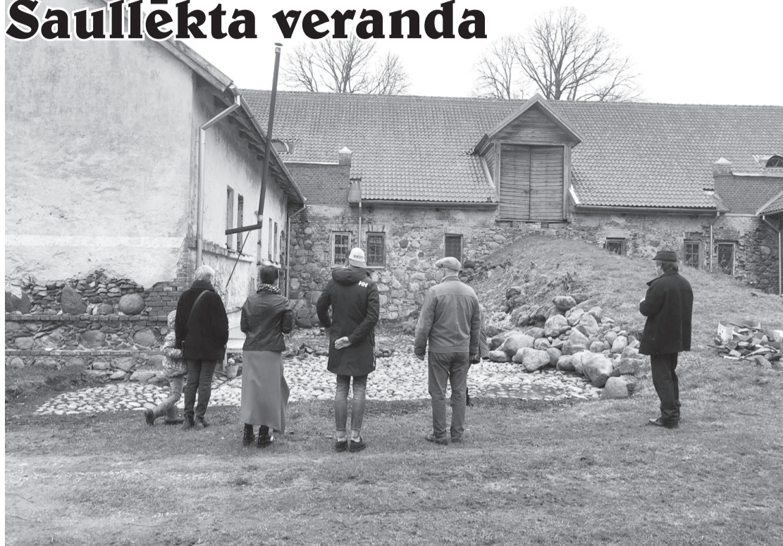
Viesi un mājinieki apskata atsegtu bruģi.