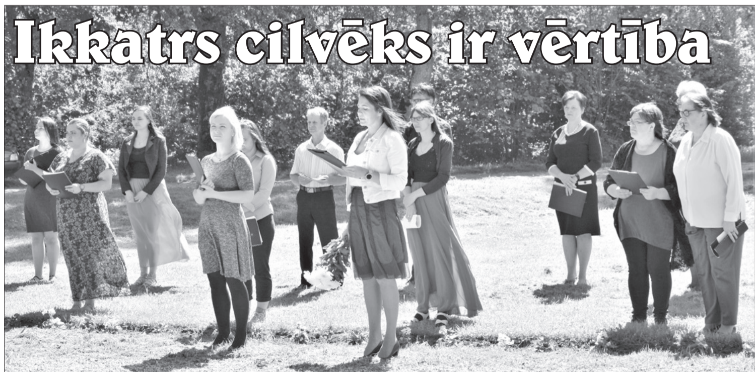
Uģālnieki godina svešās varas tūlumā aizvestos pagasta iedzīvotājus.

Parasti uģālnieki šos skarbos vēstures faktus piemin 25. martā, bet šogad šai laikā cilvēki, iespējams, piedzīvoja savā veidā līdzīgas sajūtas toreizējām izvešanas sajūtām – neziņu, noteikumus, masu mediju spiedienu, bailes un rūpes par sevi un tuvāko – un nepulcējās pie akmens, kā ierasts. Toties 14. jūnijā uģālniekiem atkal bija iespēja satikties, pieminēt un dalīties atmiņās. Lai arī cik tas vairumam cilvēku šķistu tāls, nesaprotams un nevajadzīgs pieminēšanas vērts brīdis, tomēr tiem, kuri bija deportācijas upuri, kuriem sirdi plosīja bailes, neizpratne un pilnīgas iznīcības sajūta, tiem un viņu tuviniekiem šie datumi ir spilgti iespiedušies atmiņā. Šo cilvēku ar dzīvajām atmiņām, kuras viņi nes ik dienu, nepielūdzami kļūst arvien mazāk; un nepaies ne ilgs