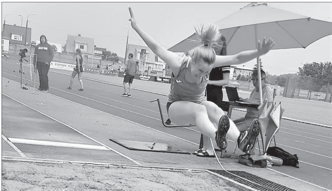
Skaists lēciens un vienlaikus labs treniņš.

30. jūnijā Piltenes stadionā aizvadītas Kuldīgas novada NSS un Ventspils novada BJSS sadraudzības sacensības vieglatlētikā jaunākajām grupām, kur spēkiem mērojās 2011./2012. g. dz., 2009./2010. g. dz. un 2007./2008. g. dz. zēni un meitenes no Kuldīgas, Ventspils novada un Ventspils.