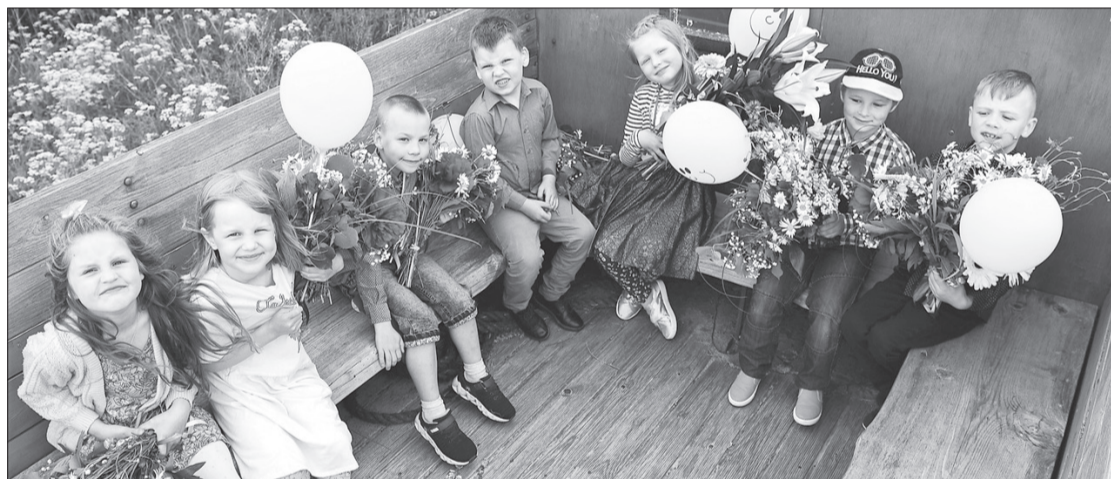
Priecīgie "vālodzēni" ir gatavi skolas gaitu uzsākšanai.

un visu klātesošo izveidoto aleju ar vadītāju Unu priekšgalā, turot raibo ziedu klēpijus savās rociņās, laimīgi, apmierināti un priecīgi jaunie skolēni dodas uz jaunās dzīves vēl nezināmajām tālēm. Un viņi dodas droši, nebaudoties, jo apkārt taču ir tik daudzi, kas viņus mīl, kam viņi rūp un ir svarīgi.