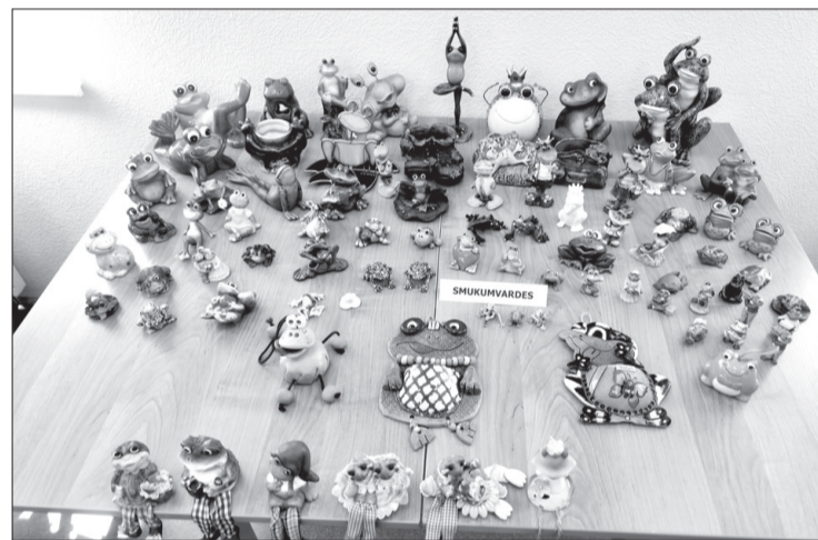
Kolekcijā ir ap 415 varžu – te daļa no tām.

Par šo aizraušanos zina daudzi zīrenieki, pateicoties kuriem arī kolekcija ik dienas nedaudz