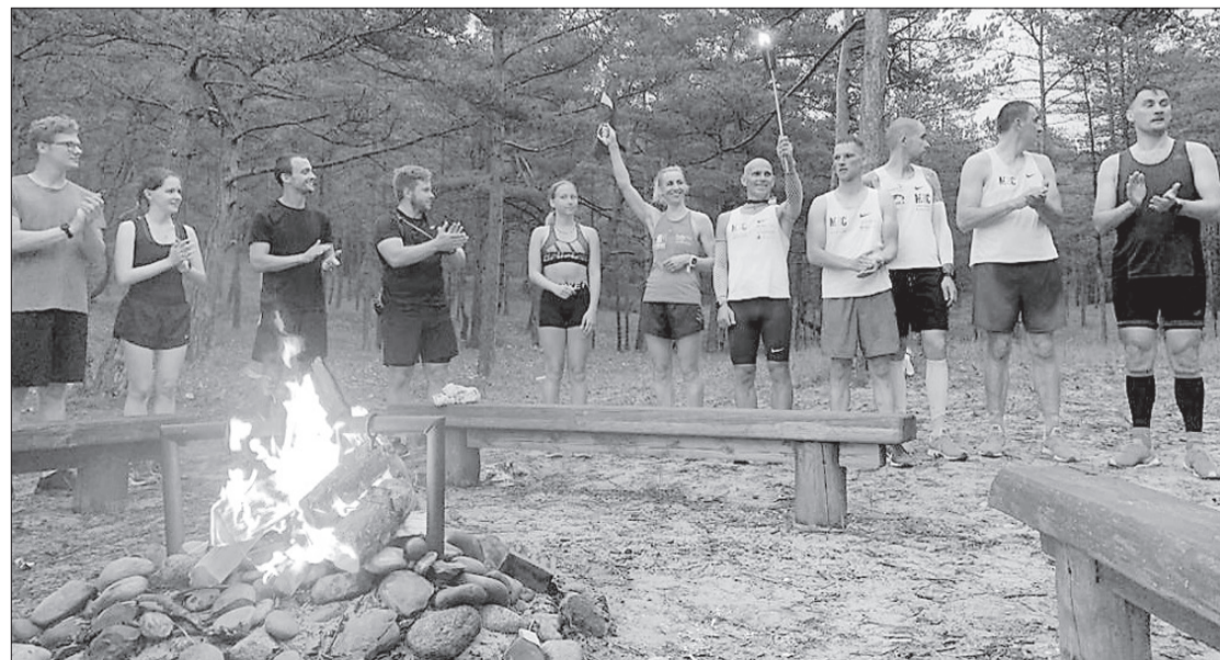
"Gaismas ceļā" dalībnieki agrā rītā piestājuši Užavā.