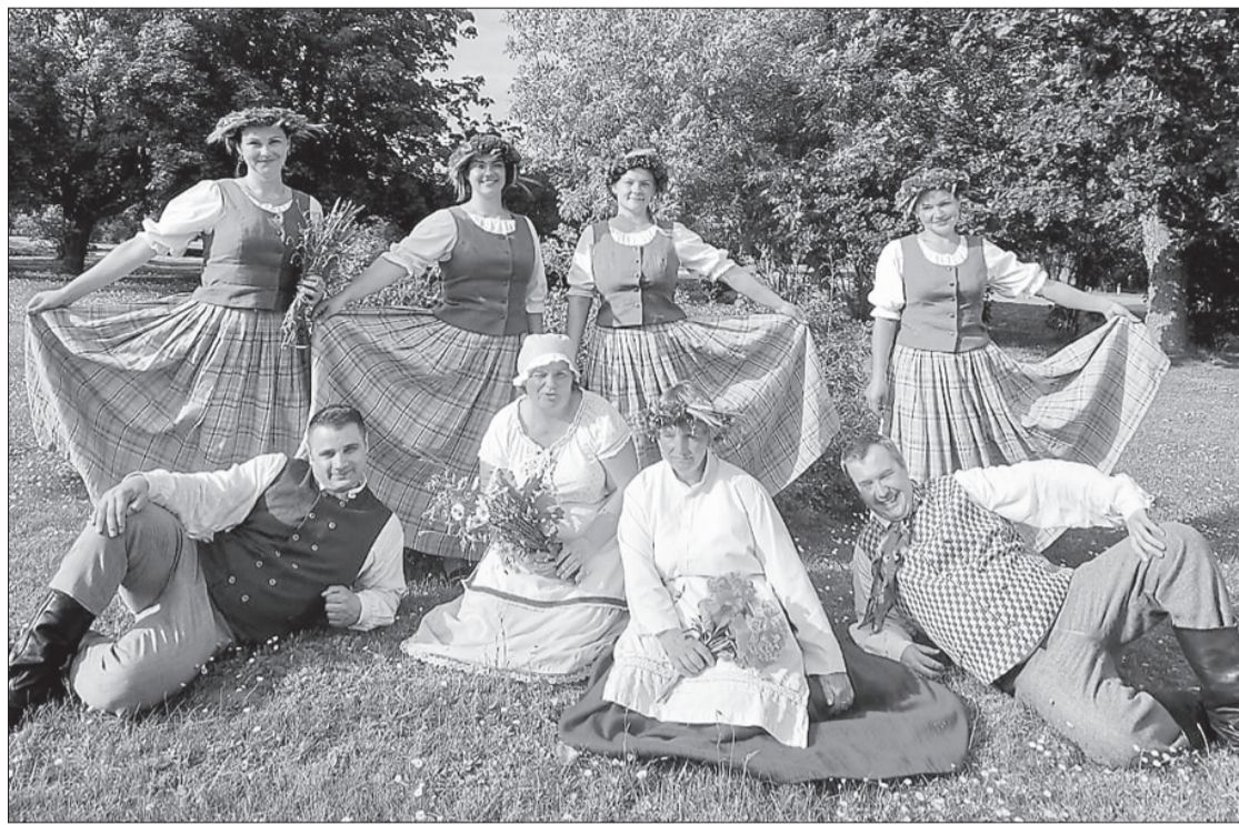
Svētkos uzstājās arī Zirū ansambļa jaunieši.