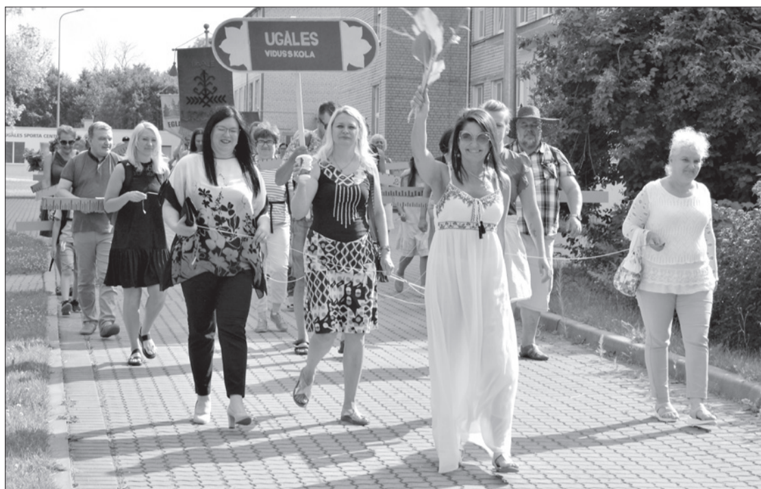
Līksmie ugālnieki dodas svētku gājienā.