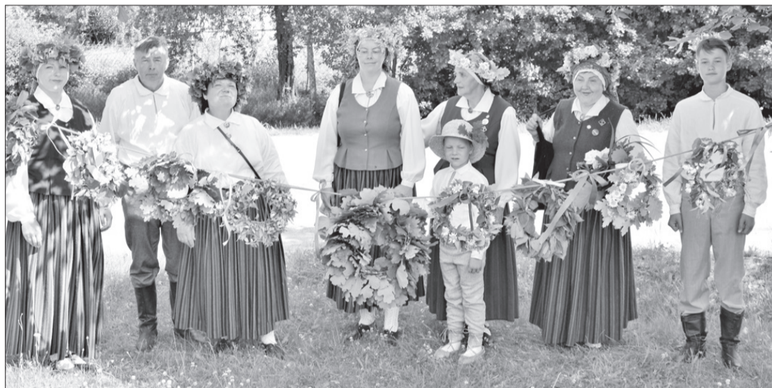
Svētkos pagasta iedzīvotāji rotāja liepu aleju.