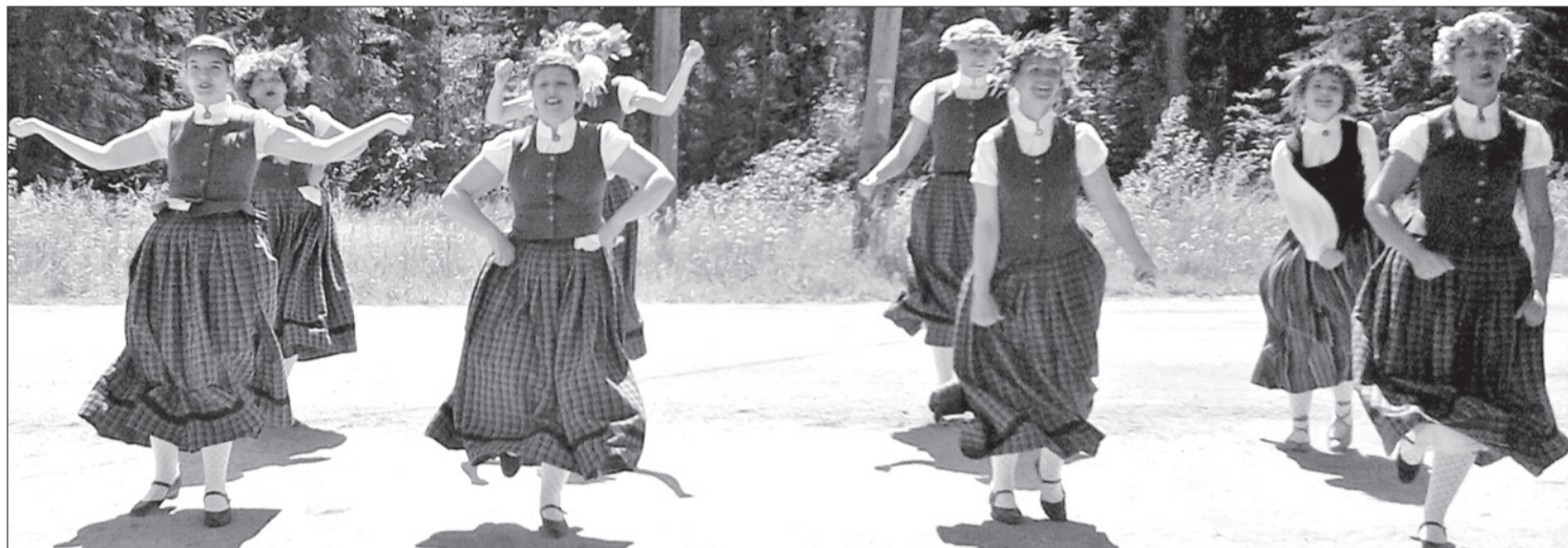
Deju kolektīva "Ance" pārstāves saulgriežu dienā, uzstājoties ciemos.