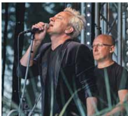
Svētku izskaņā grupas Otra puse koncerts.