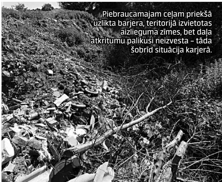
Piebraucamajam ceļam priekšā uzlikta barjera, teritorijā izvietotas aizlieguma zīmes, bet daļa atkritumu palikusi neizvesta – tāda šobrīd situācija karjerā.