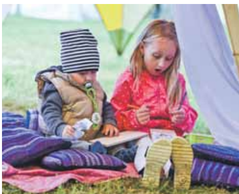
Skrundas svētkos klāt arī paši mazākie skatītāji.