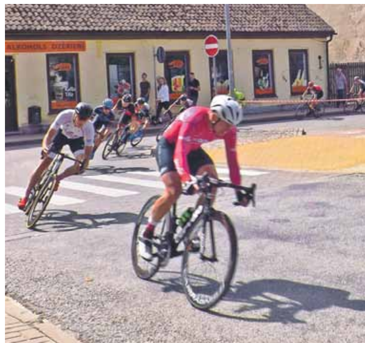
Svētdien riteņbraucēji Kuldīgā sacentās kritērija braucienos.