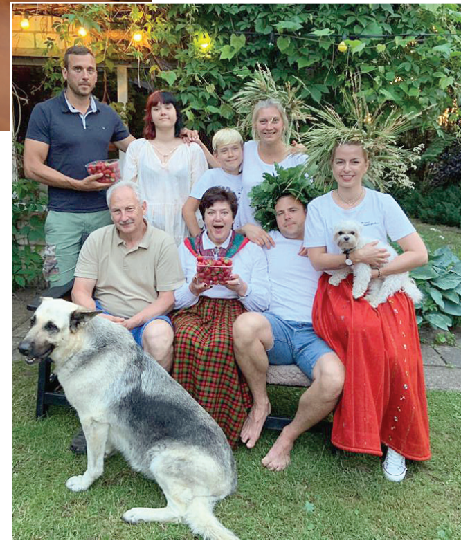
Šī gada Jāņos ar vīru, dēliem, vedeklām, mazbērniem un suni.