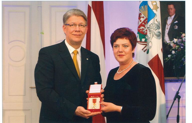
No Valsts prezidenta Valda Zatlera rokām saņemts apbalvojums – Atzinības krusts.