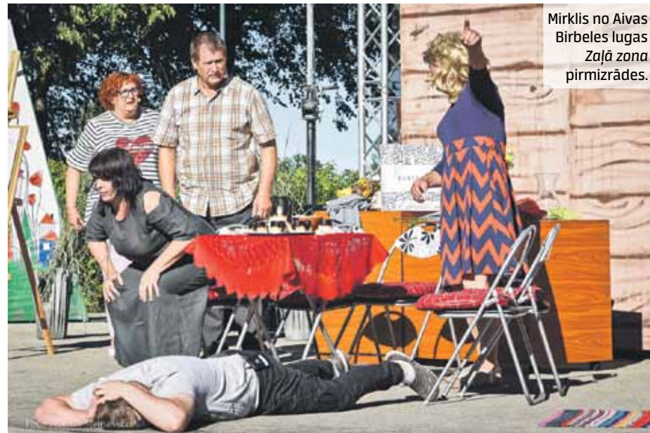
Mirklis no Aivas Birbeles lugas Zaļā zona pirmizrādes.

Aizvadītajā sestdienā Skrundā tika aizvadīti mazie svētki, ko pilsēta rīkoja kā alternatīvu pasākumu Skrundas Pilsētas svētkiem. Kā atzīst organizatori, tie aizvadīti godam.