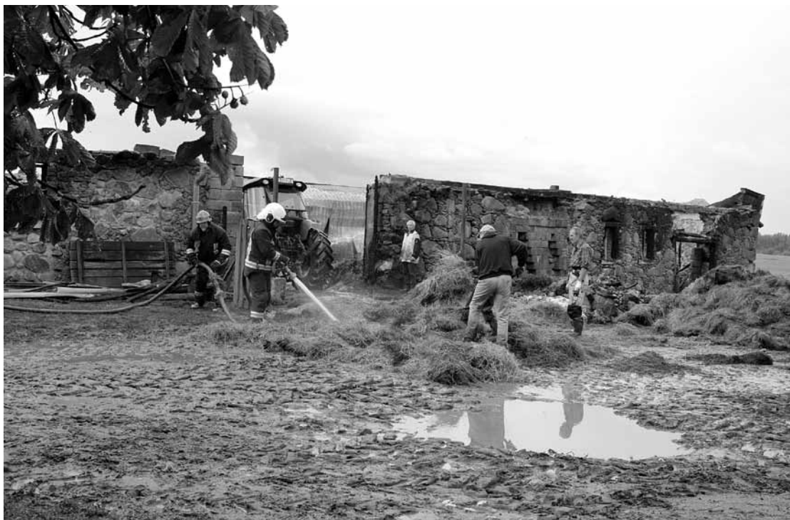
Vēl sestdienas rītā pilnā sparā norisinājās ugunsgrēka seku likvidēšana, tajā piedalījās gan VUGD darbinieki, gan patversmes pārvaldnieks un iemītnieki.