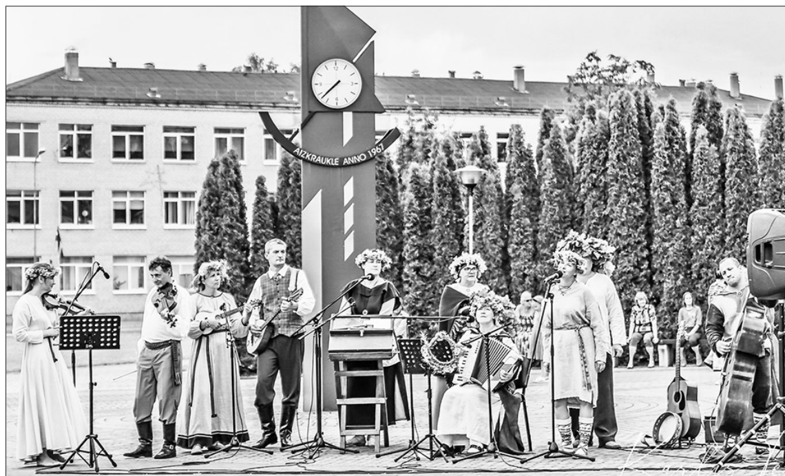
Folkloras kopa "Karikste", izdziedot tradicionālās Līgo dziesmas, pasākuma dalībniekiem sagādāja svētku noskaņu.

Aizkraukles novada pašvaldība šogad aicināja iedzīvotājus ielīgot Jāņus, kopīgi veidojot ziedu ugunsroku pilsētas centrālajā laukumā.