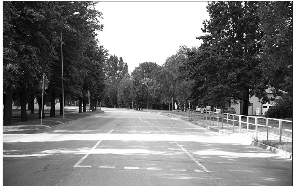
Aizkrauklē turpina uzlabot iedzīvotājiem un uzņēmējiem nozīmīgu ielu kārtību – ar Eiropas Savienības fondu piesaisti rasta iespēja veikt Gaismas ielas atlikušās daļas rekonstrukciju un Mednieku ielas atjaunošanu.