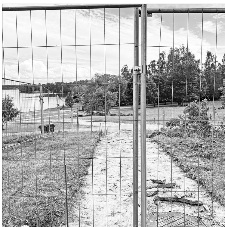
Kāpņu pārbūvi plānots pabeigt līdz ātrumaļāvu sacensībām un novada svētkiem, kas norisināsies otrās augusta nedēļas izskaņā.

Vizuāli pievilcīgāka krastmalas izskatīsies arī pēc kultūras nama kāpņu atjaunošanas, kas ved no kultūras nama ēkas uz Daugavas pusi. Kāpnes bija sliktā stāvoklī ar izdrupušiem pakāpieniem, tie apdraudēja gājēju drošību. Kultūras namā izvietota Dzimtsarakstu nodaļa, kurā notiek kāzu ceremonijas. Jaunlaulātie ar viesiem nereti izmanto šīs kāpnes kopīgām fotogrāfijām, tāpēc to atjaunošana ir vitāli svarīga. Turklāt augusta sākumā pie kultūras nama noritēs augsta līmeņa sacensības ūdensmotosportā – Eiropas čempionāta posms ātrumaļāvām.