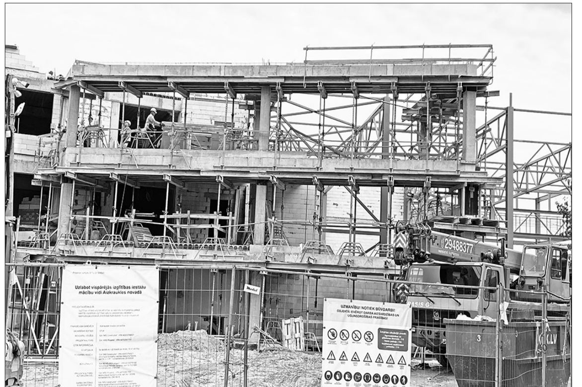
Skolas piebūves gaita rit atbilstoši plānotajam darbu grafikum; tās nodošana ekspluatācijā paredzēta šoruden.

Detalizētāka informācija par to izklāstīta blakus rakstā.