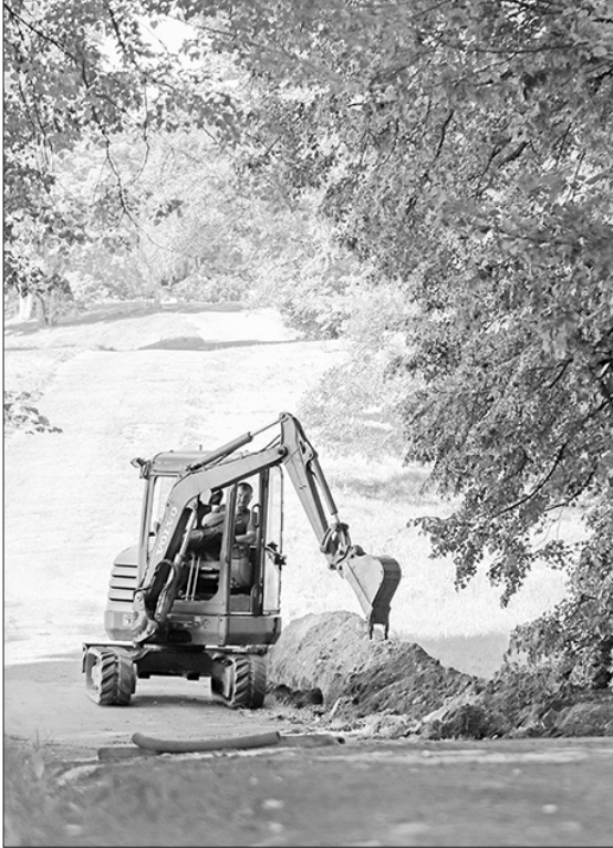
Pēc seguma rekonstrukcijas un apgaismojuma ierīkošanas ceļš būs izmantojams gan nesteidzīgām vakara pastaigām, gan aktīvai atpūtai.