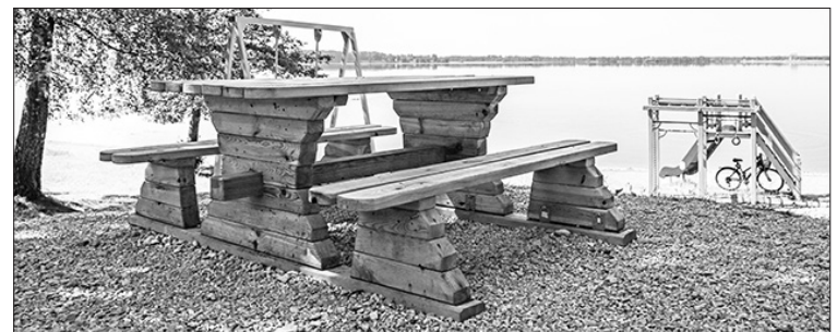
Diemžēl viens no uzstādītajiem sola un galda komplektiem jau ir nozagts. Pašvaldība vērsusies policijā un lūdz atsaukties aculieciniekus.