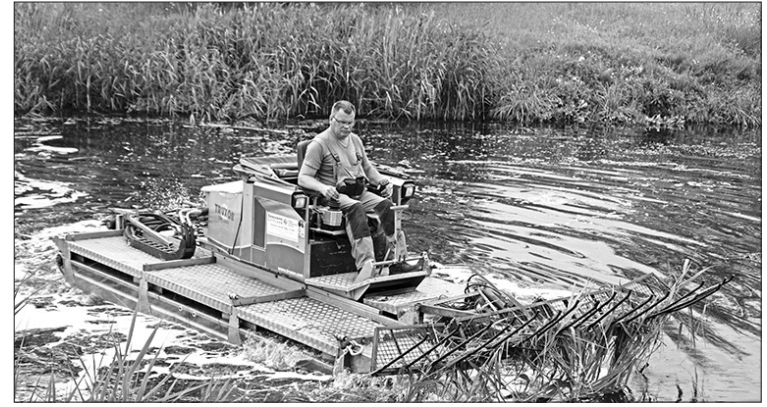
Ūdenszāļu izplaušana ir dīķa sakopšanas pirmais posms, tam seko dīķa gultnes tīrīšana.