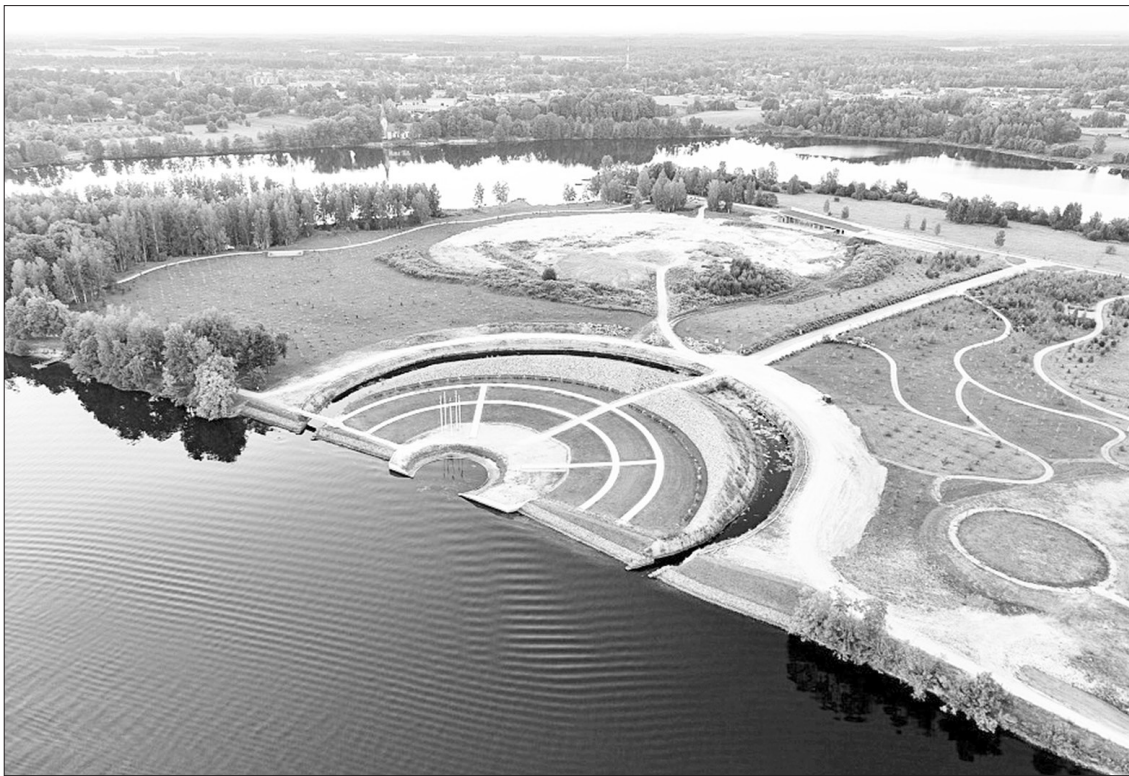
Likteņdāru Kokneses pagastā ik gadu apmeklē liels skaits vietējo un ārvalstu tūristu, tāpēc ceļa sakārtošana nokļūšanai šajā piemiņas vietā ir nozīmīga.

Tas ir ceļa posms, kas ved no A6 šosejas uz Likteņdāru, un tā pārbūve ir iekļauta Kokneses novada attīstības programmas 2020. – 2026. gadam rīcības un investīciju plānā. Projektam ir sagatavots tehniskais projekts.