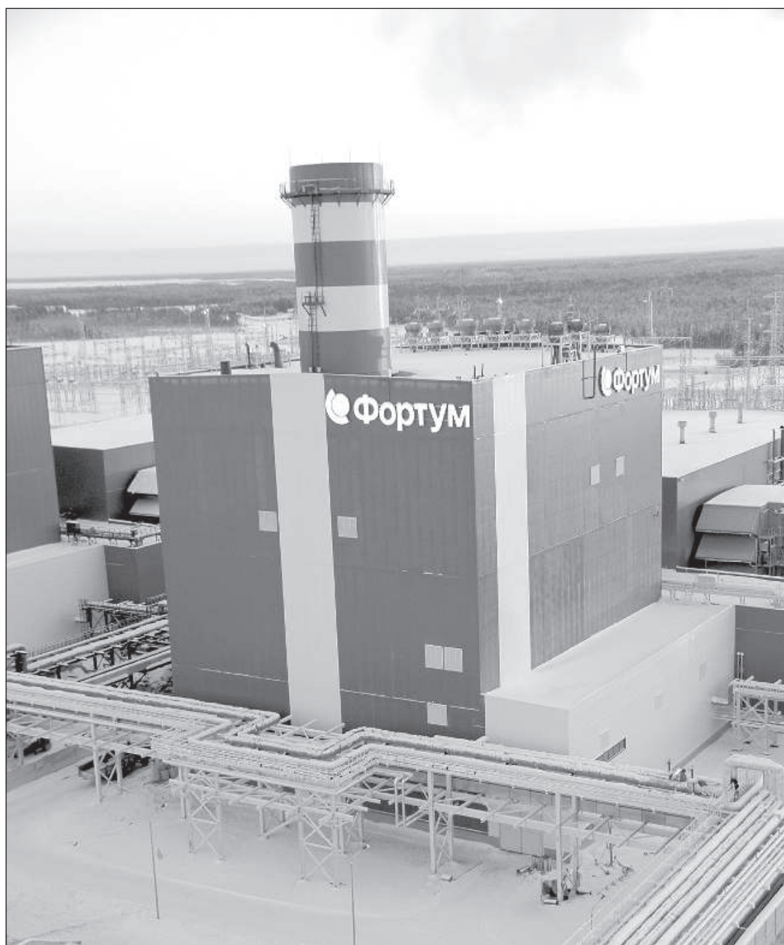
Когенерационная станция «Fortum» в Нягани, Россия.

другой факт, а именно: что выгодно для потребителя.