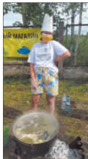
Готовится уха от магазина «Shark».