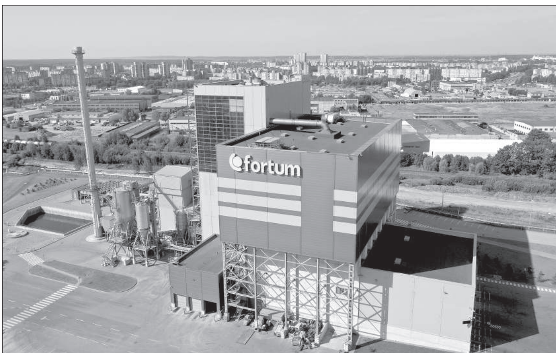
Когенерационная станция «Fortum» в Клайпедде, где в качестве топлива используют бытовые отходы.

– Сейчас мы ведем переговоры с «Daugavpils siltumtīkli» о сотрудничестве в следующий отопительный сезон. Я еще раз подчеркну: мы никак не связаны с политическими процессами, проходящими в Даугавпилсе. В 2019 году мы участвовали в конкурсе закупок на поставку теплоэнергии «Daugavpils siltumtīkli», и мы тогда выиграли как наилучший претендент. К сожалению, результаты конкурса не были утверждены, его прекратили. Сотрудничество двух предприятий должно быть основано на экономически выгодных условиях, тогда и можно заключать договор. По производству тепла «Fortum Daugavpils» является конкурентом «Daugavpils siltumtīkli», но не нужно смешивать эти вещи. Да, мы конкуренты, но не нужно оценивать