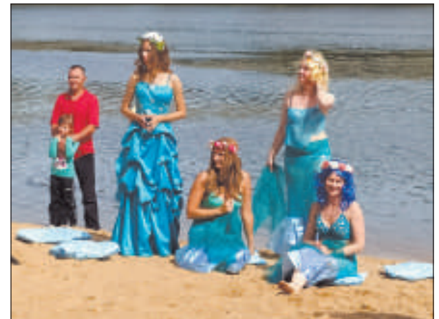
Русалки внимательно слушают своего повелителя.