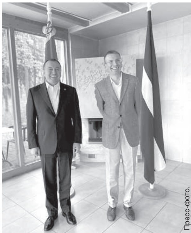
Главы МИД Латвии и Беларуси во время встречи в Силене.

24 июля министр иностранных дел Эдгар Ринкевич встретился с министром иностранных дел Республики Беларусь Владимиром Макеем, который приехал в Латвию с однодневным рабочим визитом. Встреча прошла в Силене Скрудалиенской волости Даугавпилсского края, где министры обсудили актуальные вопросы отношений Евросоюза и Белоруссии, и двустороннее сотрудничество Латвии и Белоруссии.