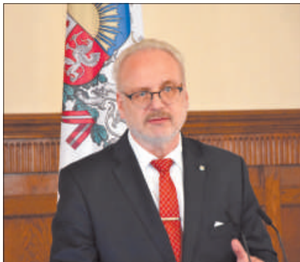
Президент Эгилс Левитс.

Президент Эгилс Левитс собрал вместе исследователей, историков, общественных деятелей и представителей масс-медиа, чтобы обсудить инициативу президента о разработке законопроекта о латышских исторических землях, который уже осенью планируется представить на рассмотрение в Сейм. В работе семинара вместе с коллегами из других региональных СМИ участвовали и представители «Латгалес Лайкс».