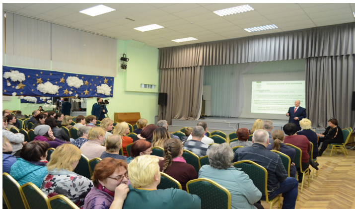
VARAM informatīvā sapulce Vārkavas vidusskolā.