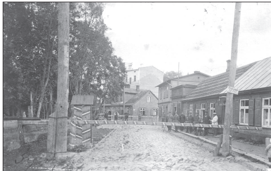
Latvijas–Igaunijas robežas pārejas punkts Valkā Semināra–Sepa ielā. Valka, 1922.gads

– Saskaņā ar B priekšlikumu – gandrīz visu Valku, izņemot Lugažu lau-