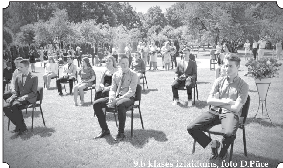
9.b klases izlaidums, foto D.Pūce