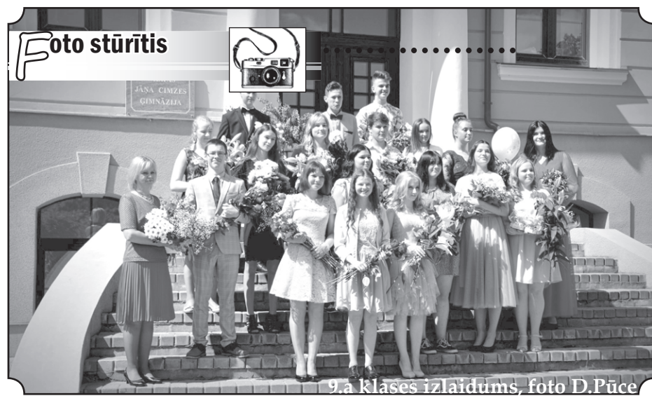
9.a klases izlaidums

Biļešu cenas sākot no 9 EUR. Vairāk informācija: www.kidswonderland.lv Daudzbērnu ģimenēm īpaša biļešu cena. Biļetes: internetā www.ticketpoint.lv un pasākuma dienā uz vietas. ☿