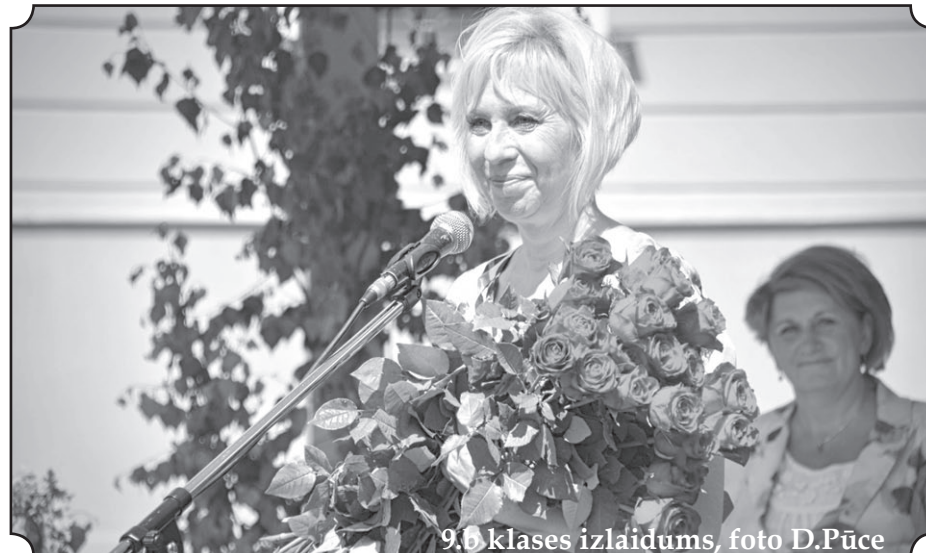
9.b klases izlaidums