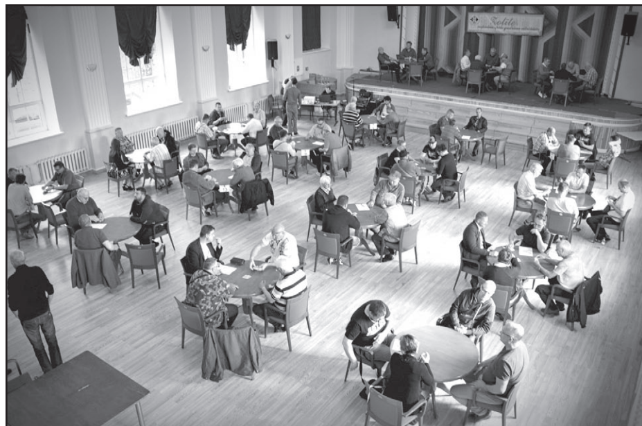
Tradicionālais Dižsvētku zolītes turnīrs Valkas pilsētas kultūras namā

Ar rezultātiem var iepazīties Valkas novada pašvaldības mājas lapā, sadaļā Sports-nolikumi- rezultāti. ☹