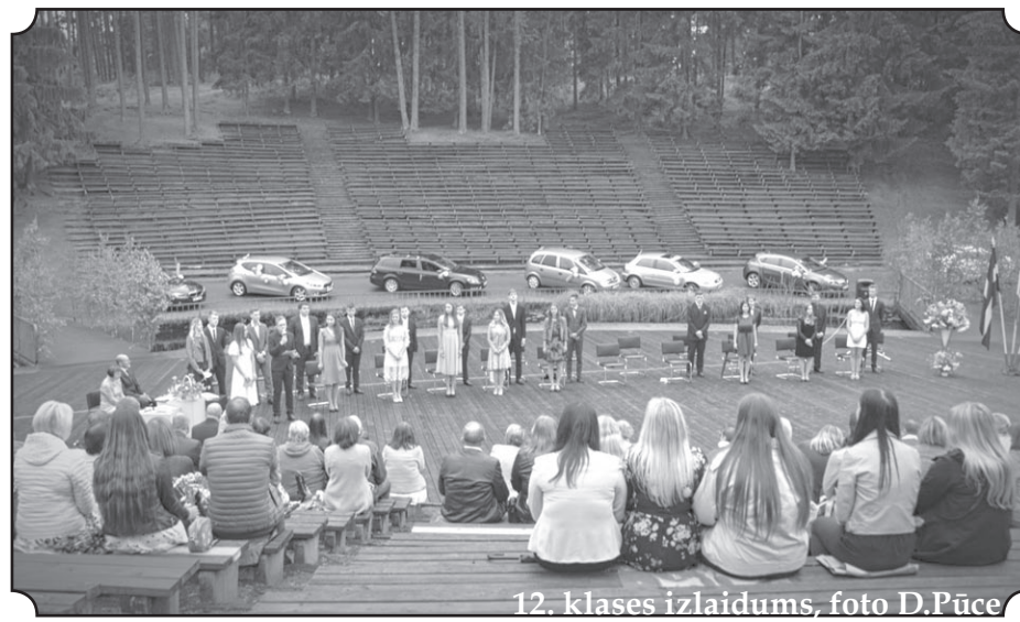
12. klases izlaidums