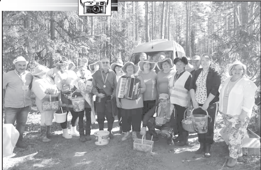
Pirmais melleņu un gaiļuņu lasīšanas čempionāts.