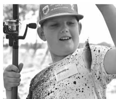
Prieks jaunajiem makšķerniekiem bija par katru izvilkto zivi, lai cik arī maza tā nebūtu.