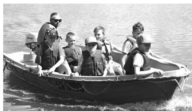
Skoliņas dalībniekus profesionāla glābēja vadībā ne tikai izvizināja pa ezeru, bet arī iepazīstināja ar noteikumiem, kas jāievēro uz ūdens.

nieks saņēma apliecinību par beigšanu un vobleri no labvēļiem «Finnex Group».