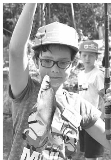
Marekam pirmajā dienā neveicās, taču otrajā sīta viņa zvaigžņu stunda – pieķērās paliels breksis, kas izraisīja vispārēju interesi.