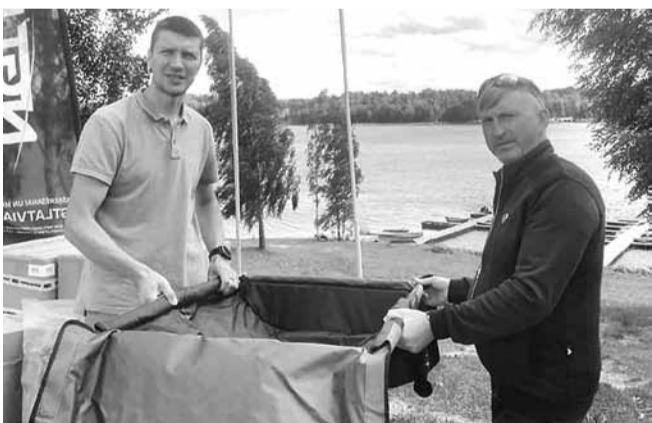
Šādas karpu gultas noderēs makšķerniekiem, kas karpas neuztver kā pārtikas produktu un noķertās zivis atlaiž. Baļotes ezerā tādu copmaņu kļūst arvien vairāk.

Baļotes ezers saņēmis dāvinājumu no karpu makšķerēšanas komandas «Fisher team» – desmit karpu gultas, kas domātas noķertās un atlaist paredzētās zivis saudzīgai novietošanai un atbrīvošanai no āķa.