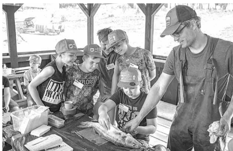
Īstam makšķerniekam vienmēr interesē, ko zivs ir ēdusi. Zinot to, var veiksmīgāk piemeklēt attiecīgu barību, ēsmu vai mēnekli.