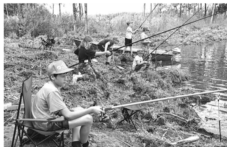
Jaunajiem makšķerniekiem pārsvarā ķērās sīkzivis, tomēr pirmajā dienā viens laimīgais pamanījās noķert arī puskilogramīgu karpiņu.