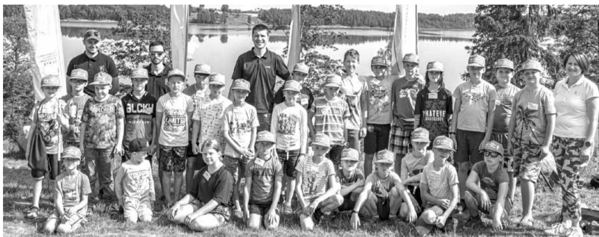
Trīs dienas jauno makšķernieku skolā paskrēja ātri un interesanti. Organizatori bija padomājuši gan par oriģinālām cepurītēm, gan par tārpiem, āķiem un citu inventāru, gan par gardām pusdienām un launagu.