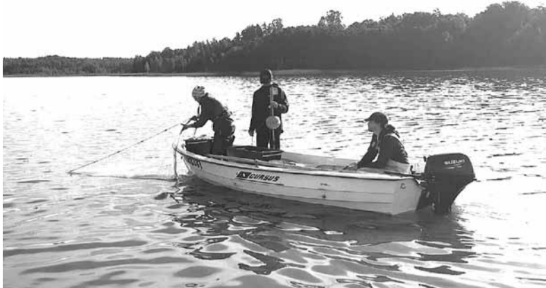
Maluzvejnieku tīkli Baļotes ezerā ir pilnībā izskausti. Reizi piecos gados tos pētnieciskos mērķos ieliek zinātnieki.

Pagājušajā nedēļā Baļotes ezerā rosījās SIA «Saldūdeņu risinājumi» pētnieki. Viņi Zivju fonda finansētā un Krustpils novada līdzfinansētā projekta ietvaros veica izpēti, lai, pamatojoties uz iegūtajiem datiem, novērtētu ezera zivju sabiedrības stāvokli, sniegtu rekomendācijas ezera tālākai apsaimniekošanai.