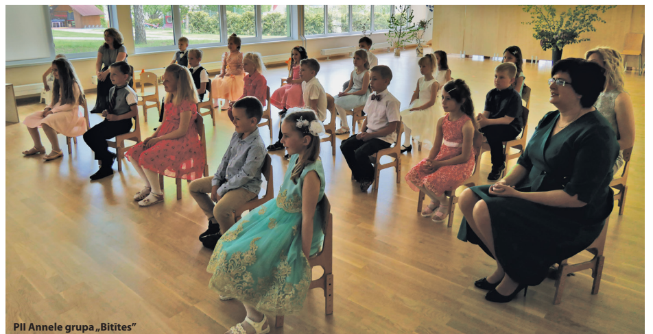
PII Annele grupa „Bitītes”