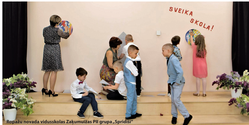
Ropažu novada vidusskolas Zaķumuižas PII grupa „Sprīdiši”

Ropažu novada pašvaldība novēl: lai jums veiksmīgs ikviens nākamais starta un jaunā sākums!