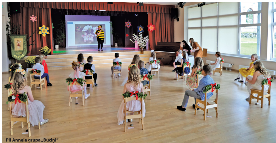
PII Annele grupa „Buciņi”