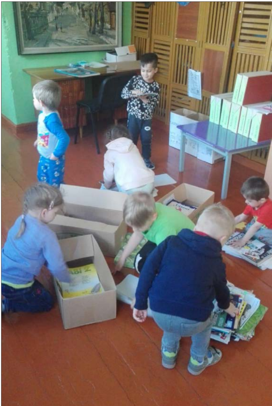
Krišjāņu pirmsskolas grupas bērni bija ļoti liels atbalsts Bērzpils vidusskolas panākumiem "Zaļās jostas" rīkotajā Vislatvijas makulatūras vākšanas konkursā "Tīrai Latvijai", kur Bērzpils vidusskolas skolēni izcīnīja 2. vietu valsts mērogā pēc savāktā makulatūras apjoma uz vienu iestādes audzēkni, savācot vidēji katrs pa 220 kg makulatūras un būdami čaklākie makulatūras vācēji Latgalē.

Tuvojas noslēgumam 2019./20. mācību gads, kurš šogad ir vēsturisks, jo kopš marta vidus dzīvojam citādi-pielāgojamies krīzes apstākļiem, netiekamies pasākumos, baudām tos virtuāli, sportojam individuāli, bet izglītībā- mācāmies attālināti. Jau esam sapratuši, ka tas nav viegli, brīžiem pat ļoti grūti. Bet prieks, ka varam iet ārā, smelties skaisto un neatkarotājamo pavasarī. Vīruss jau nevar aizliegt mums priecāties!