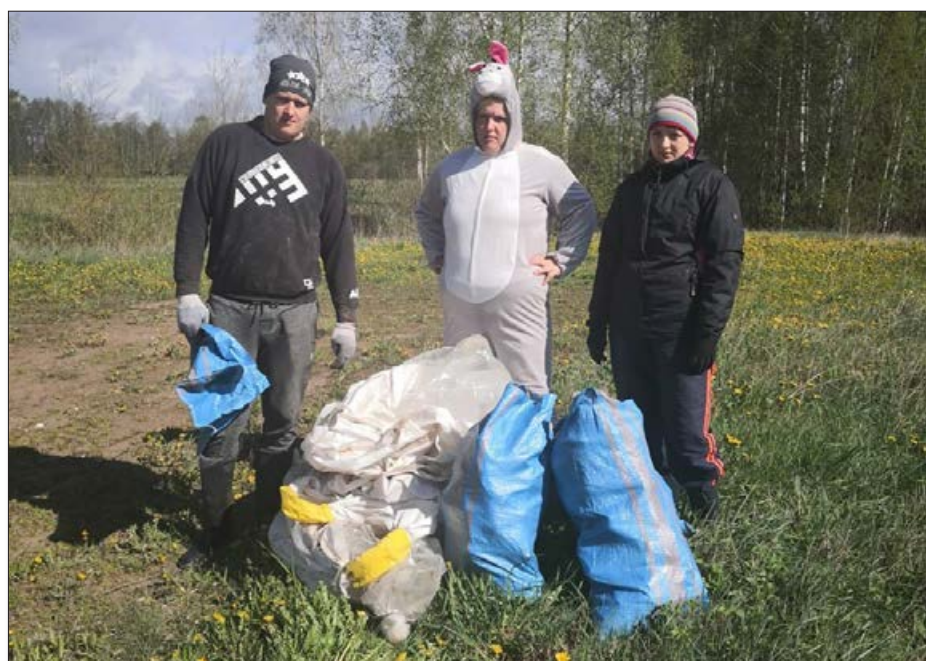
Bērzpils pagasta Beļauskos talkoja Rakstiņu ģimene, salasot atkritumus gar ceļa malām. To esot bijis daudz!

Arī šogad Lielās Talkas moto bija "Mēs piederam nākotnei - Latvija pieder nākotnei!", un šogad šim sauklim bija arī papildus vēstījums: "Sakop savu sētu, Tava sēta - Latvija". Tā mērķis ir veicināt izpratni, ka mums jā rūpējas par savu sētu un pagalmu, kas veido valsti kopumā, jo visa Latvija ir mūsu kopīgā dzīves telpa.