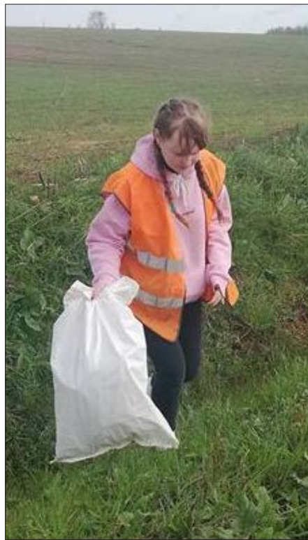
Vecilžas pagastā priecājas talkotāju pulkā redzēt bērnus, kuri ne tikai palīdz savākt atkritumus, bet kuri arī ciena apkārtējo vidi un nepiedražo.

Bērzpils pagastā pagasta darbinieki talkoja pie Bēržu baznīcas, sakopjot kļavu aleju, ravējot puķu dobes, kā arī Aktīvās atpūtas ainaviski tematisko parku papildinot ar jauniem košumkrūmiņiem, bet 11 jauni bērziņi tika iestādīti atpūtas vietā pie līcas. Bērzpils pagasta pārvaldes vadītāja