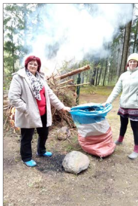
Krišjāņu pagastā tika sakopta atpūtas vieta - Krišjāņu Staburags.