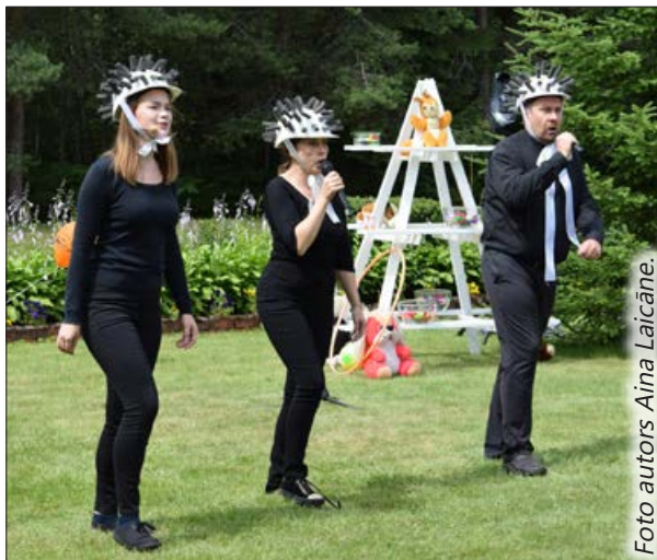
Gaviļņiekus un radiņus iepriecināja biedrības "Balvu teātris" mākslinieku veidotie priekšnesumi.

Diena, lai arī nedaudz vējaina, bija saulaina,