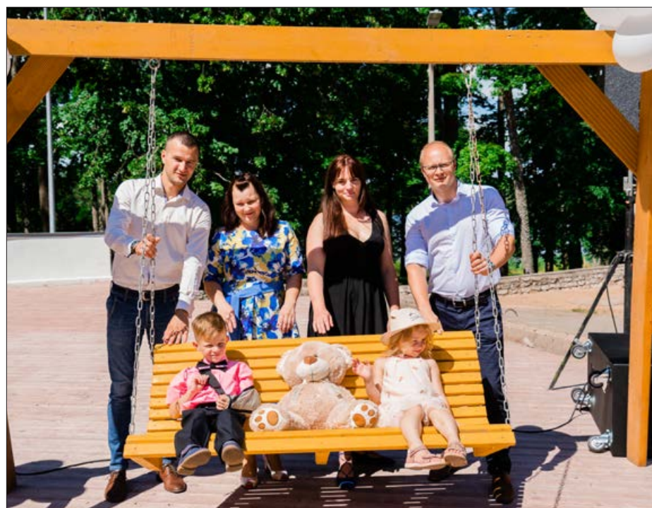
Bērniības svētku šūpolēs tika izšūpoti 36 bērni.