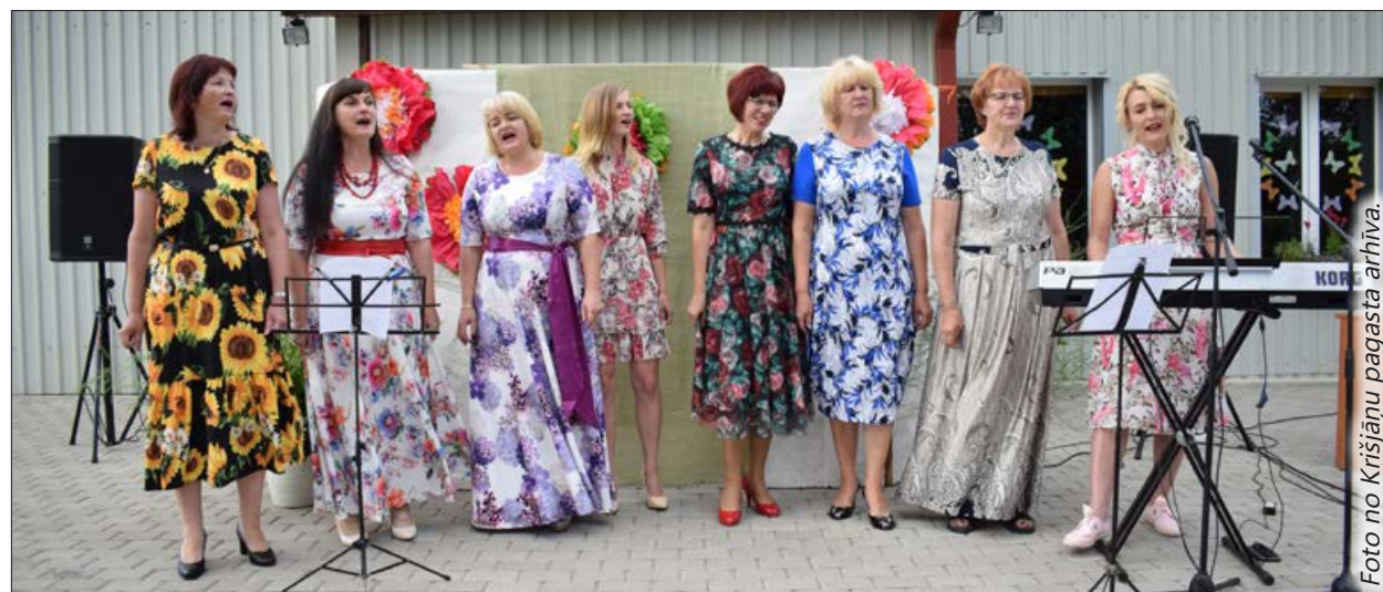
Uzstājas Krišjāņu pagasta sieviešu vokālais ansamblis „Elija”.

Krišjāņu pagasta kultūras darba organizatore