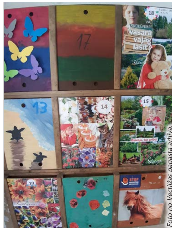
Vectilzās pagastā tapušās krāšņās pastkastītes.

Festivāla “BILDES” mākslinieku žūrija izvērtēs iesūtītos darbus. Interesantāko iesūtīto darbu autori uz vēstulē norādīto pastkastītes atrašanās vietas adresi saņems “BILŽU BIROJA” pateicības rakstus –