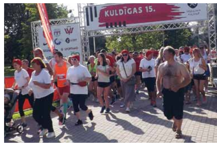
Liela interese bija arī par labdarības skrējieni, kurā savākti ziedojumi Kuldīgas slimnīcas bērnu nodaļai, lai iegādātos skaņu iekārtas un mazie varētu klausīties pasakas.