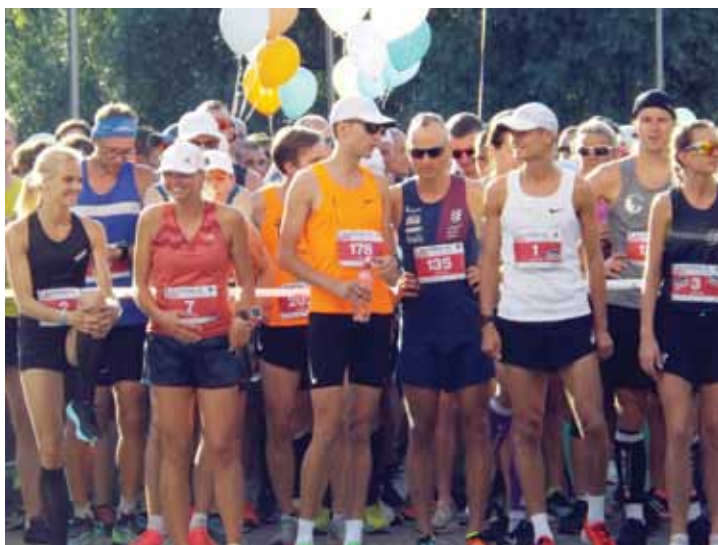
15. Kuldīgas pusmaratonam sportisti gatavi.

Pusmaratona laikā notika arī labdarības pasākums Svētku skrējieni pēc pasakām , kura mērķis – Kuldīgas slimnīcas bērnu nodaļas palātām iegādāties skaņu sistēmu, lai turpmāk katru vakaru mazajiem pacientiem atskaņotu pasakas. Divu kilometru garajā skrējienā-gājienā iesaistījās ap 270 dalībnieku, saziēdoti 926,08 eiro. Sadarbībā ar fondu Vieglī sabiedrībā pazīstami cilvēki ierunājuši Imanta Ziedoņa pasakas. Labdarības akciju, kas notiek trešo gadu, organizēja sporta klubs Katrīna .