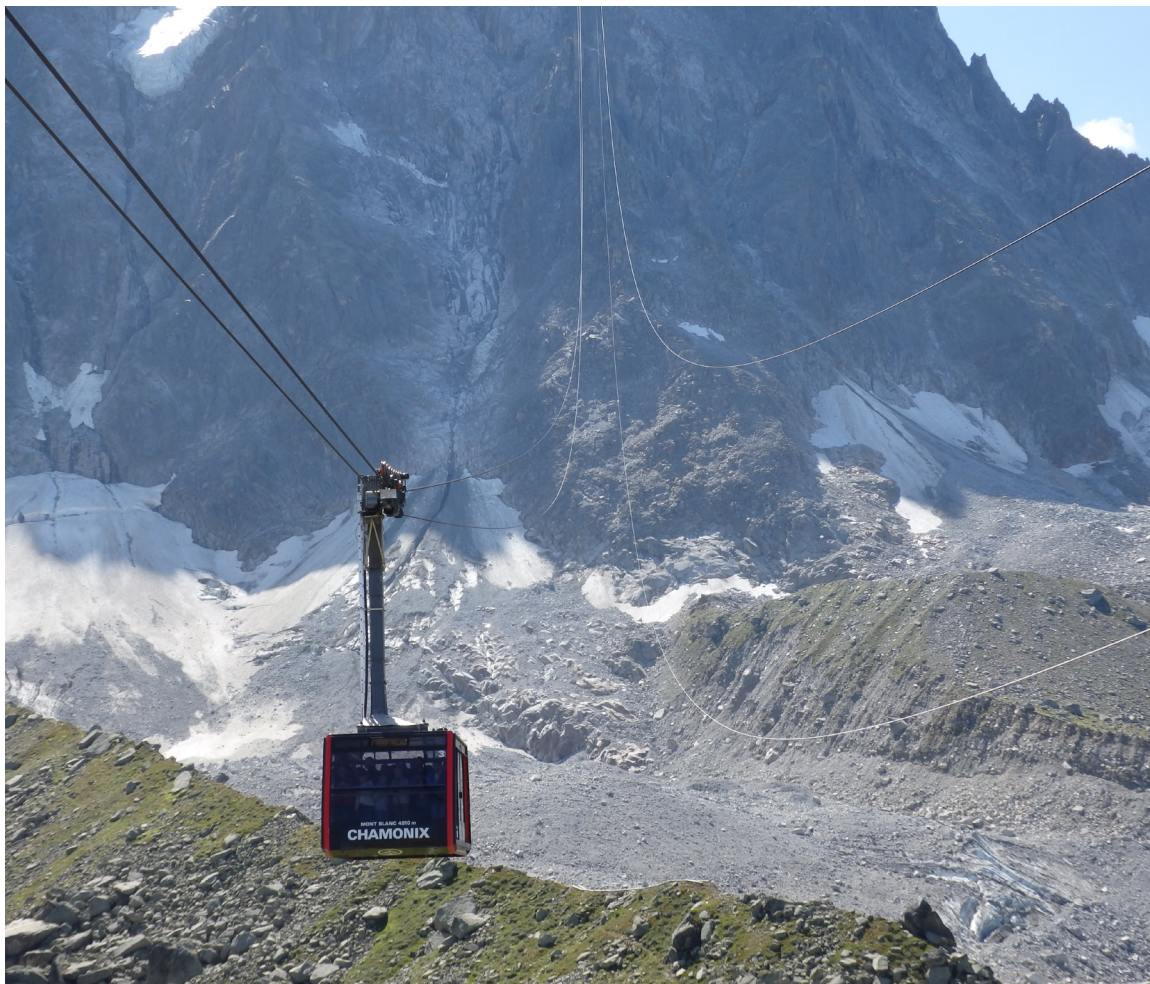
Trošu vagoniņš, pilns tūristu, ceļā no Francijas Alpu kūrorta Šamonī uz akmeņaino Aiguille du Midi

sekot ceļotāju bariem. Iespējams, ka 2020.gada vasarā tādu Šamonī vairs nav.