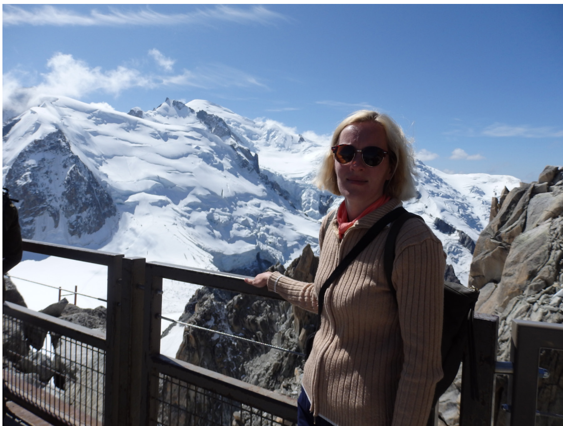
Mērķis – virsotne Aiguille du Midi – sasniegts! Kaut arī karsta vasaras diena, bez siltas jakas un ērtiem apaviem neiztikt

Brauciena galamērķis ir Šamonī dienvidu autoosta. Tā ir neliela, šķiet, relatīvi nesen izveidota, par ko liecina vagoniņi autoostai raksturīgo ēku vietā, taču pat šeit valda kaut kāda kārtība, salīdzinot ar Ženēvas autoostu. Nav arī problēmu saprast, kuŗā virzienā jādodas tālāk – atliek