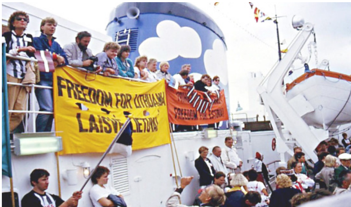
Brīvības kuģis piestāj Helsinku ostā