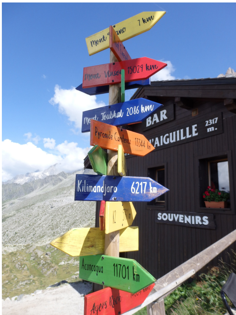
Starpstacija. Suvenīru kiosks, mini kafejnīca un norādes, cik kilometru mūs šķir no citām pasaules slavenākajām virsotnēm