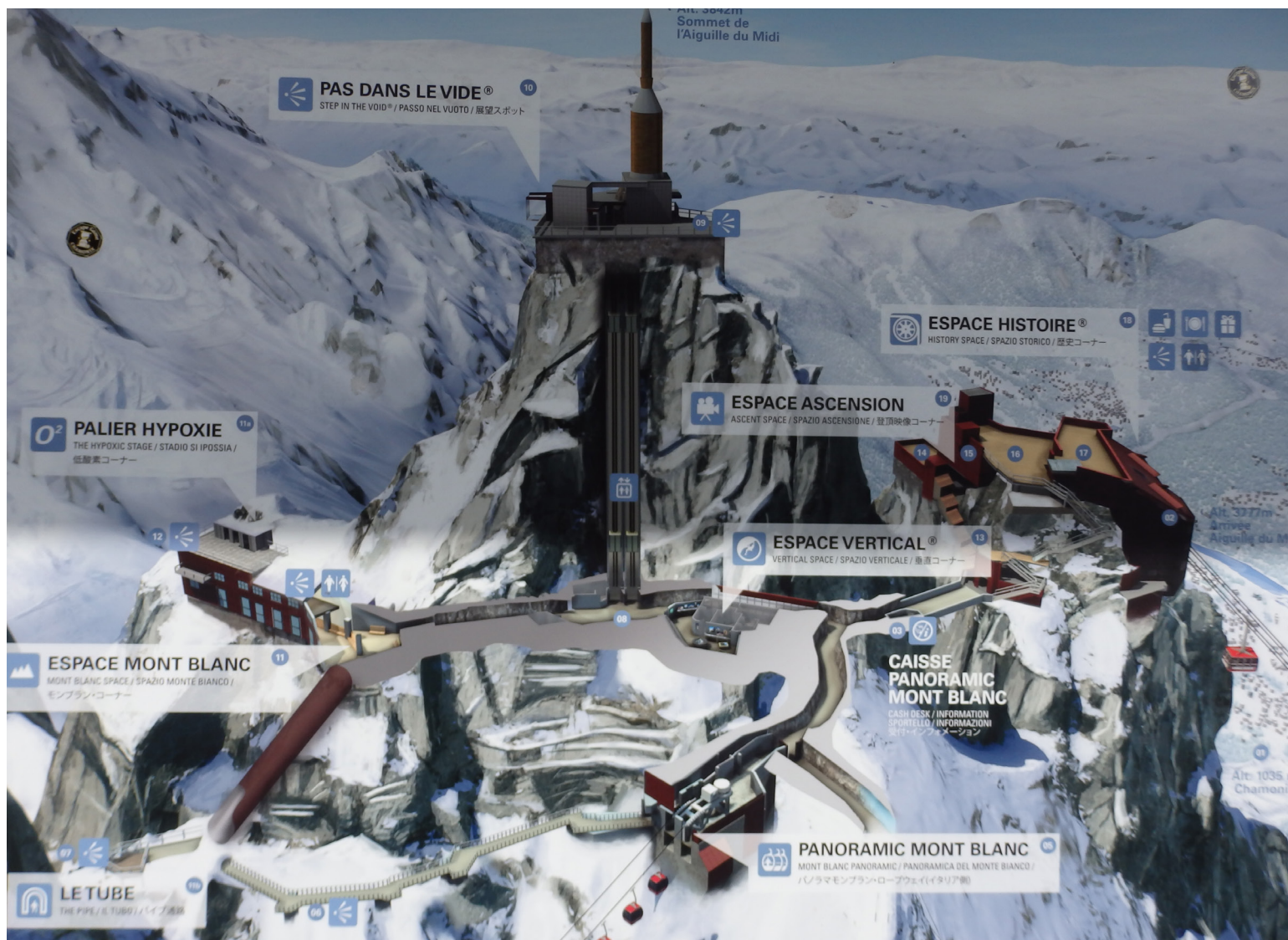
Par informācijas trūkumu Alpos sūdzēties nav pamata – ik uz soļa stendi, plāni, kartes

Iedvesmojošākais, kas palicis atmiņā no neparastā piedzīvojuma, ir Alpu varenība, arī tas, kā trošu vagoniņā dodoties arvien augstāk, krasi mainās aina. Vispirms skatam atklājas plaši meži, tad Alpu kalnu pļavas, bet noslēgumā ledāji un akmeņainas klintis. Šķiet absolūti neticami, ka cilvēks spējis pakļaut pat tādu stihiju kā kalnus!