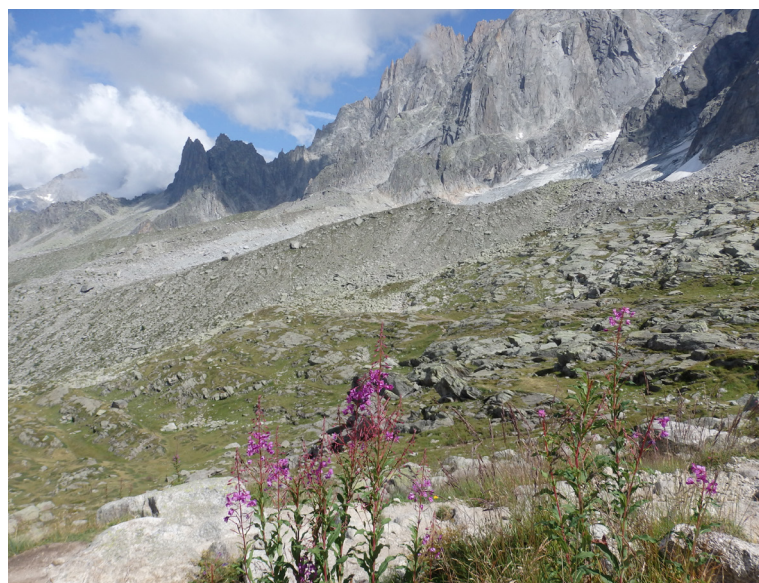
Starpstacija ar Alpu pļavām. Ceļvedī lasāms, ka šeit saimnieko mežāži, taču tos nekur nemanija