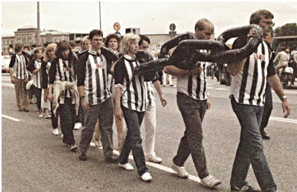
Nebrīves ķēde - simbols, kuŗu Tribunāla un Brīvības kuģa brauciena dalībnieki demonstrēja visās pilsētās, kur piestāja kuģis Baltic Star

kuŗi lauzu pulks. PSRS vēstniecība Somijā bija darījusi visu iespējamo, lai panāktu kuģa nelaišanu ostā, bet kāds Somijas pilsonis personīgi uzņēmās visu atbildību par notiekošo, tāpēc brauciena dalībnieki varēja izkāpt krastā. No ostas grupa devās pie pieminekļa, ko Somijā dzīvojoši igauņi kādreiz bija uzstādījuši patecībā somiem, kuŗi palīdzēja Igaunijas brīvības cīņās pēc Pirmā pasaules kara. Savukārt nākamajā dienā kuģis jau bija atpakaļ Stokholmā. Tur sagaidītajai pūlis bija nudien ievērojams! Atkal notika gājiens, ko vadīja cietumnieku drānās tēpti cilvēki simboliskās ķēdēs. Starp citu, klātesošos uzrunāja tālaika Pasauls Brīvo latviešu