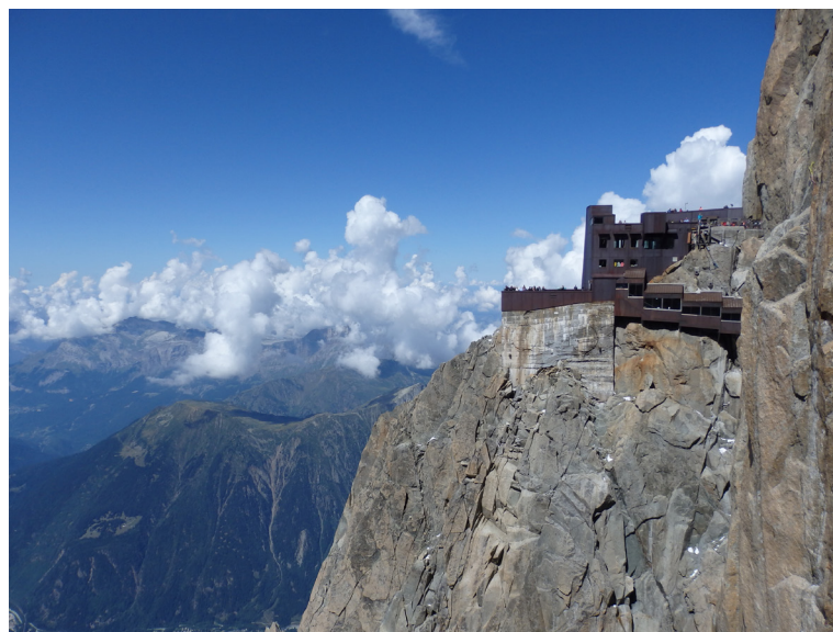
Arī Aiguille du Midi cilvēks spējis pakļaut savām vēlmēm un kaprīzēm. Par to liecina 3842 metrus augstumā iekārtotie skatu laukumi, tuneli, suvenīru veikaliņi, kafējnicā, restorāns un pat neliels muzejīņš