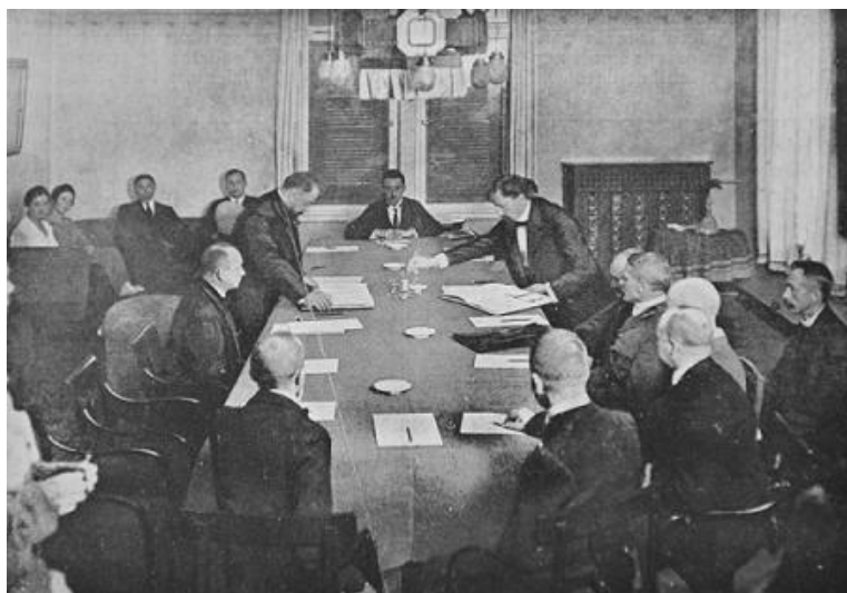
Miera līguma parakstīšana