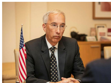
ASV vēstnieks Latvijā Džons Kārvails

ASV vēstnieks Latvijā Džons Kārvails sarunā ar portāla sargs.lv korespondentu uzteica Latvijas pusi risināt jautājumus arī krīzes situācijā.