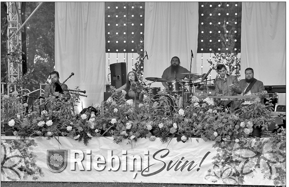
Музыкальное объединение «Raxtu-raxti» на сцене праздника Рибиньского края. Коллектив включает в себя незабываемое звучание, музыкальную интеллигенцию и народную силу!

Два ярких, разнообразных, интересных и весёлых дня в Рибиньском крае могли провести как жители края, так и гости, которые 1 и 2 августа посетили праздник нашего края 2020.