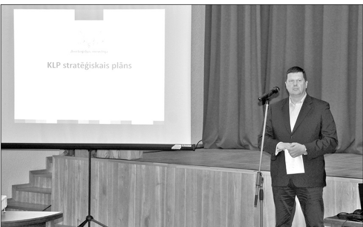
На встрече с крестьянами Латгалии в Центре культуры Рибиньского края министр земледелия Каспарс Герхардс сообщил, что ведётся работа, чтобы у малых и средних фермеров Латвии в ближайшие годы были надежды на большую поддержку из средств фондов ЕС.

30 июля Латвийская федерация крестьян и Прейльское объединение сельских хозяйств собрали крестьян в Рибиньском центре культуры на встречу с министром земледелия Каспарсом Герхардсом, чтобы ознакомиться с предложениями Общей сельскохозяйственной политики Европейского Союза на следующий период планирования. Число посетителей мероприятия – более 70 фермеров из нескольких краев Латгалии – свидетельствует о том, что есть необходимость и интерес к личной встрече.