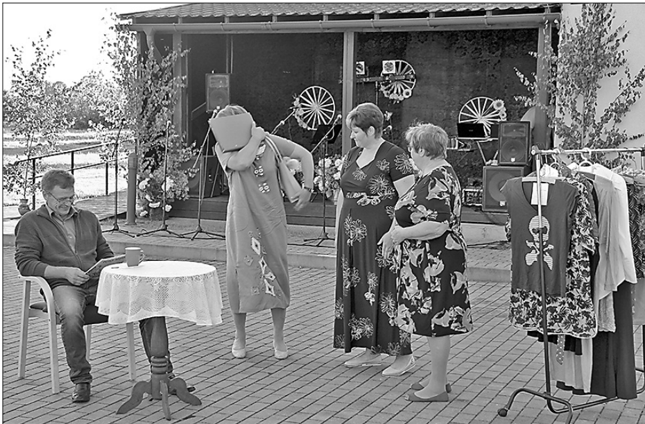
Сердечно и весело – небольшой спектакль Силюкалнсского любительского театра на празднике Силюкалнской волости.