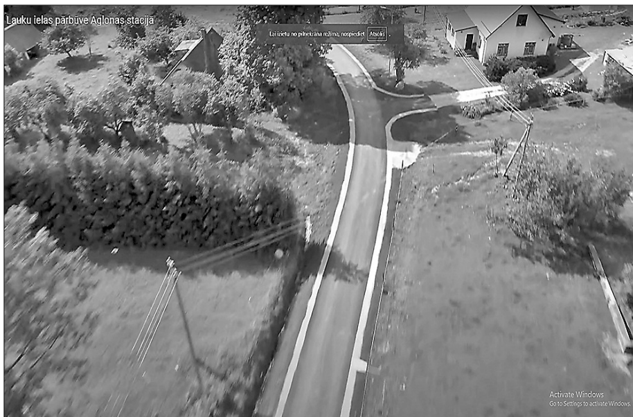
Вид на улицу Лауку в Рушонской волости с высоты птичьего полёта.

Дума Риебиньского края реализует проект, утверждённый Службой поддержки села в рамках Латвийской программы развития села на 2014 – 2020 год, в мероприятии «Основные услуги и восстановление посёлков в сельской местности» для улучшения инфраструктуры дорог самоуправления.