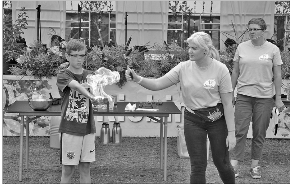
Второй день праздника края собрал много семей с детьми. Представители Даугавпилсского центра инноваций демонстрировали различные эксперименты. В некоторых могли поучаствовать и зрители.

Следует отметить, что праздник края фактически начался с 24 июля, когда были организованы праздники волостей с различными программами и концертами в Силаянах, Силокалсе и Рушоне, а в августе продолжатся в Стабулниеках и Галянах.