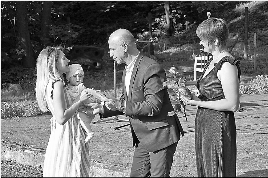
В рамках праздника Рушонской волости поздравили самых маленьких рушонцев. Председатель краевой думы Петерис Ржинскис поздравил семьи и младших детей и выразил благодарность и удовлетворение, что семьи решили свое будущее связать с родной Рушонской волостью.