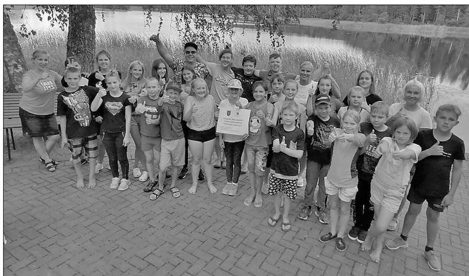
Это была действительно фантастическая неделя – признали все участники лагеря «В здоровом теле – здоровый дух».

Дума Риебиньского края в июне этого года получила решение Фонда интеграции общества об утверждении проекта № 2020.LV/GDP/17 «Летний лагерь для детей «В здоровом теле - здоровый дух»». Цель проекта – организовать летний лагерь для детей, таким образом, мотивируя детей и молодежь создавать дружественную среду вокруг себя и способствовать позитивному отношению в обществе.