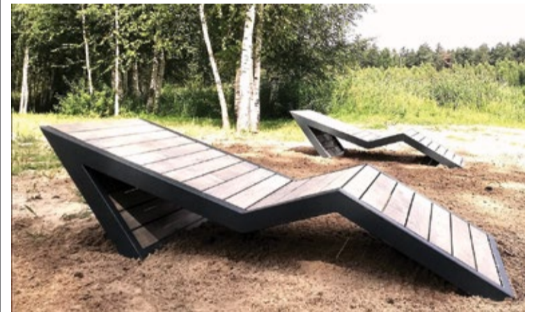
Jaunie sauļošanās zvilņi pie Titurgas ezera.