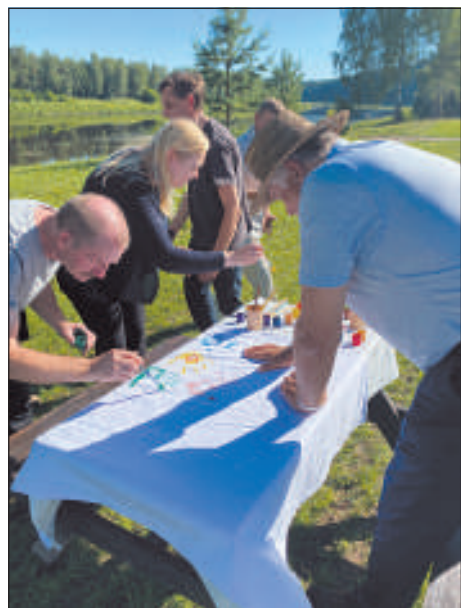
Процесс создания флага.