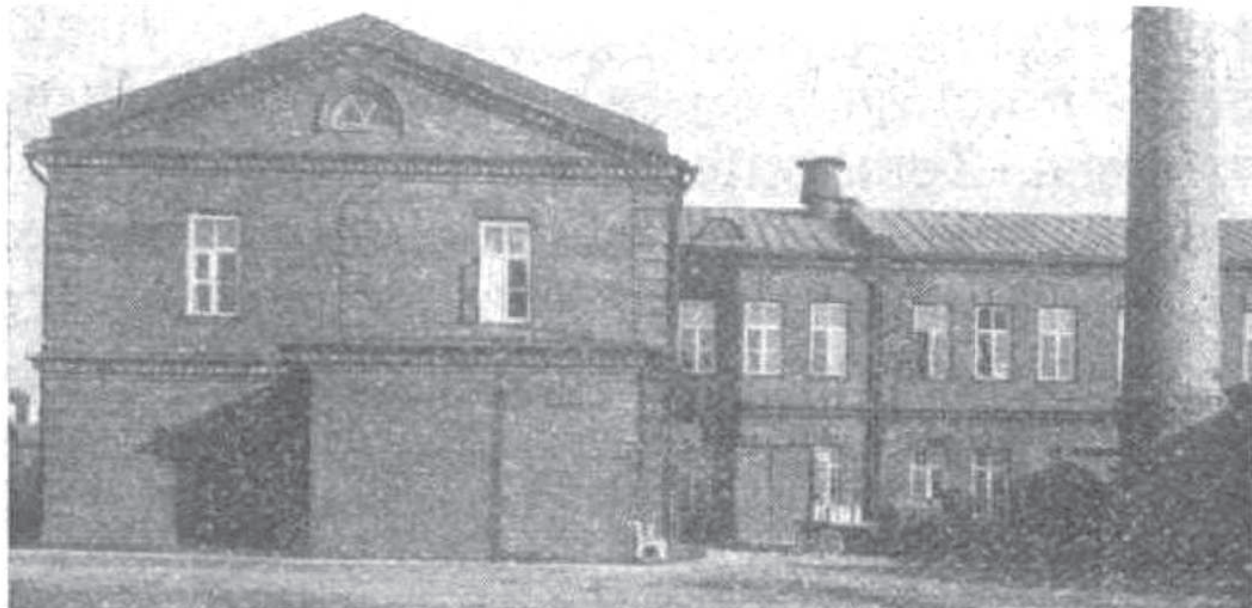
Молочное производство Даугавпилсского союза молочного хозяйства. Опубликовано в «Latvijas Iorkopis un piensaimnieks» в 1939 году.

Сегодня выбор мороженого в магазинах очень большой, есть приготовленное из нашего местного сырья — свежего молока, сливок, творога и масла. Но по составу промышленно произведенное мороженое — не самый полезный продукт, содержит много калорий, а то и вредные добавки — красители, растительные жиры и сахар. Невозможно себе представить лето без этого освежающего лакомства, поэтому определенно стоит самим попробовать приготовить его дома из натуральных, полезных продуктов, а для вкуса добавить ягод. ■