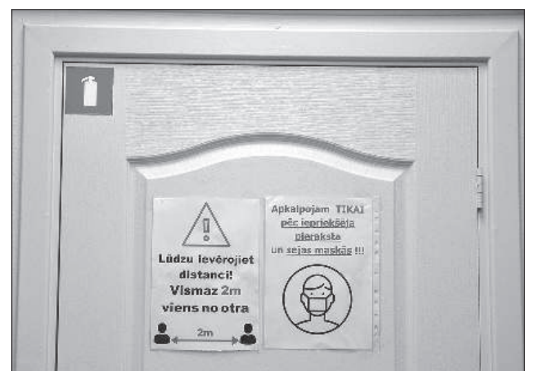
Предупреждающие обозначения на двери в социальной службе.