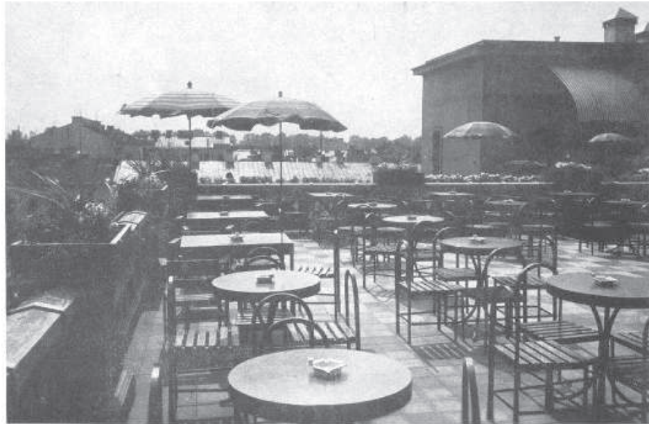
Кафе на крыше Дома Единства. Опубликовано в «Latvijas Arhitektūra» в 1939 году.

Спрос на молочные продукты и мороженое стремительно увеличивался, и в 1939 году «Латвийский Вестник» сообщил, что «правление города решило и позволило Даугавпилскому союзу молочного хозяйства открыть молочный ресторан, сдав в аренду на 3 года павильон в саду Виенибас. Он начнет работу уже во 2-й половине мая». В продаже на месте по низким ценам в молочном ресторане было свежее молоко, кефир, ряженка, вафли, разные булочки и разное мороженое, фруктовые соки, лимонады, конфеты. В павильоне звучало радио и было «обслуживание без чаевых».