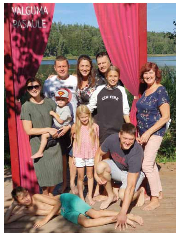
Visi desmit Baskāju takā.

„Ja bērns kopš mazotnes nav saņēmis savas tiesības uz mīlumu, siltumu un ēdienu, viņam pret apkārtējiem veidojas cita attieksme.”