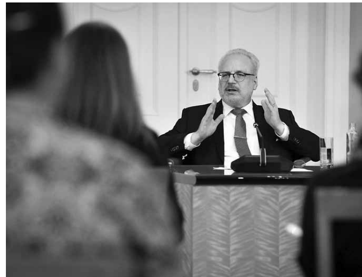
„Latvija ir nacionāla valsts, latviešu valoda ir kopīga visiem, un primāra ir latviskuma veicināšana,” uzsvēra Valsts prezidents Egils Levits.

Otrā daļa – dialogs ar sabiedrību, līdzdalība debatēs. Sabiedrība lielā mērā izdiskutē visus jautājumus. Jūs šajās debatēs esat svarīgs starposms. Piemēram, izglītībā vienlaikus notiek trīs reformas, un katram ir, ko teikt. Atsevišķos jautājumos man ir savs viedoklis. Un jums ir savs gan kā žurnālistiem, gan kā pilsoņiem. Piedaloties debatēs, mana priekšrocība ir tā, ka es esmu skaļāks. Mani vairāk dzird. Pēc tam esat jūs – arī jūs dzird vairāk nekā tos cilvēkus, kas nav žurnālisti. Taču, piemēram, māsiņai slimnīcā arī ir savs viedoklis.”