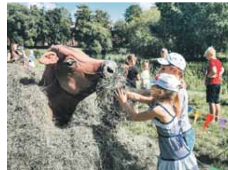
Organizatori sarūpējuši izklaidi arī mazajiem.