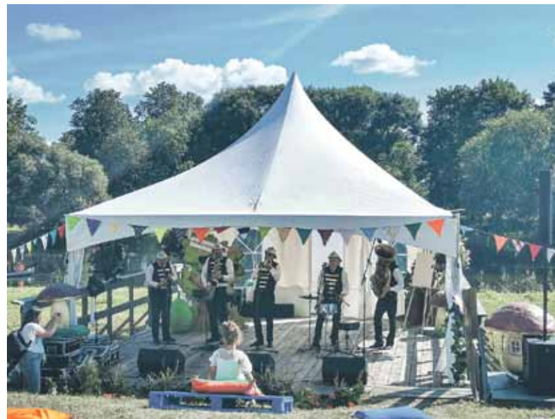
Elisas Rudzītes teksts un foto