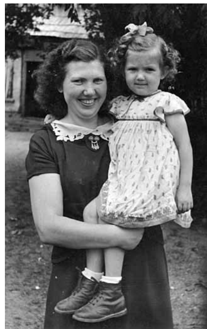
Mazā Vija ar mīlo mammīti, ko visi dēvējuši par leviņu.

Skrejoši. Tā kā ātrvilcienā. Man nekad nekas nav nācis viegli. Loterijās varu nepiedalīties! Jau skolā eksāmenos nebiju starp tiem, kuri varēja iemācīties piecas biļetes un vienu izvilkt. Bet, ja būšu smagi mācījusies, pat špikerus rakstījuši, izvilksu vieglu biļeti. Tas pats tagad. Jau no Kuldīgas Mākslas un humanitāro zinību skolas laikiem vadu kursus, daudz braukāju pa