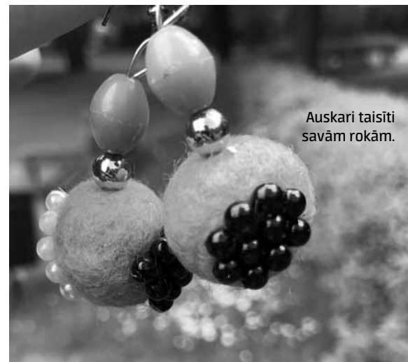
Auskari taisīti savām rokām.

„Iedvesma nāk arī no cilvēku vērošanas viņu ikdienas gaitās.”