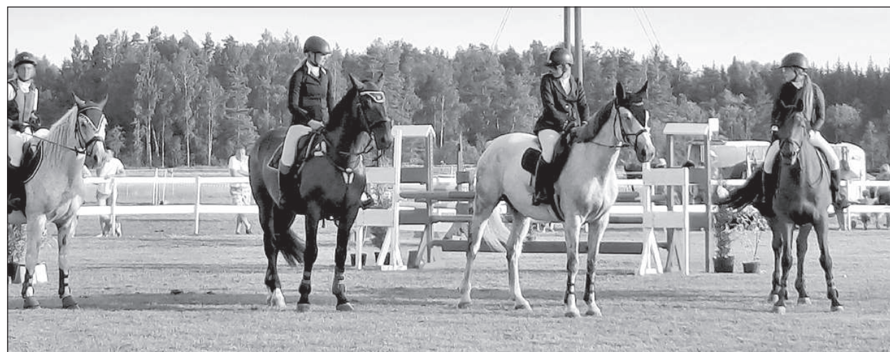
В ожидании результатов.

Соревнования организовало общество Любителей животных, при поддержке самоуправления Крустпилсского края и Крустпилсского волостного управления. ■