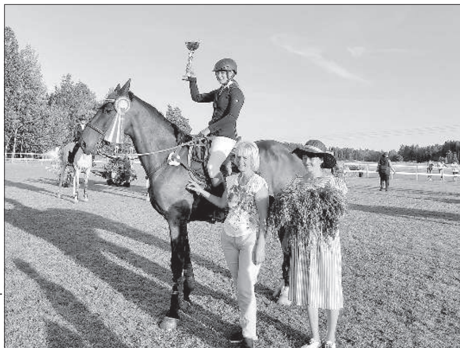
Лига Даге и Кродерс – первые!

В следующем маршруте, также с барьерами в 60 см, участвовали лоша-