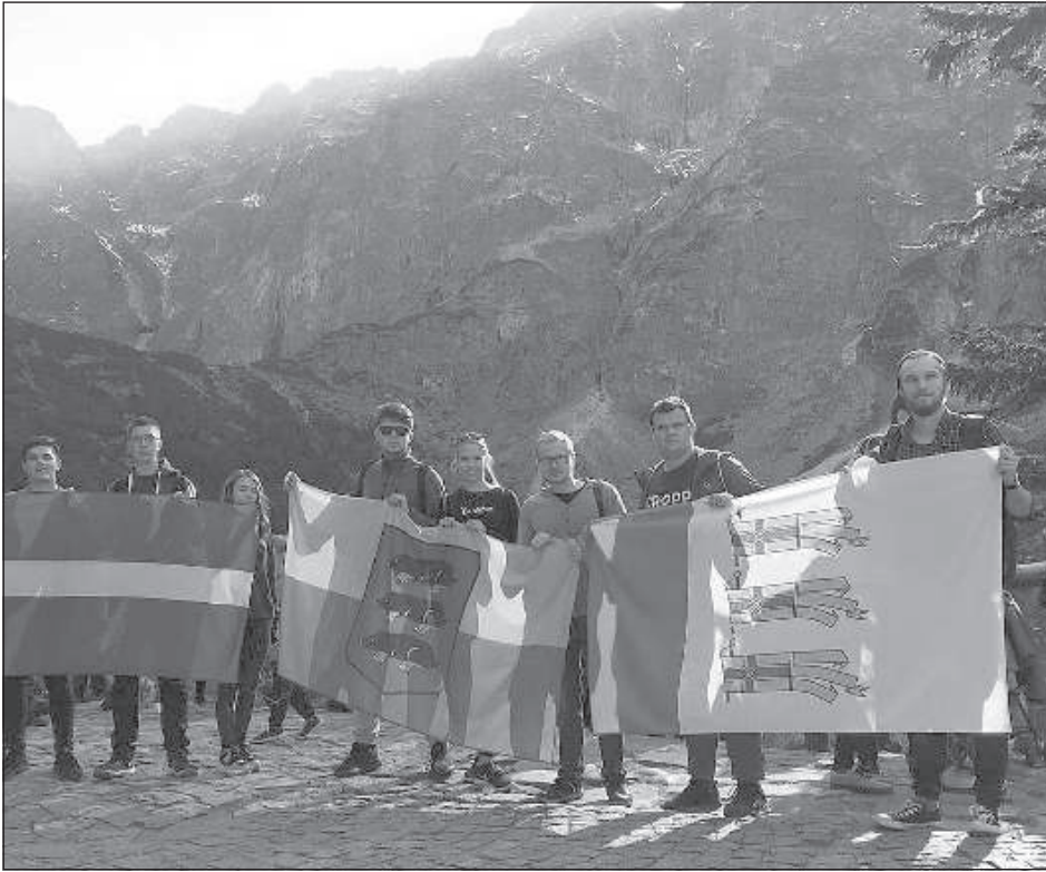
Вишкская молодежь в Польше.