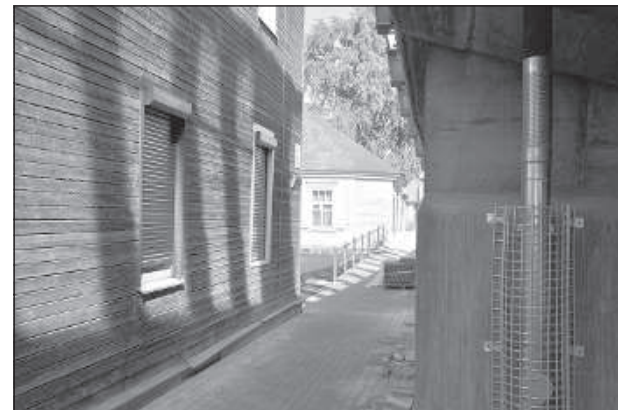
В тени моста.

Что касается установки камер видеонаблюдения под путепроводом, этот вопрос намечается рассмотреть через месяц на первом заседании комиссии по бюджету, возможно, средства будут запланированы в бюджете следующего года.