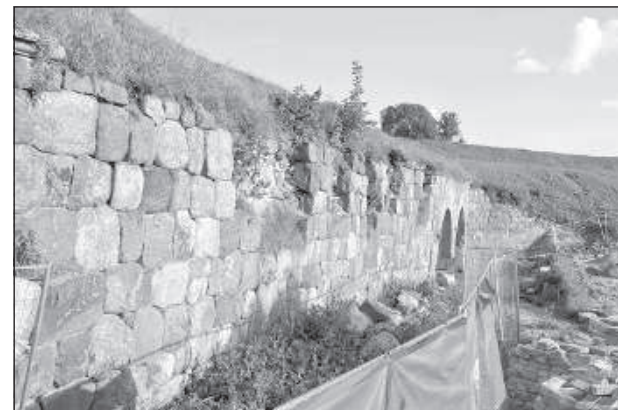
Откосная стена вала седьмого бастиона Даугавпилсской крепости.

7-й бастион – это земляное укрепление с валом и подземными помещениями для обороны и хранения боеприпасов напротив Даугавпилсского художественного центра Марка Ротко. Откосная стена построена из больших камней, она образует защитный вал со стороны противника. Общая протяженность защитного вала крепости превышает 3 километра, и по всей его