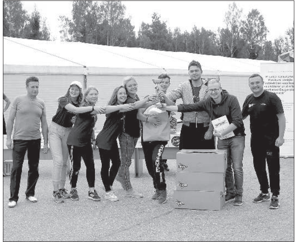
Вишкские ребята на молодежном слете Даугавпилсского края.