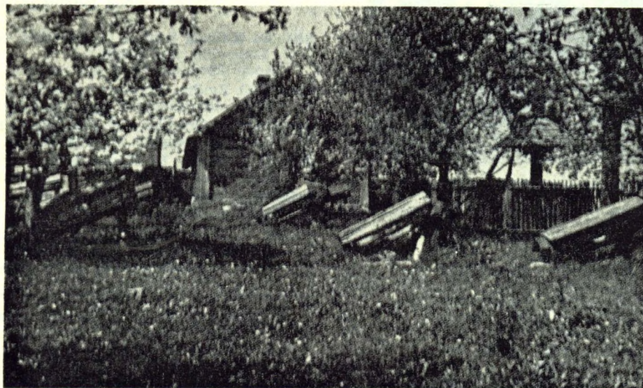
Viļakas pagosta Vedinišu sātas dōrzs; priškā ōbelneicās un bišu kūzuli.