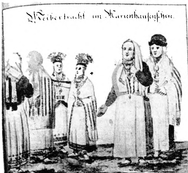
Sivišu apgērbs Viļakā 1797. godā. J. C. Brotzes zaimējums.

gar obejom ustobas sīncm, dažas nu tom kūka ramūs. Kōktā zam svātbiļdem — mozs trejsstyura plaukteņš ar „mūceņu“ — Krystā systō tālu un bu- teleite ar tymā ilyktim pyupolu zorim un papeira pučem. Styurī zam svātbiļdem nalels golds, aiz tō sūli, pīnoglōti pi sīnas. Pa labi nu gola lūga kari- nej izšyuts dvīlis. Sīnas izlyppnōtas ar vacom avī- zem, lai naapmastō un apkvāpušō sīna byutu glu- da un gaiša,