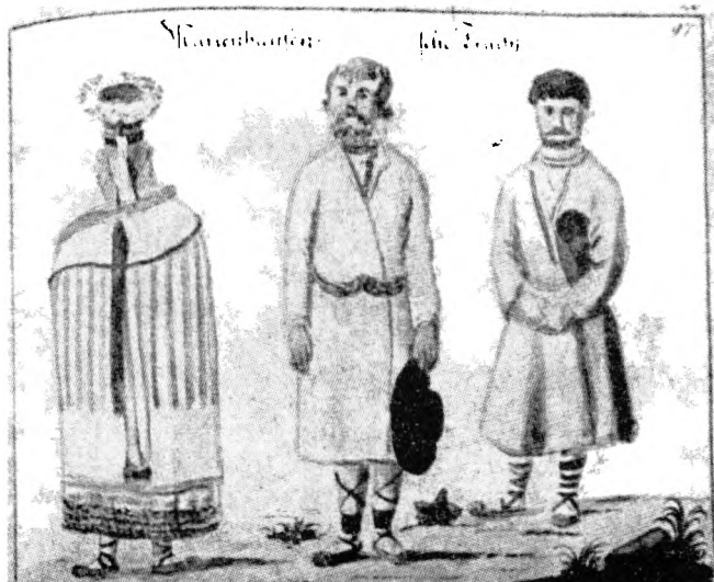
Sivišu un veirišu apgērbs Viļakā 1797. godā. J. C. Brotzes zaimējums.

Ustobas ikōrtōjumu verīs plānā. Tei ar škārssi- nom, skapi un priķškorim sadaleita 4 daļōs. Gultā pi gola sīnas guļ saiminīks ar saimineicu, turpat — ūtrā gultā — obi jūs dālāni. Tymā pošā ustobas daļā pi sīnas pīstyprynōts plaukteņš ar lampeņu, nalels sīnas skapeits un natōli nu grīstim — kōr- teņa drēbu uzlikšonai.