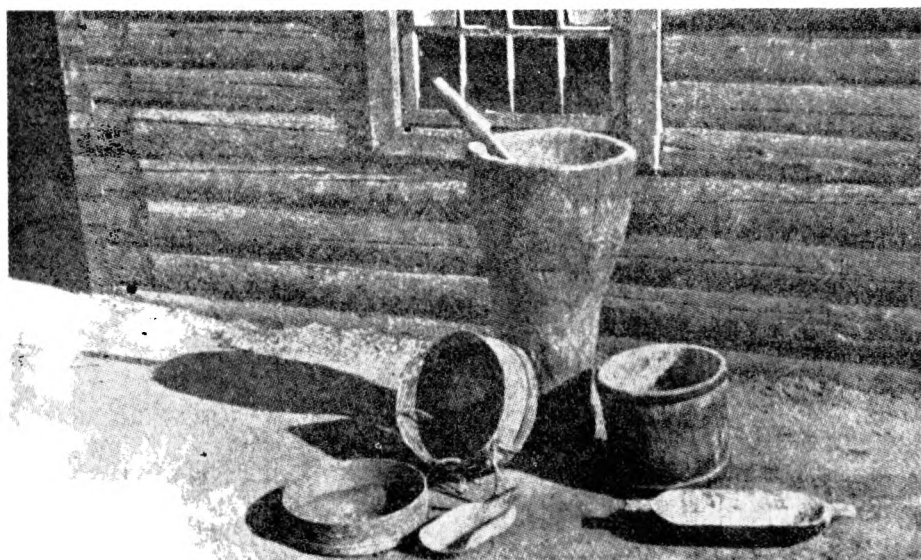
Saimņiceibas trauki, Viļakas Vēdinišūs.

Nōkušū ustobas daļu, pa kreisi nu iejas duro- vom, pretim cepļam, nu pōrejōs ustobas atdola na- krōsōtu dēļu škārssīna; ari te, pi sīnas golda pusē, dažas svātbiļdes, beī plaukteņa zam tom nav. Pi