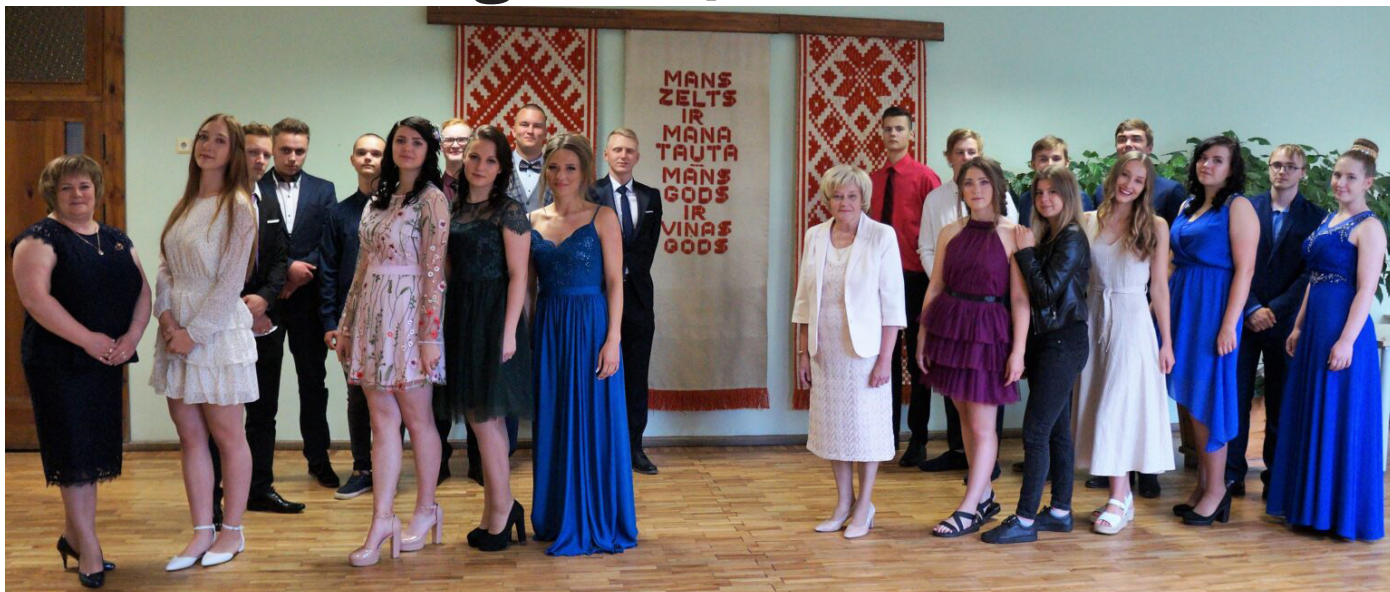
Krimuldas vidusskolas 12.klases izlaidumā