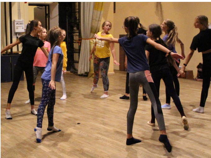
Laiks tika pavadīts daudzveidīgās deju nodarbībās

No 2. līdz 8. augustam noritēja nometne “Dejotprieks 2020” Krimuldas Mūzikas un mākslas skolas deju nodaļas audzēkņiem. Nometne norisinājās Kurzemes pusē, Kandavā.