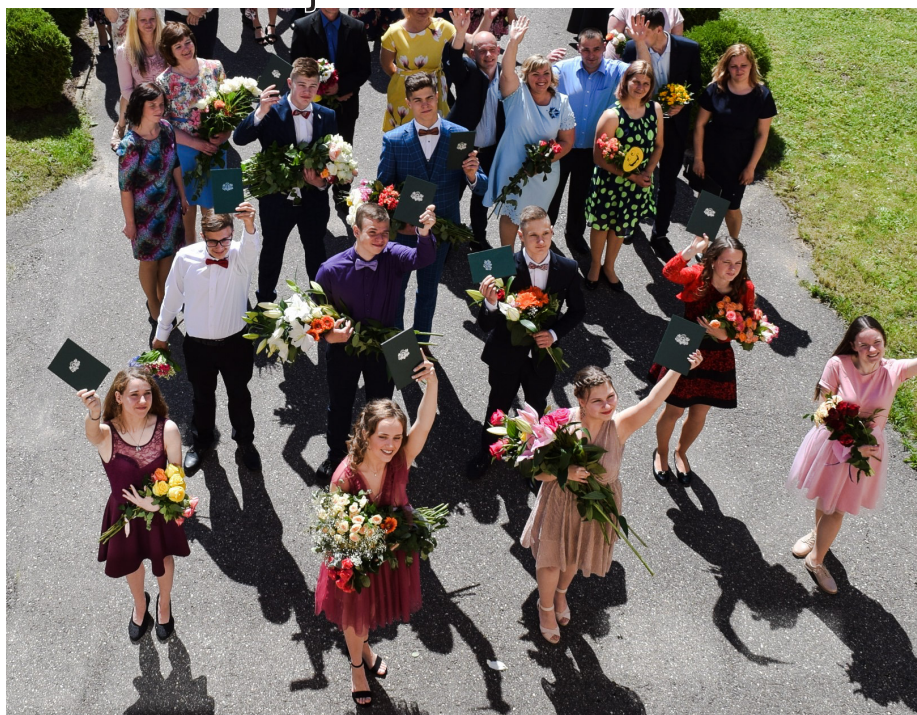
Lēdurgas pamatskolas 9. klase izlaidumā

Šis laiks veidoja skolēnos patstāvību un atbildības sajūtu, jaunākajās klasēs to palīdzēja darīt vecāki. Paldies vecākiem par