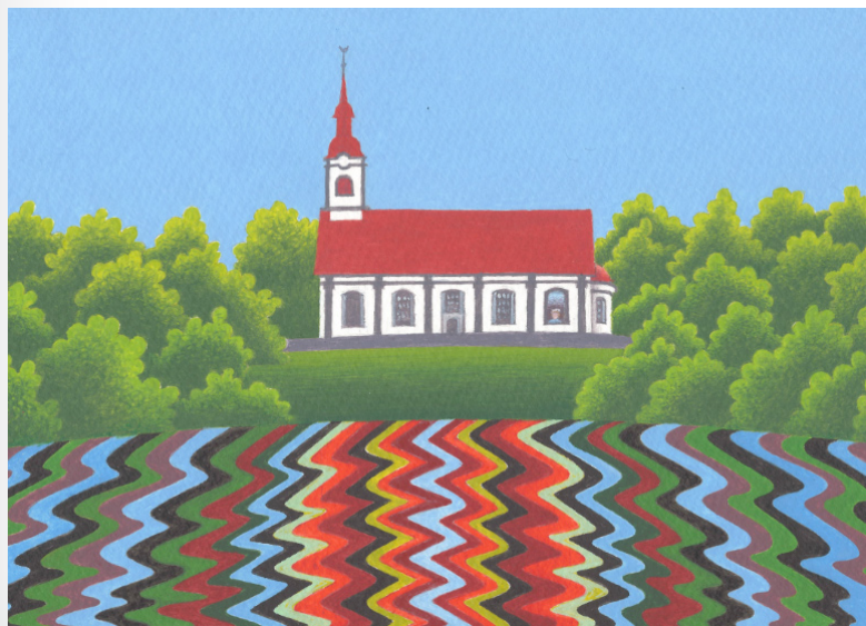
Autors: Vitolds Kucins

Pasākuma ietvaros tiks atklāta gājēju ietve un informatīvie stendi par Lēdurgas ēku vēsturi.