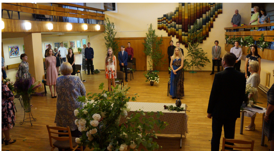
Krimuldas vidusskolas 9.klases izlaidumā