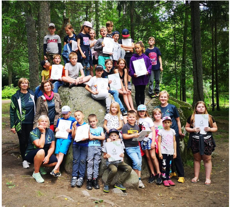
Nometnes dalībnieki pie Mudurgu dižakmens. Noslēgumā visiem bērniem tika pasniegtas Ceļotāja apliecības un dāvanas no pašvaldības visiem