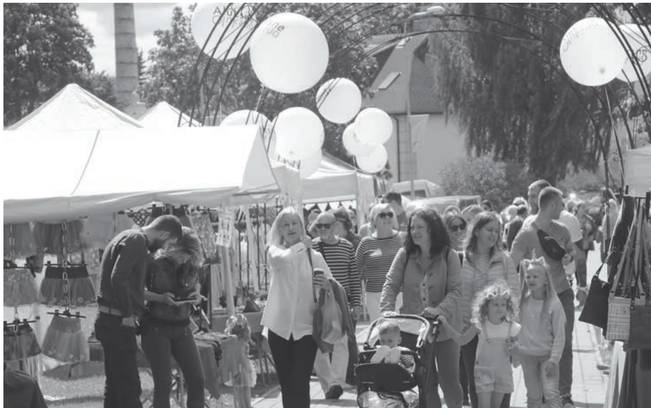
Ierastajā amatnieku tirdziņā šogad amatnieki no Alūksnes un kaimiņu novadiem