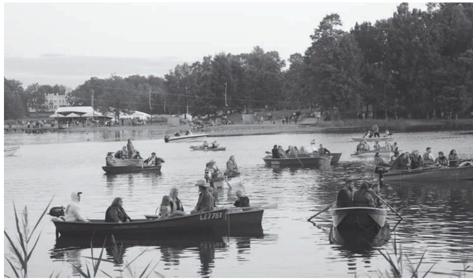
Pilsētas svētkos alūksnieši piedzīvoja arī pirmo laivu koncertu romantiskās saulrieta noskaņās ar grupu "Saldās sejas"