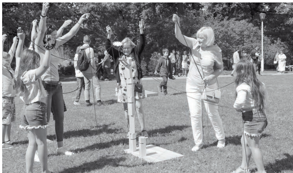
Pie Alūksnes Jaunās pils notika dažādas norises - muzicēja vietējie mūziķi, varēja uzrakstīt vēlējumu Alūksnei simtgadē un piedalīties Alūksnes pilsētas bibliotēkas aktivitātēs