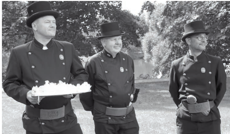
Mazajiem alūksniešiem, kas dzimuši kopš pērnajiem pilsētas svētkiem, tika pa laimes pogai no skursteņslaucītāju rokām