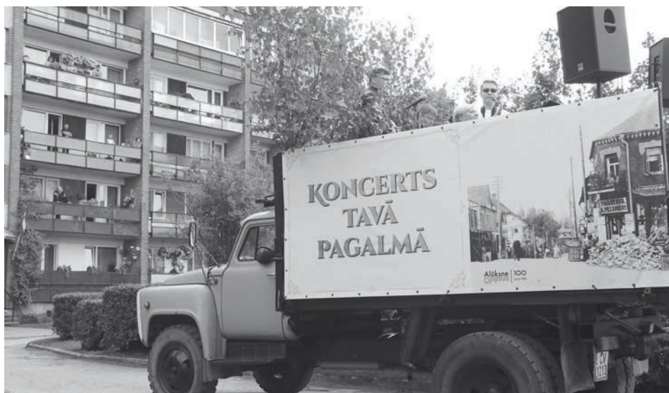
"Koncerts Tavā pagalmā" - šādi rotāts auto sestdien iebruca vairākos pagalmos un publiskās vietās, lai priecētu svētkos tos, kuri šoreiz bija izvēlējušies palikt mājās

Alūksnes pilsētas svētki šogad, ņemot vērā vispārējo situāciju valstī un pasaulē, notika pavisam citādi kā bija plānoti. Lai gan šogad ar daudzveidīgu pasākumu programmu būtu jāsvēti Alūksnes Gadsimta svētki, tos nāksies pārcelt uz nākamo gadu. Toties šajos svētkos alūksnieši un pilsētas viesi piedzīvoja daudz interesantu, iepriekš nebijušu norišu.