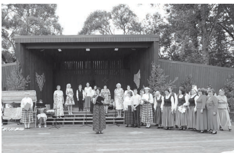
Svētkos atklāta pārbūvētā Liepņas estrāde

Savukārt tautas namā bija iespēja aplūkot rokdarbu pulciņa darbu izstādi, iegādāties kādu pašu gatavotu vai rūpnieciski ražotu produktu. Savukārt vakarā