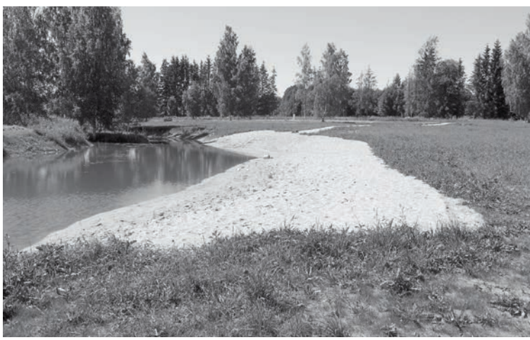
Ierīkota atpūtas vieta Pededzes centrā

Pededzes pagasta pārvalde sadarbībā ar biedrību "Alūksnes lauku partnerība" pabeigusi Eiropas Lauksaimniecības fonda lauku attīstībai (ELFLA) finansētā projekta "Ģimeņu atpūtas vietas ierīkošana Pededzē" īstenošanu Pededzes centrā radīta plaša, sakārtota, brīvi pieejama atpūtas vieta pie ūdens.