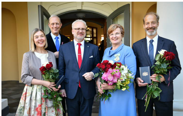
Latvijas Valsts prezidents Egils Levits kopā ar mūsu izcilajiem tautiešiem (no kreisās) Māru Šimani, Kārlis Streipu, Inesi Birznieci un Paulu Raudsepu

Par Triju Zvaigžņu ordeņa virsnieci iecelta bijusī Latvijas Tautas