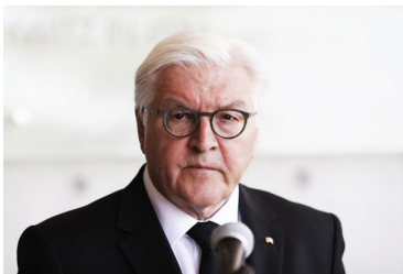
Franks Valters Šteinmeijers

Valsts prezidents Egils Levits 20. augustā pa tālruni sazinājās ar Vācijas prezidentu Franku Valteru Šteinmeieru ( Frank-Walter Steinmeier ), apspriežot situāciju Baltkrievijā.