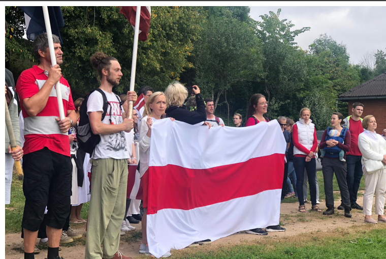
Atbalsta akcija Piedrujā

vecuma cilvēki, kā arī vairāki politiķi. Atbalsta ķēdes dalībniekiem rokās ir baltisarkanbaltais Baltkrievijas karogs, kā arī Latvijas, Lietuvas un Igaunijas karogi. Ķēdes noslēgumā pie Latvijas Tautas Frontes muzeja cilvēkiem rokās ir liels Baltkrievijas karogs, kuŗš stiepjas visas Vecpilsētas ielas garumā. Uz akciju bija ieradusies dažāda gadagājuma cilvēki gan jauni, gan veci, ar