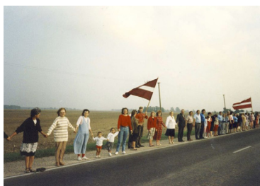
Baltijas ceļš

Pirms deviņiem gadiem Eiropas Parlamentā tika oficiāli pieņemta un izsludināta deklarācija „Par 23. augusta pasludināšanu par Eiropas staļinisma un nacisma upuru atceres dienu”, aicinot arī nacionālos parlamentus pasludināt 23. augustu, dienu, kad tika noslēgts Molotova-Ribentropa pakts, par staļinisma un nacisma noziegumu upuru piemiņas dienu.