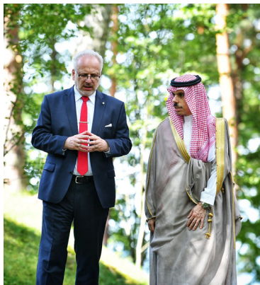
Saūda Arabijas ārlietu ministrs vizītē pie Valsts prezidenta Egila Levita

Latviju 20. augustā pirmo reizi apmeklēja Saūda Arabijas ārlietu ministrs, princis Faisals Binfarhāns Ālsaūds.