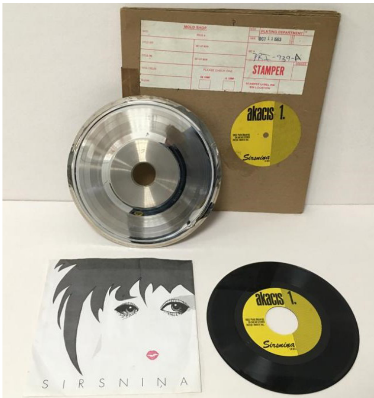
Grupas "Akacis" singls "Sirsnīņa" un tās ražošanas "stempers" (vinila plates metāla matrica), izdots 1983. gadā ASV. Vāka dizainu veidojis mākslinieks Aivars Šmits

nēja un atskaņoja trimdas latviešu jaunieši. Trimdas rokgrupu sniegums ātri kļuva pieprasīts – mūzikas ieraksti tika sūtīti no vienas valsts uz citu, jaunieši latviešu nometnēs un sarīkojumos visā pasaulē dziedāja un dejoja pie tām pašām dziesmām.